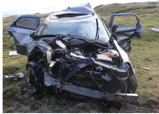
Mynd 1: Fólksbifreiðin á slysstað eftir að hafa verið velt yfir á hjólin.