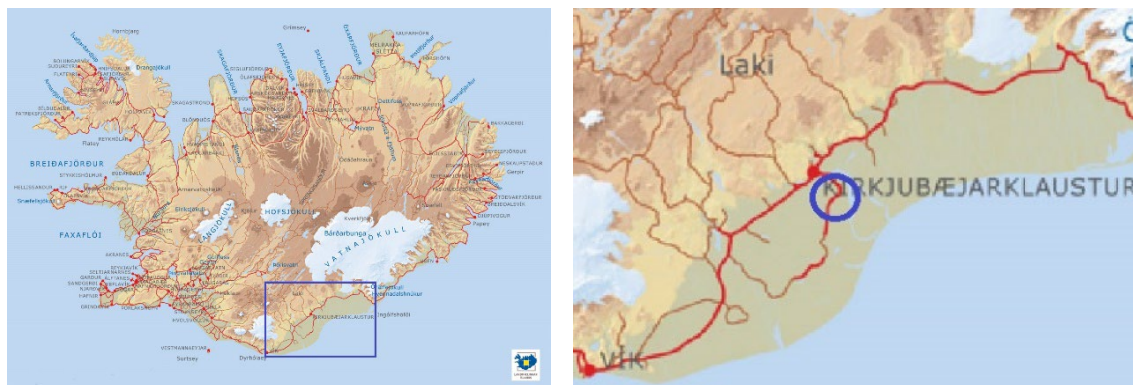
Mynd 1. Slysið varð á Meðallandsvegi skammt frá Kirkjubæjarklaustri, við Þykkvabæ 3.