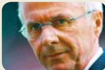
Sven Göran Eriksson, þjálfari City.

Sven-Göran Eriksson hefur lofað stuðningsmönnum Man. City að þeir muni ekki þurfa að horfa á eftir Micah Richards líkt og þegar Shaun-Wright Phillips fór til Chelsea fyrir metfé á sínum tíma. Eriksson segir City vera í góðum höndum hjá nýja eigandanum Thaksin Shinawatra og félagið þurfi ekki á peningnum að halda. „Ég skil áhyggjur stuðningsmannana en held að þær séu óþarfar. Ég hefði aldrei