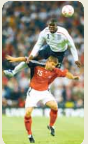
Micah Richards hefur gríðarlegan stökkkraft, eins og sést vel á þessari mynd.

Sá sænski hefur sagt frá því að eitt það fyrsta sem hann gerði á sinni fyrstu æfingu með City var að spyrja Micah hvar á vellinum hann vildi spila. Svareð sem Eriksson fékk frá Micah var eftirfarandi: „Mér gæti ekki verið meira sama.“