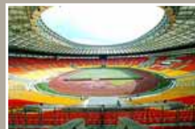
Luzhniki er einn glæsilegasti leikvangur Evrópu.

Þegar hefur verið ákveðið að úrslitaleikur Meistaradeildarinnar árið 2009 fari fram á Ólympíuleikvanginum í Róm.