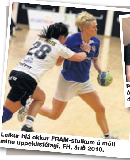
* Leikur hjá okkur FRAM-stúlkum á móti mínu uppeldisfélagi, FH, árið 2010.