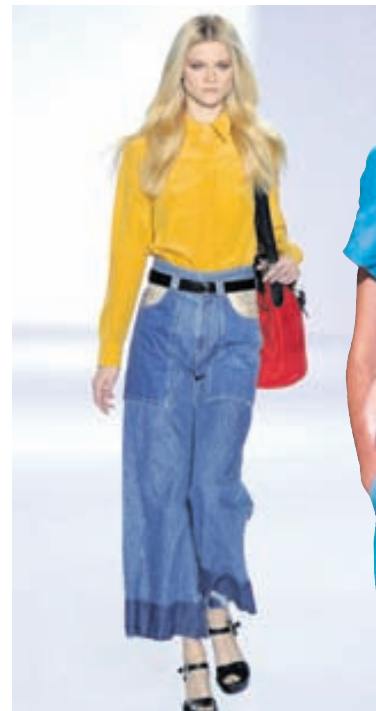
Gallabuxur Víðar og stuttar buxur við fallega gula skyrtu.