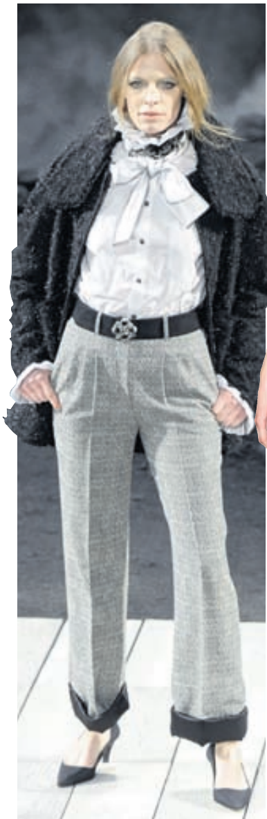
Chanel Útviðar dragtarbuxur með upp-ábroti hjá Chanel.