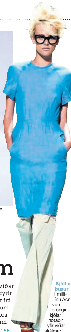
Kjöll og buxur Í millilínu Acne voru þröngir kjólar notaðir yfir víðar skálmur.