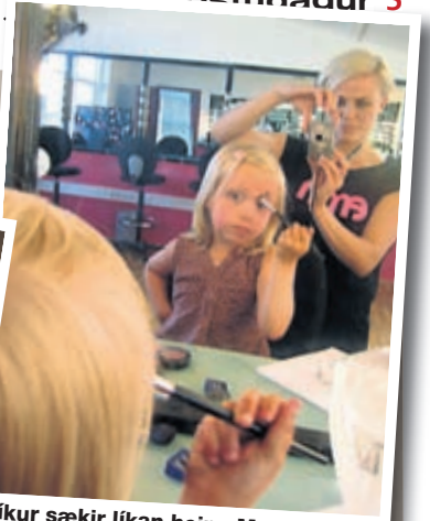
Líkur sækir líkan heim. Mynd tekin af stelpunni minni að mála sig í EMM School of Make Up þar sem ég var kennari.