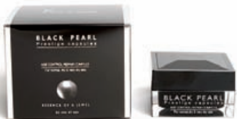
Serum hylki, lúxus andlitskrem 5.990,-