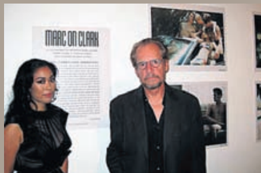
Ég fór einnig í party hjá nýju tímariti sem heitir The Dirty Dirty Diary. Sjúklega flott og ögrandi blað. Í því var meðal annars tiskubúttur sem Larry Clark og Marc Jacobs gerðu saman. Á myndinni má sjá herra Clark sjálfan með unnustu sinni.