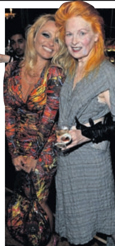
LITRÍKAR VINKONUR Hönnuðurinn Vivienne Westwood og kynbomban Pamela Anderson stilla sér upp saman baksviðs eftir sýningu þeirrar fyrrnefndu.