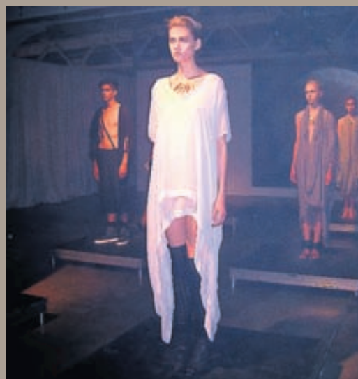
Mynd frá tískusýningu Complexgeometrics. Fötin voru fin og frjálstleg, ég er að fíla allt sem er gegnsætt þessa dagna.