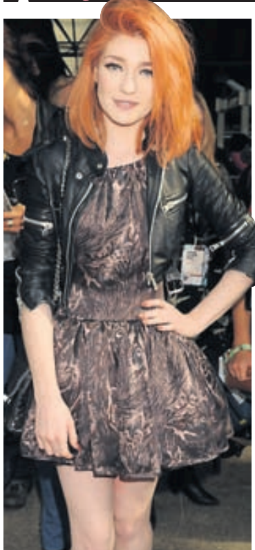
SÖNGFUGL Söngkonan Nicola Roberts var á meðal gesta á sýningu TopShop Unique og klæddist þessum flotta leðurjakka við það tilefni.