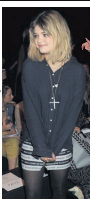
VILLINGUR Rokkarabarnið Pixie Geldof mætti á tískusýningu Twenty8Twelve, sem er tiskumerki leikkonunnar Sienna Miller.