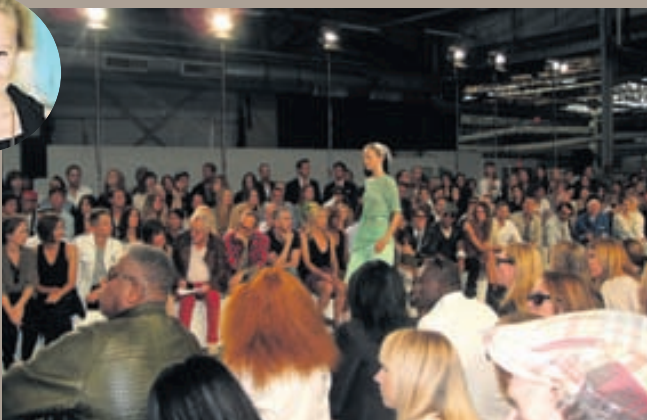
Frá sýningu Alexanders Wang. Fyrir framan mig sitja Andre Leon og Grace Coddington. Á móti má svo sjá ljósmyndagoðið Terry Richardson, söngkonuna MIA og svo tónlistarmanninn Lenny Kravitz.