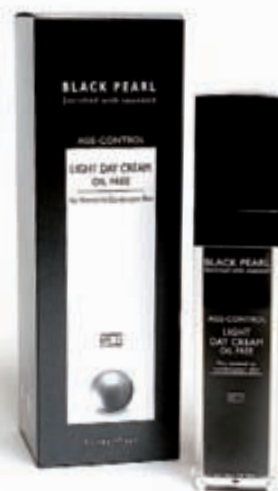
Létt dagkrem 3.690,-