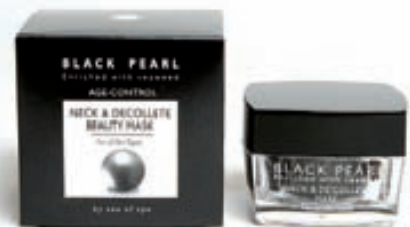
Háls og bringukrem 3.590,-