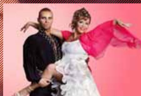
STELPUARNAR - kl. 21:05