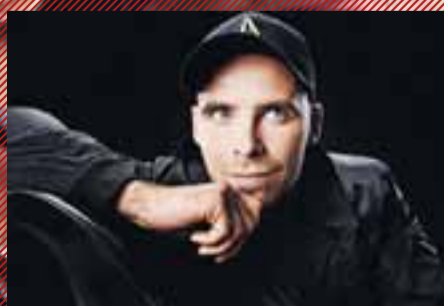
TEKINN 2 - kl. 20:35