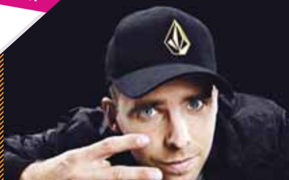
TEKINN - kl. 20:35