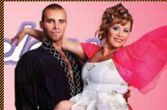
STELPURNAR - kl. 21:05