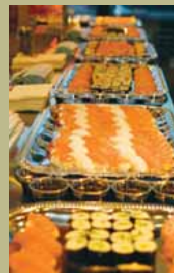
KRÆSINGARNAR VORU EKKI AF VERRI ENDANUM. Það er aldrei hægt að borða of mikið af sushi- og maki-rúllum.