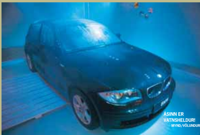
ÁSINN ER VATNSHELDUR!

B&L hélt veglegt teiti til að vekja athygli á ásnun en hann er minnsti BMW-inn sem er framleiddur. Ásinn er töffaralegur og það var teitið líka sem var haldið í Saltfélaginu innan um Eames-húsgögn og falleg fót úr versluninni GK. Gestalistinn var ekki af lakara taginu, heldur smartheita-elíta landsins, sem hámaði í sig sushi sem skolað var niður með hvítvíni meðan allir brostu framan í alla og höfðu gaman af.