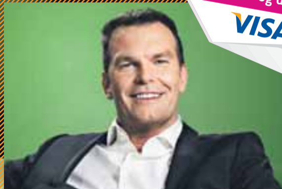
LOGI Í BEINNI - kl. 20:00