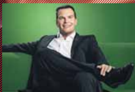
LOGI Í BEINNI - kl. 20:00

X-FACTOR Við erum að ræða málin og athuga hvort þeir geti hjálpað mér að koma Jógvan á framfæri hér og eins og málin líta út er aldrei að vita nema hann komist með í tónleikaferð með sigurvegurinum hérna úti. Það er alvörupakki í risastórum tónleikahöllum.”