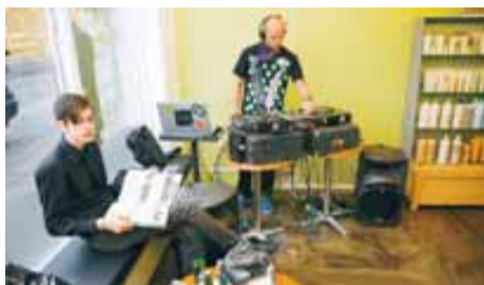
PLÖTUSNÚÐUR í góðu stuði á hárhönnun