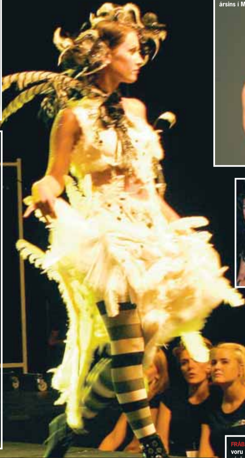
FRÁBÆRT HÁR Haldnar voru glæsilegar sýningar þar sem nýjasta tíska var kynnt fyrir áhugasama.