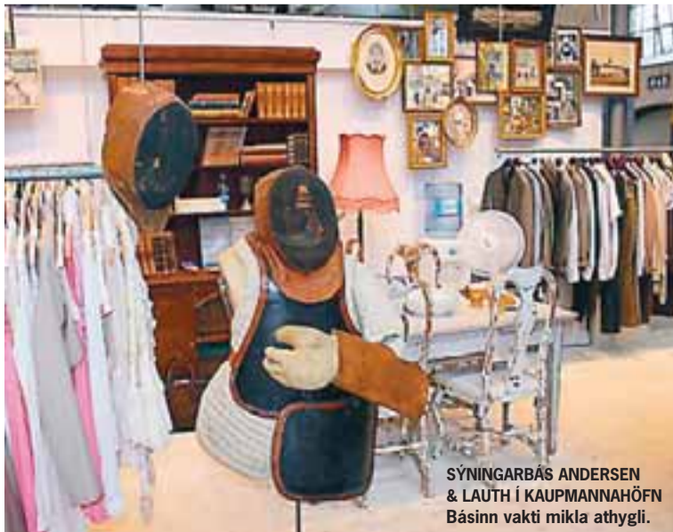
SÝNINGARBÁS ANDERSEN & LAUTH Í KAUPMANNAHÖFN Básinn vakti mikla athygli.