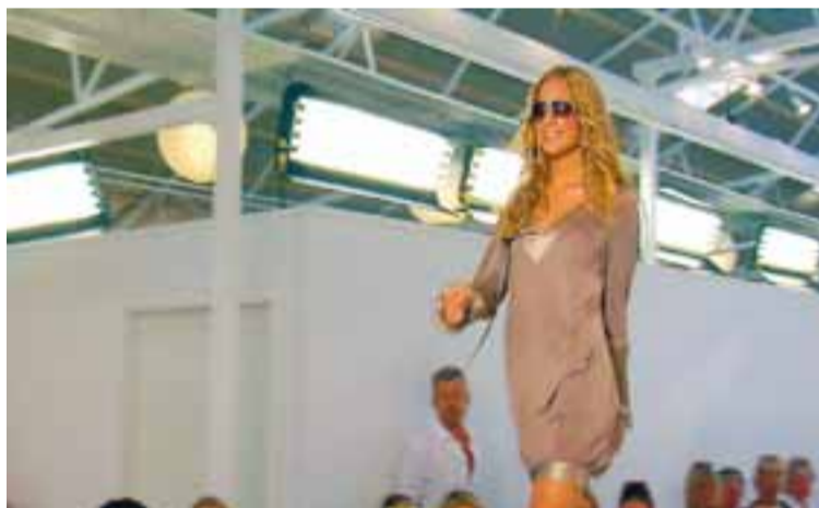
SKVÍSUGANGURINN Í ALGLEYMINGI! Mjúkir litir eru áberandi.