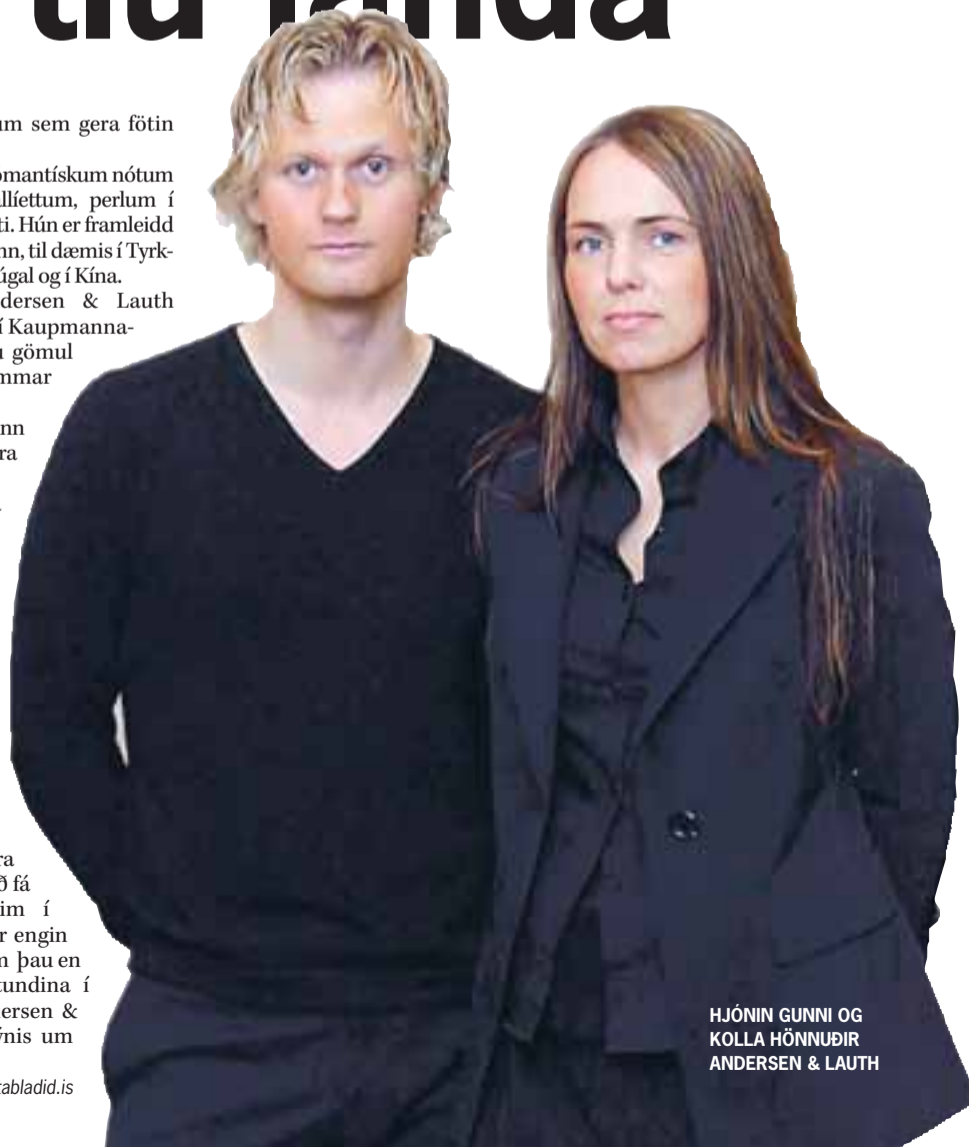
HJÓNIN GUNNI OG KOLLA HÖNNUÐIR ANDERSEN & LAUTH