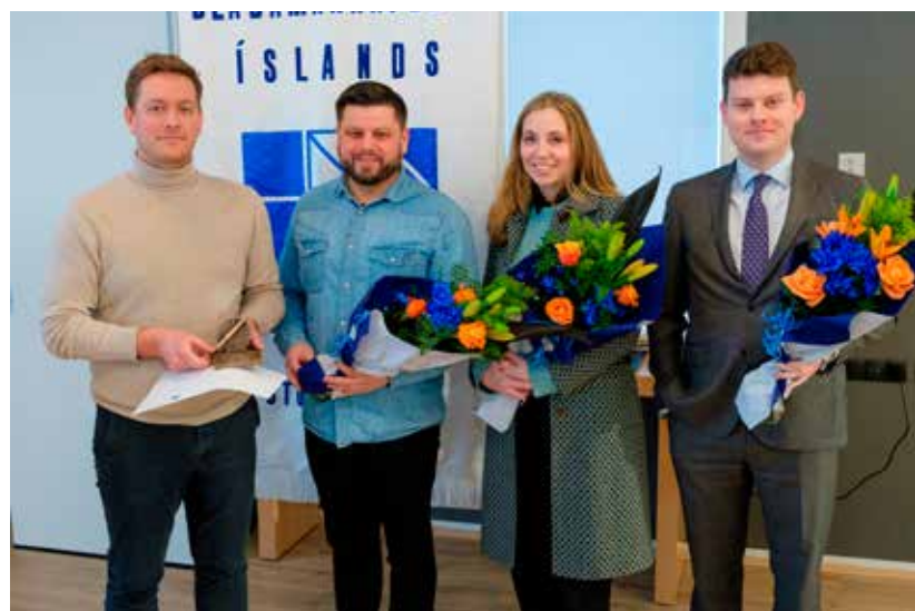
Tilnefndir í flokknum Rannsóknarblaðamennska ársins.