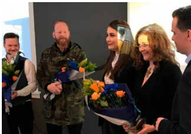
Tilnefndir í flokknum Viðtal ársins.