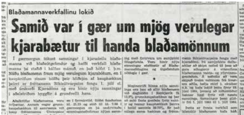
Frétt í Þjóðviljanum um verkfall blaðamanna 1963.

Ívar segir ennfremur í skýrslunni að fyrir stjórnarmenn í Blaðamannafélagi Íslands hafi verkfallið verið alveg ný og þörf reynsla, og fyrir félagið í heild og félagi þess ótvírátt styrkleikamerki. Þessi reynsla hafi jafnframt fært stjórn félagsins heim sanninn um að nauðsynlegt var að breyta sumum atriðum í samþykktum félagsins til að fyrirbyggja í framtíðinni ýmsa hnökra við áþekkar aðstæður. Meginrök okkar í deilunni við