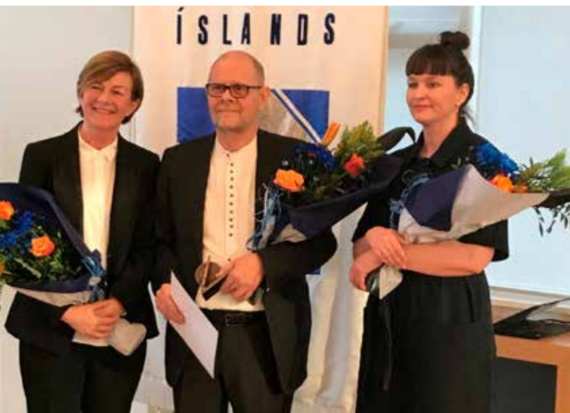
Tilnefndir í flokknum Bláðamannaverðlaun ársins.

við Al Jazeera og Wikileaks um ásakanir á hendur Samherja um mútugreiðslur í tengslum við starfsemi fyrirtækisins í Namibíu. Umfjöllunin byggði á staðhæfingum fyrrum starfsmanns Samherja í Namibíu og miklu magni gagna sem einnig voru gerð aðgengileg almenningi á netinu samhliða birtingu fréttar af málinu. Umfjöllunin hefur haft mikil áhrif, bæði hér heima og erlendis.