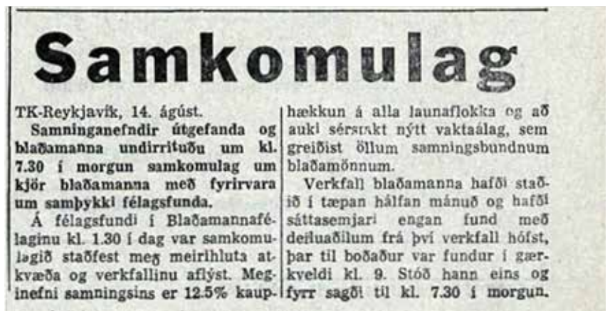
Frétt í Tímanum um fyrsta verkfallið.

ársins 1962 og byrjun þess næsta ríkis mikill órói á íslenskum vinnumarkaði, hjá verkalýðsfélagunum og launþegum hins opinbera, ríkis og sveitarfélaga; samfelldur og stöðugur vöxtur verðbólgu þrýsti á kröfur um kauphækkunar sem urðu með hverri vikunni og mánuðinum háværingu og kröftugri. Á árunum 1961 og 1962 höfðu almennu stéttarfélagin náð fram launahækkunum, allt að 8-12% og þegar 1963 gekk í garð þótti launþegum hins opinbera komið að sér, þar á meðal