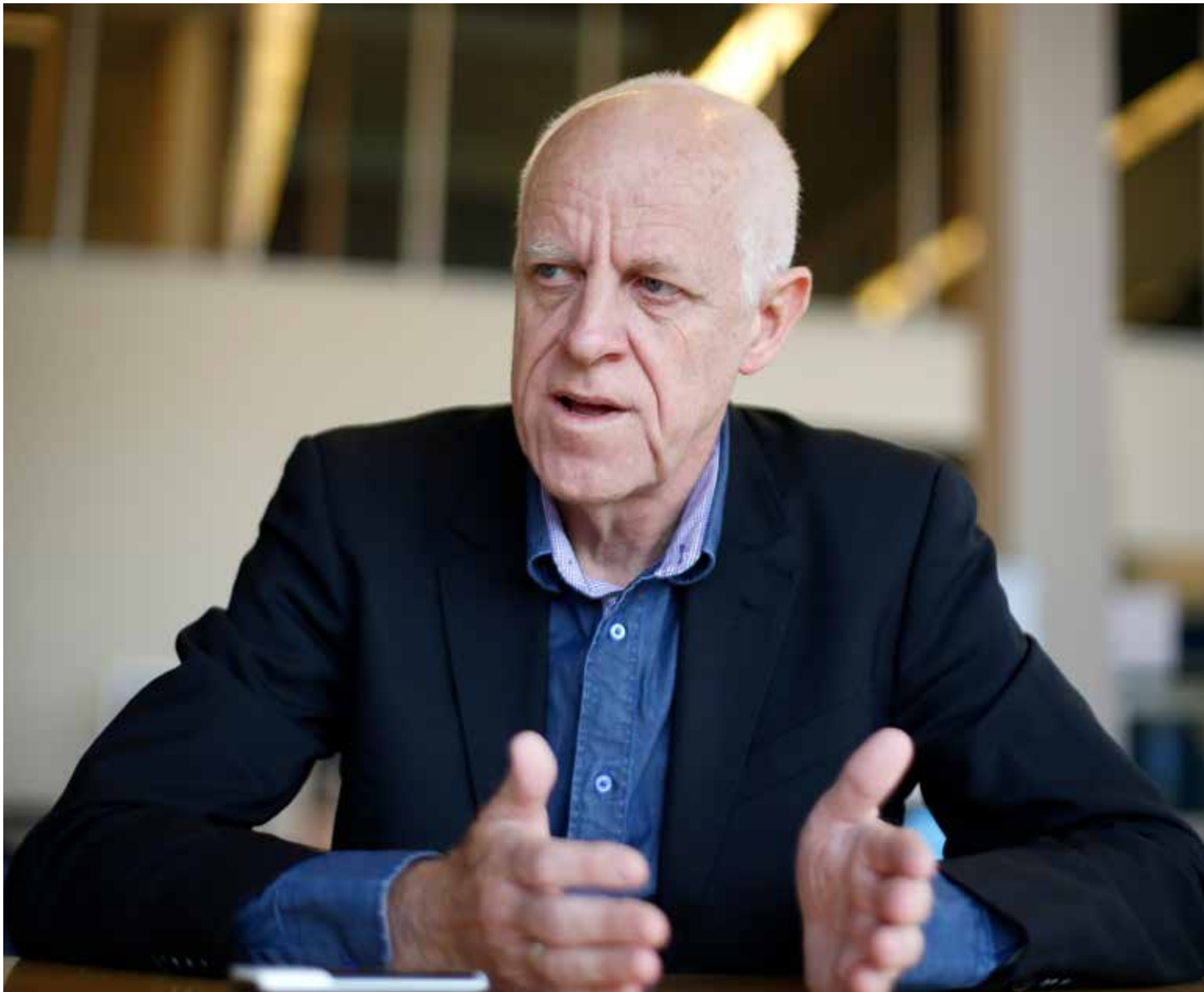
Mogens Blicher Bjerregard, formaður Evrópusamtaka blaðamanna (EFJ)