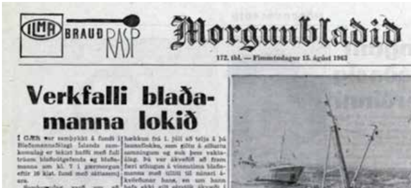
Frétt í Morgunblaðinu um fyrstu verkfallsátök blaðamanna.

fréttamönnum á fréttastofu útvarpsins en þeir höfðu ekki fengið kjarabætur sem neinu næmi um lengri tíma. Nú þótti þeim sem tími væri kominn til að ganga til samninga við sig og fá stærri hlut í vexti hinna sameiginlegu þjóðar- tekna síðustu ára. Bandalag þeirra á landsvísi, BSRB, sem annaðist samningamálin gagnvart hinu opinbera, ríki og sveitarfélögum, lagði fram kröfur um verulegar kauphækkunar.