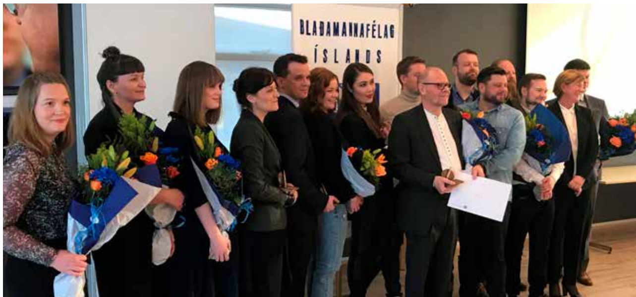
Hópur tilnefndra við veitingu Blaðamannaverðlaunanna.