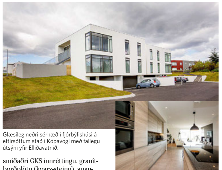
Glæsileg neðri sérhæð í fjórþýlishúsi á eftirsóttum stað í Kópavogi með fallegu útsýni yfir Elliðavatnið.

Gengið út á hellulagða verönd frá hjónaherbergi. Baðherbergi flísalagt með sturtuklefa. Stofa með parketi og þaðan gengið út á rúmgóðan pall. Eldhús með sér-