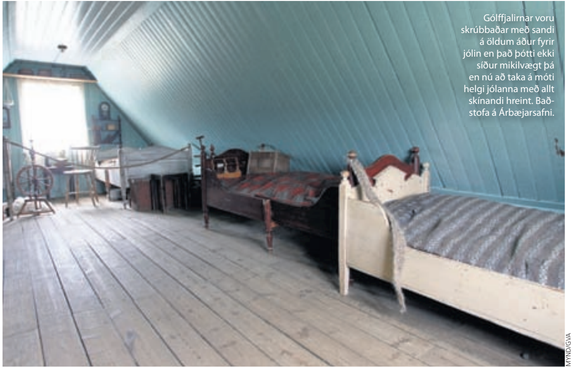
Gólfjalirnar voru skrúbbaðar með sandi á öldum áður fyrir jólin en það þótti ekki síður mikilvægt þá en nú að taka á móti helgi jóllanna með allt skínandi hreint. Baðstofa á Árbæjarsafni.

innanstokksmuni. Jólahreingerningunni hefur verið mikil aðgerð þar sem ekki var hægt að stóla á hreinsiefni og þvottavélar eins og í dag. Allt tau var þvegið í höndunum og vatnið í þvottana hitað á hlóðum. Trégólf voru sandskúruð og moldargólf sópuð, hnífapör og annar húsbúnaður úr málm var þússað upp úr ösku og rúmföt og