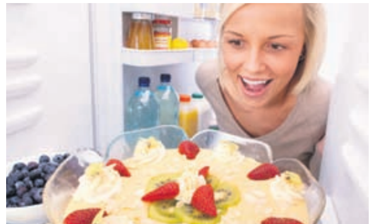
Kræsingarnar þurfa að komast fyrir í ísskápnum.