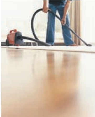
Jólahreingerningunni í dag er talsvert léttari aðgerð með aðstoð nútíma græja eins og ryksuga og þvottavéla.

Íslendingar skrúbbuðu bæi sína hátt og lágt nokkrum dögum fyrir jól og þrifu alla