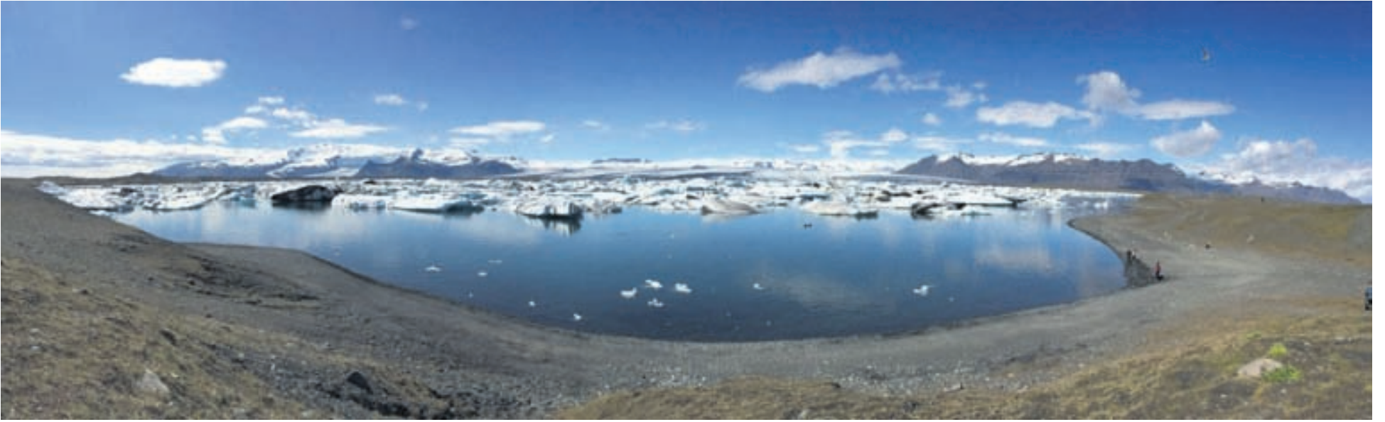
Jökulsárlón í allri sinni feegurð síðasta sumar en þann daginn var myndavélin mikið notuð.