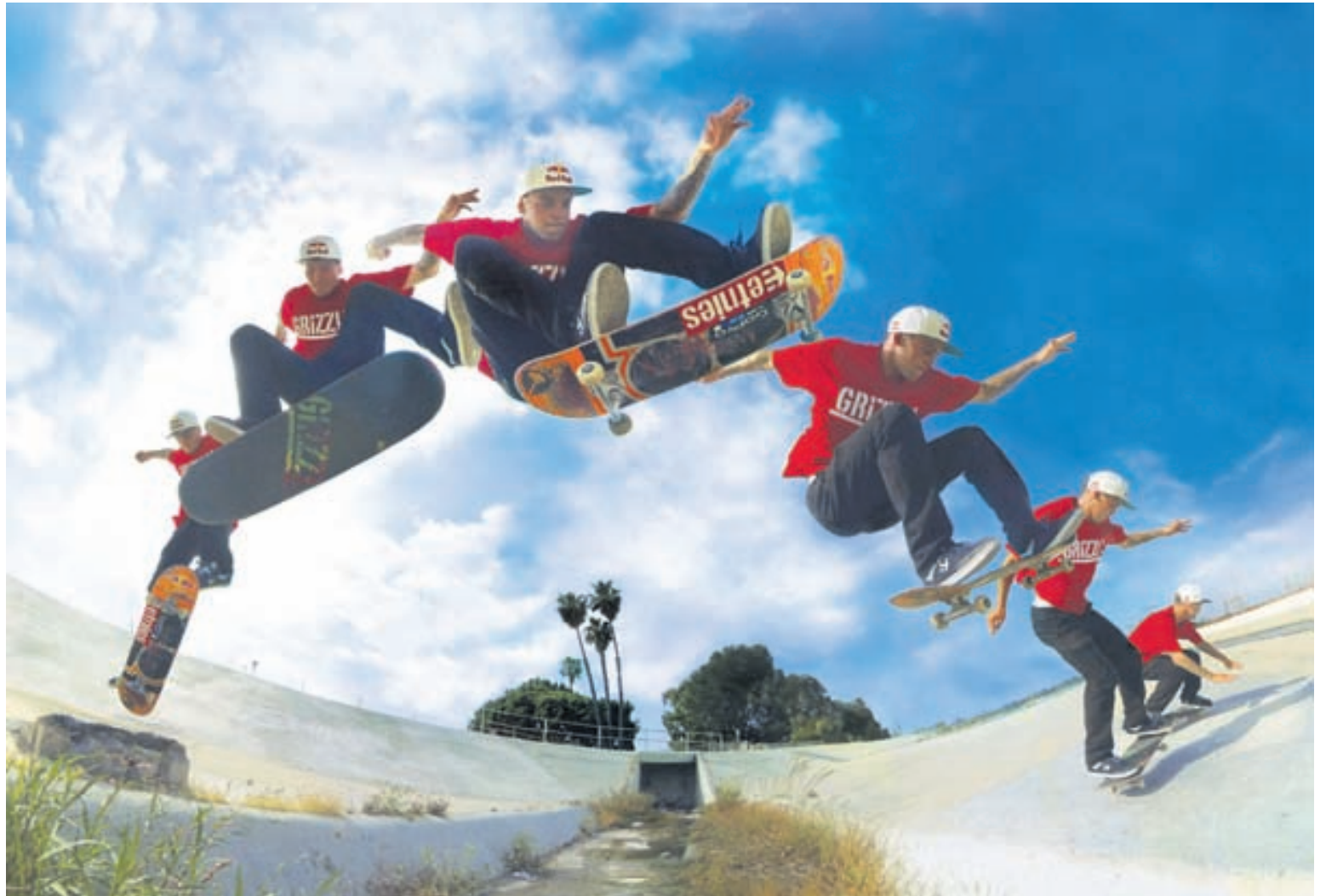
Notkunarmöguleikar GoPro-vélarinnar eru ótrúlega fjölbreyttir.

Sem fyrr segir eru margar gerðir í boði í ólíkum verðflokkum. „Unglingarnar nota mest HERO3 White Edition-vélina sem býður Full HD-upptöku og allt að 60 römmum á sekúndu. Þeir sem vilja meiri myndgæði en þó ekki of dýra vél, velja gjarnan HERO3+ Silver Edition-útgáfuna en með þeirri vél er hægt að taka upp í Full HD í 60 til 120 römmum á sekúndu og 10 MP-ljósmyndir. Að lokum má nefna HERO 3+ Black Edition-vélina fyrir þá sem kjósa mun meiri gæði. Sú vél er notuð á nær flestum sjónvarpsstöðvum í heiminum í dag þar sem krafast