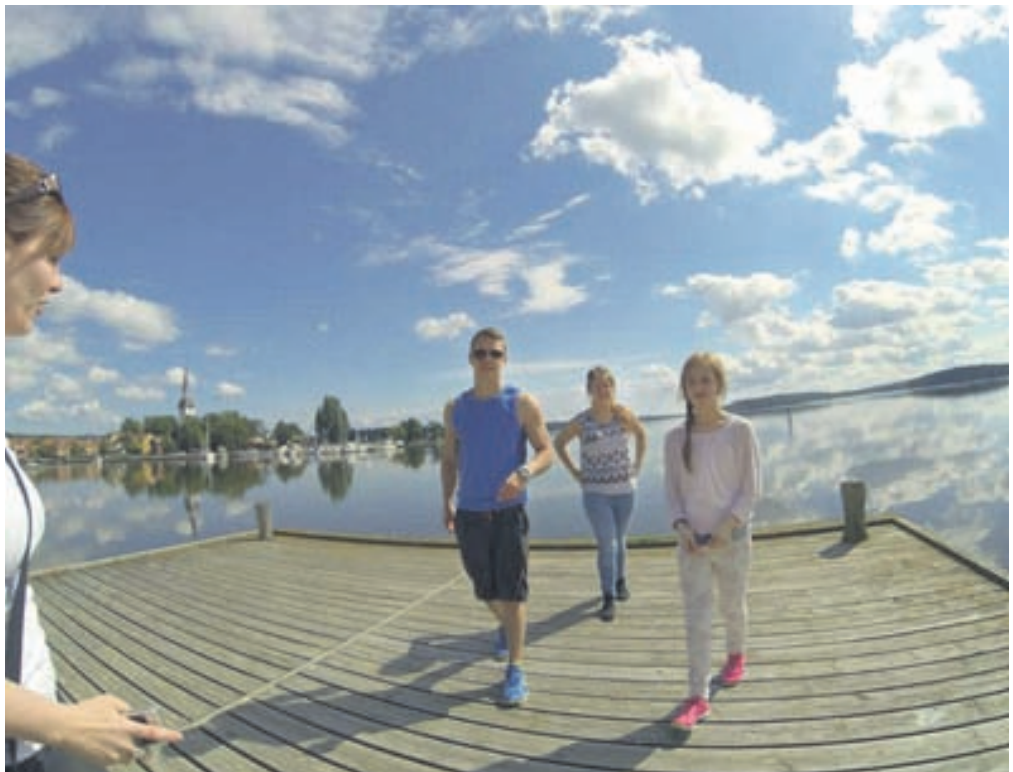
Fjölskyldan hefur notað hasarmyndavélina mikið á ferðalögum undanfarið ár. Hér eru þrjú barna þeirra á ferðalagi í Svíþjóð.

Undanfarið ár hefur fjölskyldan því safnað saman miklu magni ljósmynda og myndbanda. „Það þarf bara að finna reglulegar kvöldstundir og fara í gegnum safnið, búa til möppur og finna myndir og myndbönd við hæfi. Þannig geymum við ómetanlegar minningar sem við getum notið út ævina.“