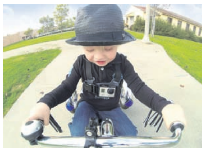
Börn geta auðveldlega notað GoPro við ýmsar aðstæður.

Allar nánari upplýsingar má finna á www.goice.is og á Facebook undir GoPro Iceland og GoPro Ísland.