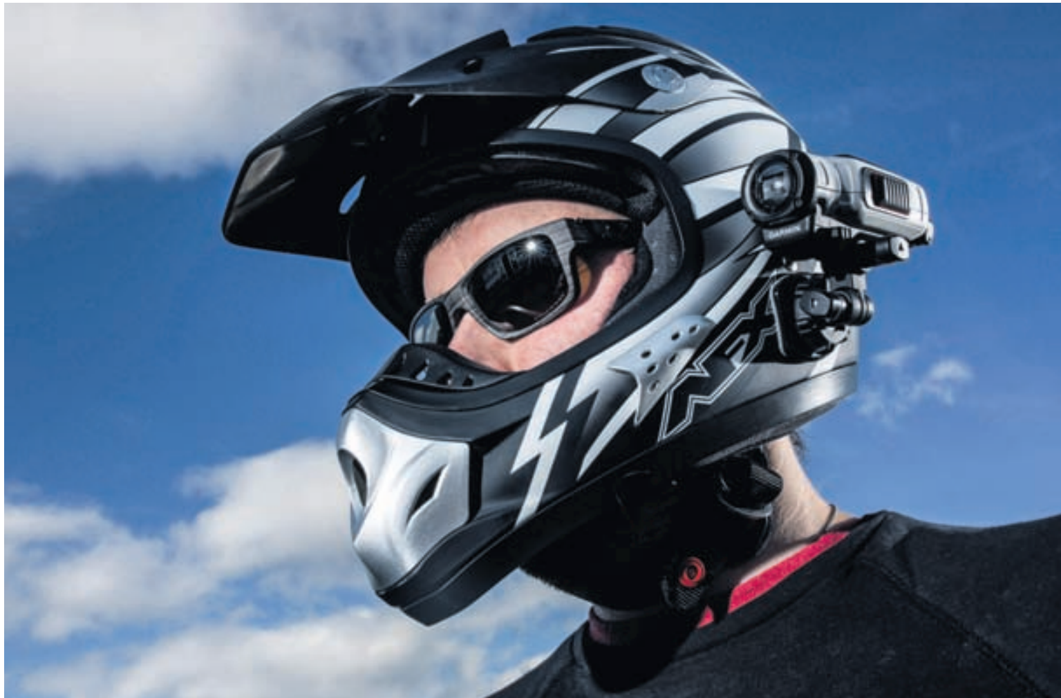
Garmin Virb Elite-smámyndavélin hentar öllum sport- og útivistartegundum.