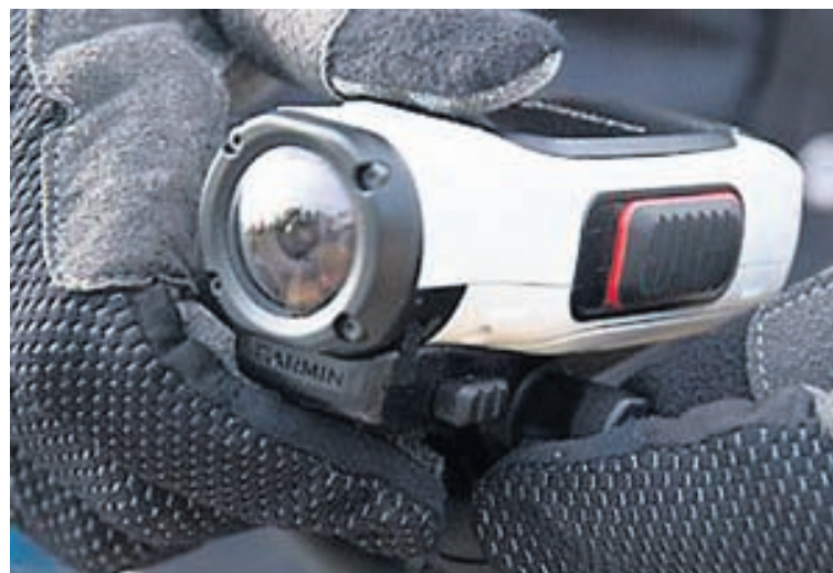
Garmin Virb Elite, fullkomin myndavél búin mikilli tækni.

Garmin Virb-myndavélar og allir fylgihlutir og festingar fást í Garminbúðinni í Ögurhvarfi 2 í Kópavogi (S: 577-6000), hjá Elko og sölustöðum víða um land. Sjá má frekari upplýsingar á heimasíðunni www.garmin.is