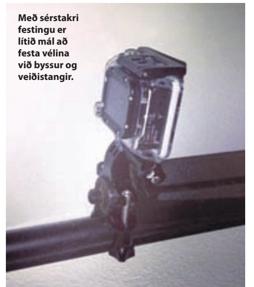
Með sérstakri festingu er lítið mál að festa vélinu við byssur og veiðistangir.