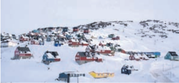
Einungis 5.000 manns búa á austurströnd landsins.