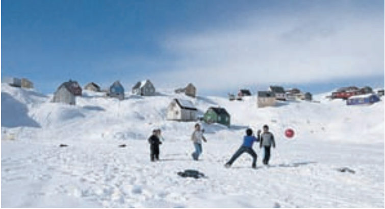
Börn í boltaleik í bænum Tasiilaq á austurströnd landsins.

Áfangastaðurinn Grænland, Orgelsmiðja á Stokkseyri, kínverskur skemmtigarður og Hlíðarfjall.