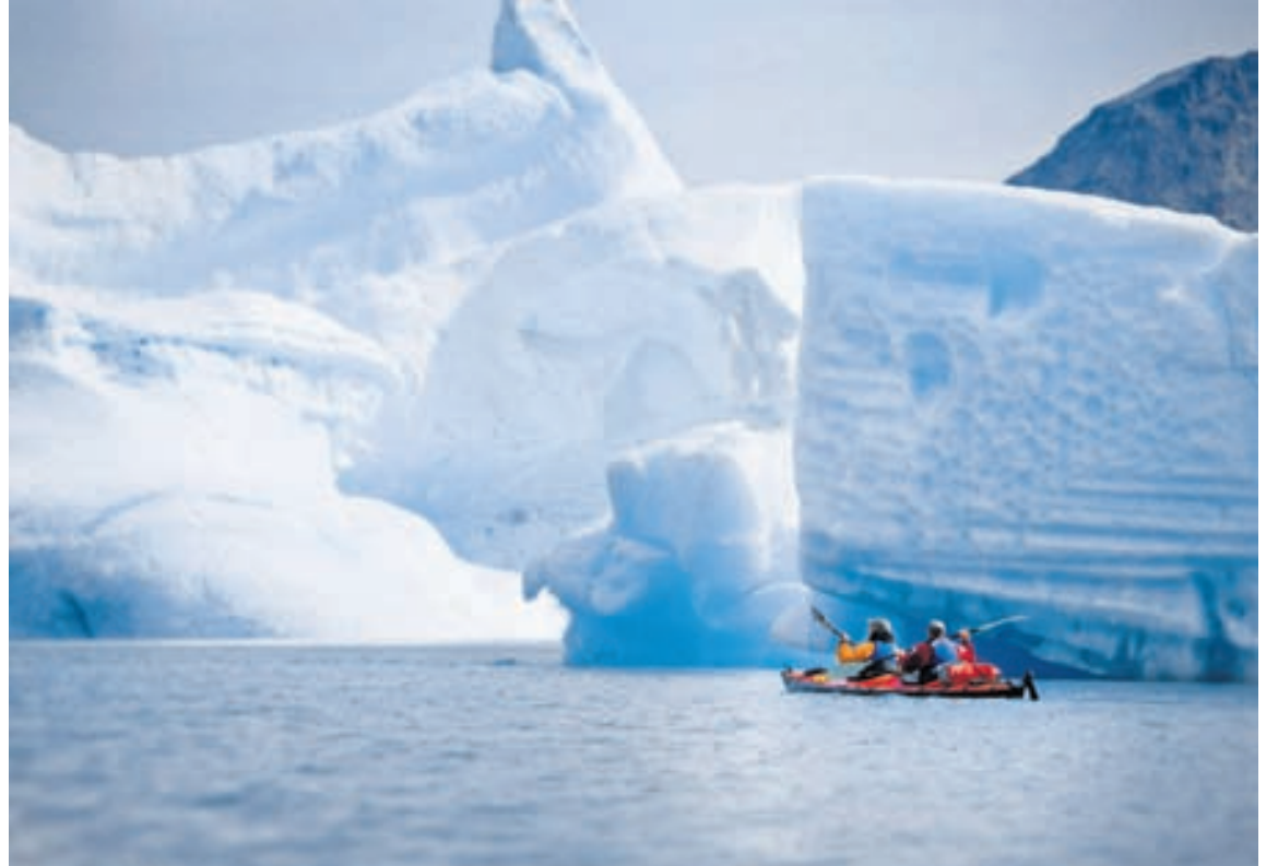
Það er einstök upplifun að róa um á kajak og skoða risastóra ísjaka.