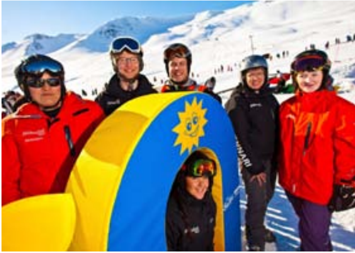
Skíðakennarar skíðaskólans taka vel á móti krökkum.