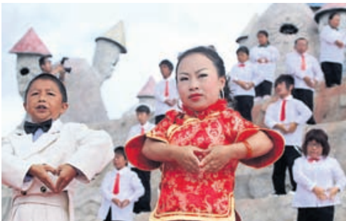
Starfsmenn garðsins syngja og dansa fyrir gesti.

Allar nánari upplýsingar um aðstöðuna í Hlíðarfjalli og opnunartímann má finna á www.hlidarfjall.is og á Facebook.