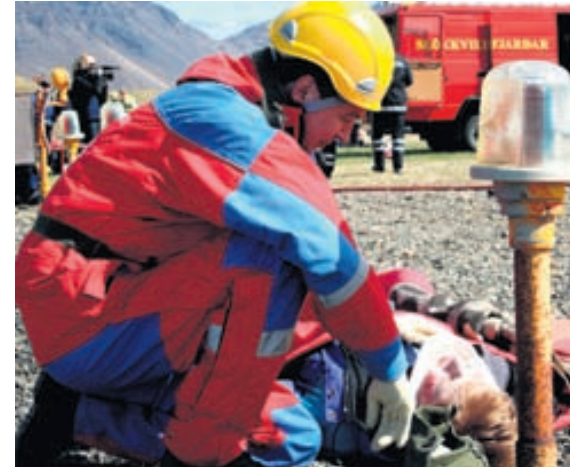
Sjúkratryggingar Íslands greiða bætur vegna slysa og eru því mikilvægur hluti af íslenska heilbrigðiskerfinu.

Atvinnurekandi skal senda inn tilkynningu þegar um vinnuslys er að ræða. Skilyrði er að viðkomandi hafi