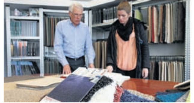
Hægt er að fá mottur sniðnar eftir máli en gott úrval af gólfteppum er að finna í versluninni Stepp.