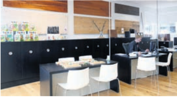
Hægt er að fá tilboð í gólfefni og lagningu þeirra á stigaganga húsfélaga.