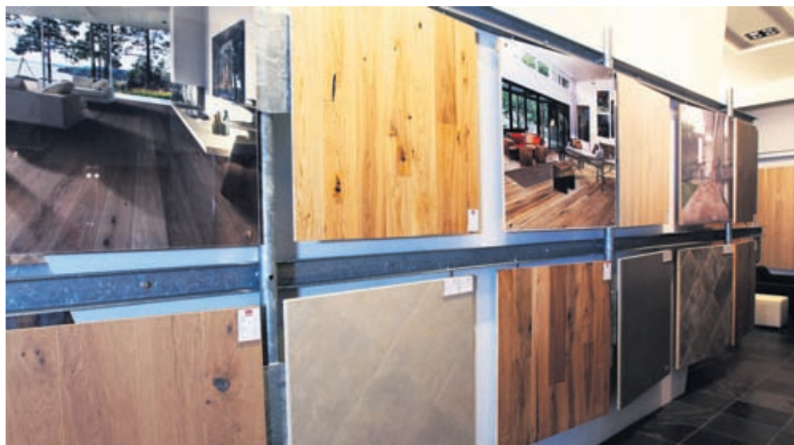
Hvítleit eik er vinsæl núna.