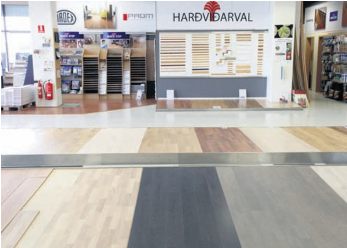
Harðviðarval er með stærsta parketsýningarsal landsins að Krókhálsi 4, þar geta viðskiptavinir séð sýnishorn af öllum þeim vörum sem bjóðast.