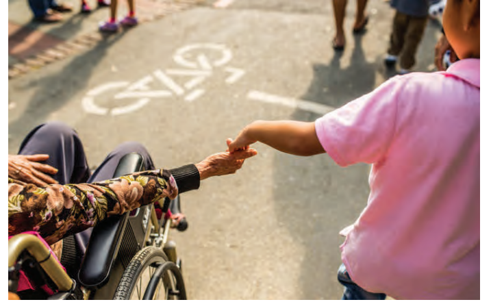
Á heimasíðu Þekkingarmiðstöðvarinnar er að finna mikinn fróðleik.

og upplýsa aðra, en ekki síður að gefa einstaklingum færi á að deila sinni persónulegu reynslu og gefa góð ráð um ýmis málefni sem snerta alla á einhvern hátt. Á heimasíðunni má nú sjá áhugaverða og fjölbreytta fyrirlestra um útvist og íþróttir, þátttöku í lífinu, fótluarlist og sköpun, Frumbjörgu – Frumkvöðlamiðstöð Sjálfsbjargar, mikilvægi NPA, sýnileika á vinnumarkaði, fótlu og for-eldrahlutverkið, að byggja upp nýja sjálfsmynd eftir slys og viðhorf til lífsins – taktu sjensinn.