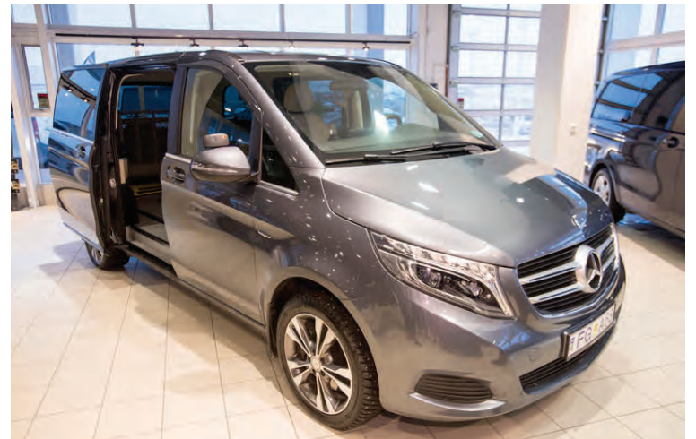
Mercedes-Benz V-Class hentar vel til breytinga fyrir hreyfihlaða.