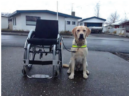
Smá hvíld hjá Ísari hjálparhundi.