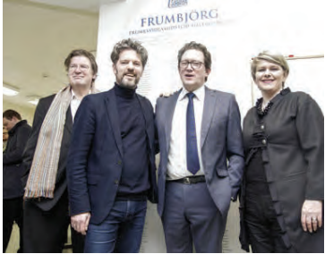
Frá opnun Frumbjargar þann 29. febrúar 2016.