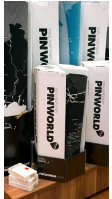
Það er gaman að skipuleggja draumaferðalög framtíðarinnar með því að stinga pinna í lönd.