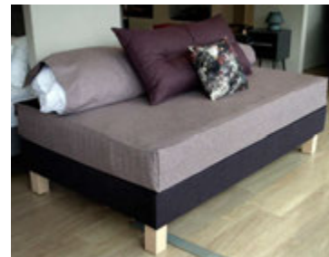
Rúmi breytt í sófa með rúmteppinu.