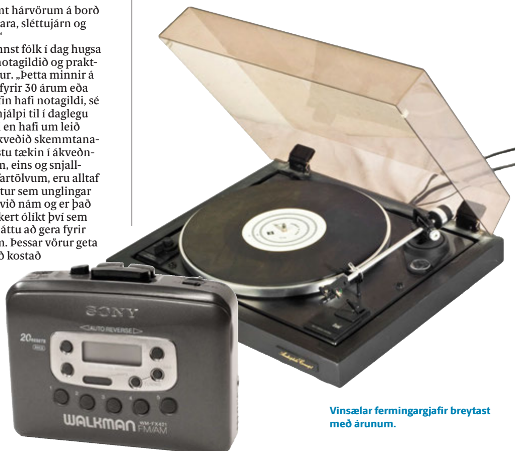
Vinsælar fermingargjafir breytast með árunum.