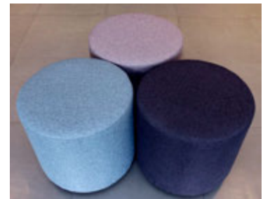
Smart kollar í unglíngaherbergjó.