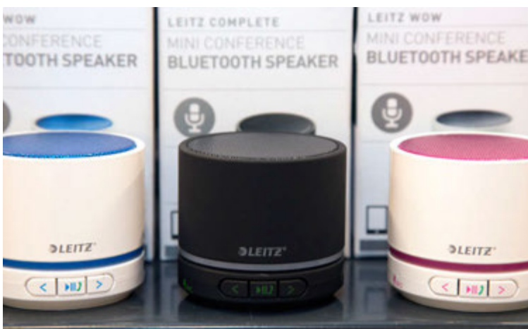
Margur er knár þótt hann sé smár á vel við hátalarana frá Leitz. Þeir eru fánlegir í fimm litum og hægt að taka með sér hvert sem er.