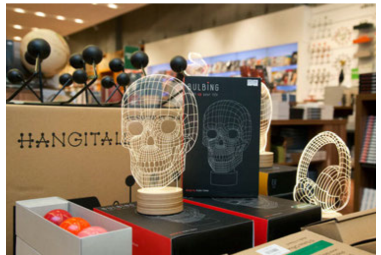
Prívíddarljósin taka sig vel út í unglíngaherberginu. Splunkuný vara sem vekur athygli viðskiptavina.