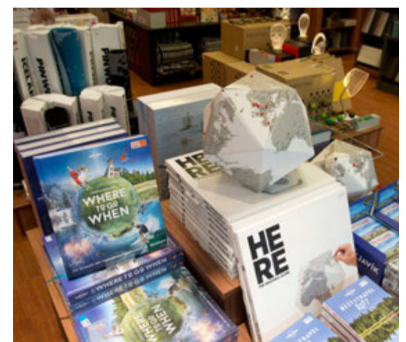
Kantarir pappahnettir og „Pin the World“ veggteppi frá Palomar hafa slegið í gegn.