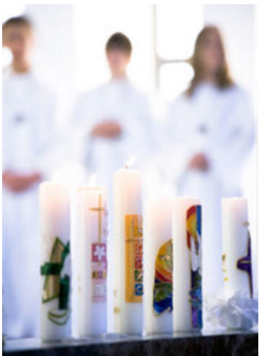
Fyrr á tíð var skylda að fermast.