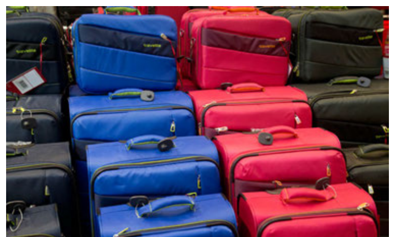
Ferðatöskur í fallegum litum eru tilvalin og notadrjúg gjöf.