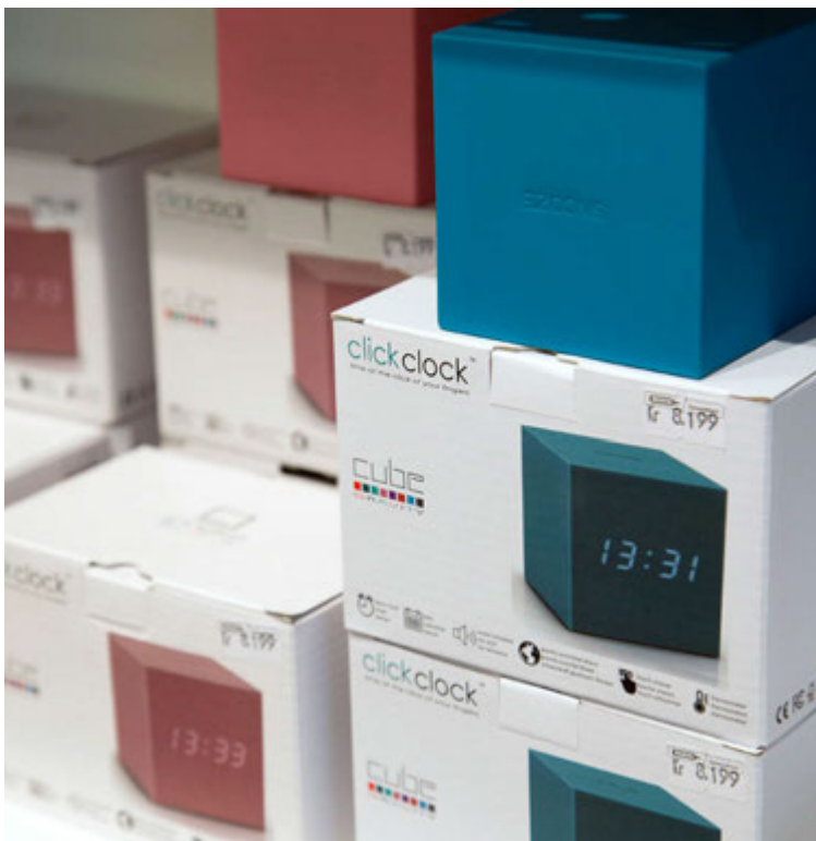
Cube Click Clock kubbaklukkurnar eru stílhreinar og smart. Digitaltölur sýna tíma, dagsetningu og hitastig herbergis.