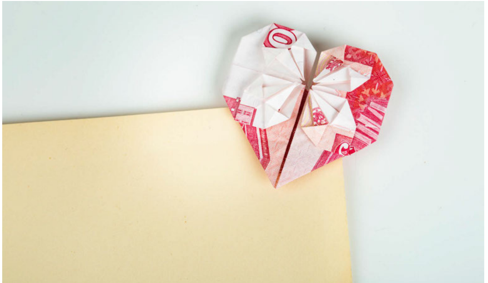
Hjartað er með flipa að aftan en þannig er hægt að festa það utan á kort.