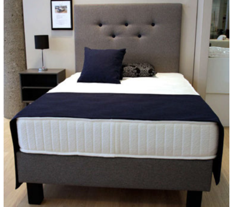
Starlux heilsudýnan er vinsælust.