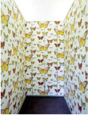
Fiðrildin svífa um alla veggj í ár.