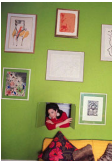
Litur ársins er skærgrænn og hann passar að sjálfsgöðu vel í stofuna.