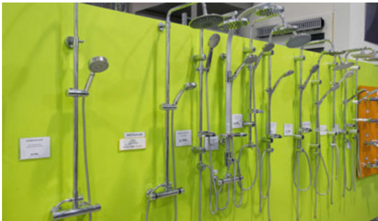
Í Múrbúðinni er að finna mikið úrval af hreinlætistækjum.

Fyrir allt þetta borgaði eigandi baðherbergisins 315 þúsund krónur. „Hann fékk síðan iðnadamann til að hjálpa sér en það eru mjög margir sem gera þetta sjálfir. Sumir nota bara YouTube til að leiðbeina sér,“ segir hún glettin. „Aðrir fá pípara en gera annað sjálfir.“