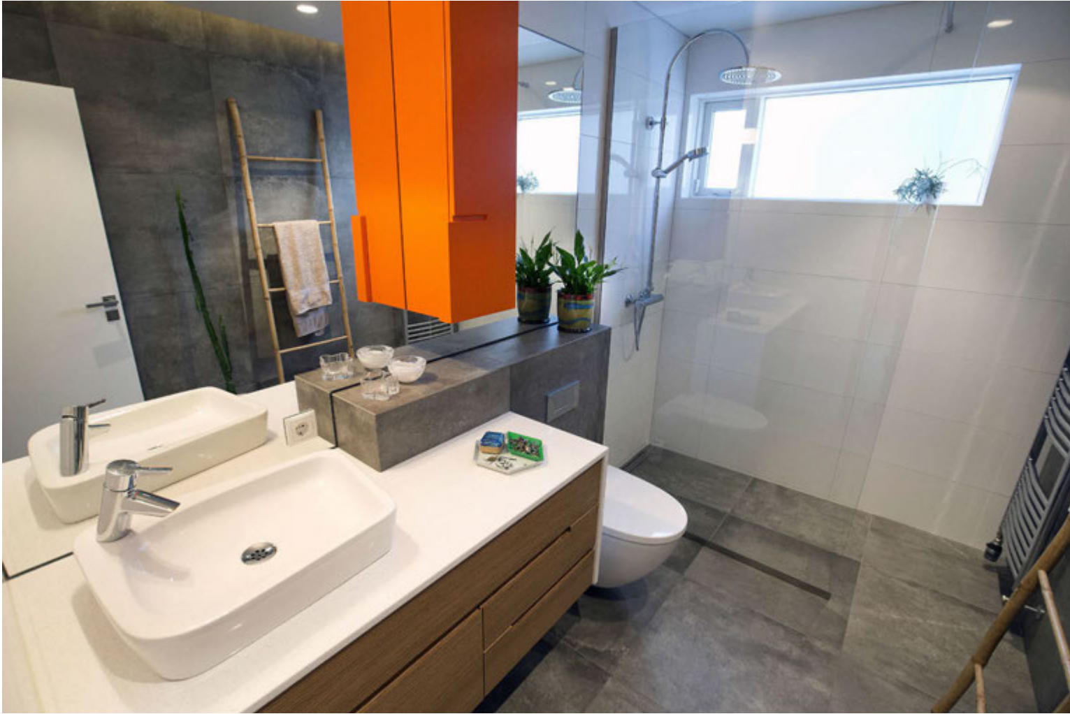
Baðherbergið er fallegt og nokkuð mínimalískt en poppað upp með appelsínugulum skáp.