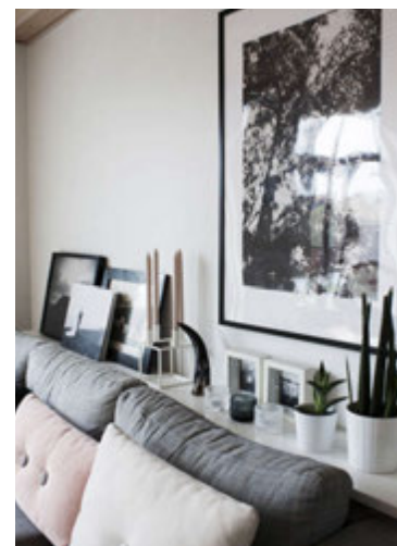
Hafdís hefur gott auga fyrir fallegum hlutum.