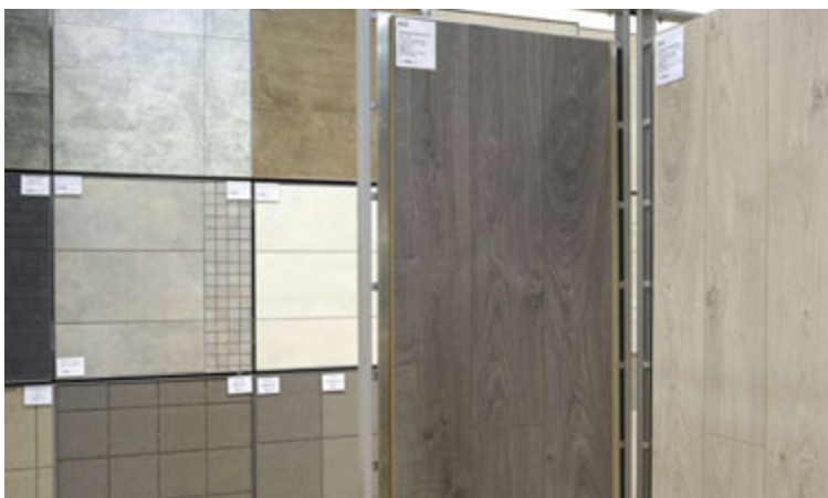
Flísar og parket má einnig finna í Múrbúðinni.