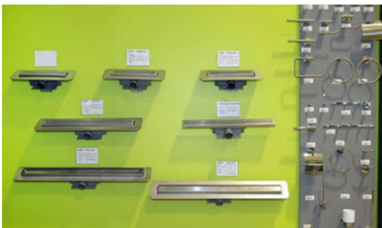
Alla aukahluti á baðherbergið má fá í Múrbúðinni.