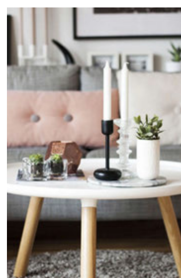
Heimili Hafdísar er stílhreint og setja fallegir smáhluti sinn svip á það.