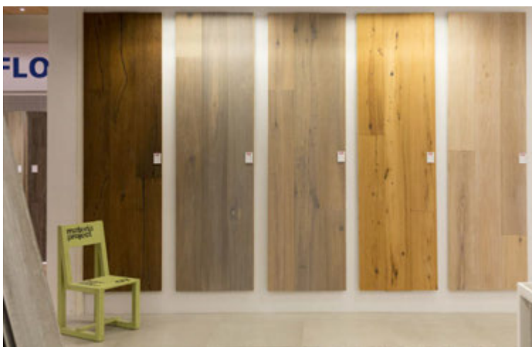
Hér má sjá sýnishorn af harðparketgólffefnum í gráum tónum sem eru vinsæl þessa dagana.

andi. „60x60 cm eru algengastar en svo eru til stærri flísar allt upp í 120x240 cm. Svo er verið að brjóta upp veggina með mynstruðum flísum eða í sterkari litum, það er allur gangur á því.“