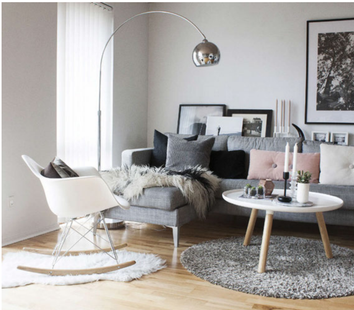
Stofan er björt og stílhrein.

Ertu hrifin af einhverjum ákveðnum hönnuðum? Ég spái ekki svo mikið í hönnuði, ég er von að kaupa mér bara það sem mér finnst fallett algjörlega óháð merki og hönnun. En ég er samt afskaplega hrifin af dönsku merkjunum HAY og Royal Copenhagen.