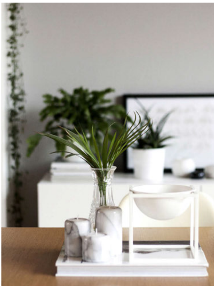
Hafdís er von að kaupa sér bara það sem henni finnst fallett, óháð merki og hönnun.