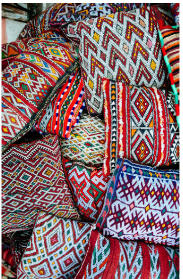
Ólík og margbreytileg mynstur leggjast á eitt við að skapa stemminguna.

Listasmið frekar en heimaöndur. Nú eru fallegir hönnunargripir búnir að ná yfirhöndinni og krúttlegir heimagerðir blómakransar eru á undanhaldi.