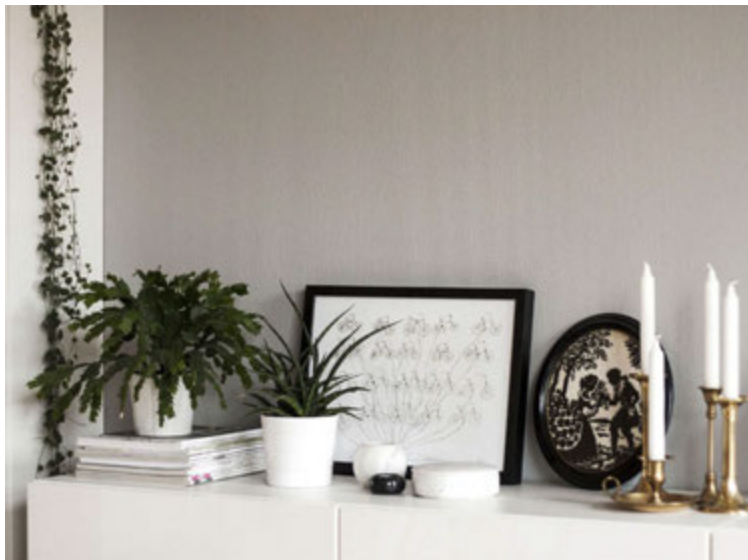
Hafdís skreytir mikið með grænum plöntum, gærum, persónulegum myndum og gömlum hlutum sem hún finnur á nytjamörkuðum.