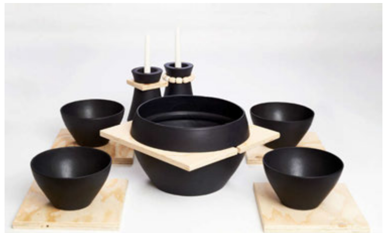
Nýja línun heitir UM og verður til sýnis á næsta HönnunarMars. Hún byggir á samspili tveggja efna, leirs og víðar, og inniheldur kertastjakann KringUM og skálasettið UtanUM.

Hún segir kveikjuna að nýju línunni vera þetta mikla skammdegi sem stundum nær alveg yfirhöndinni og þann yl og birtu sem