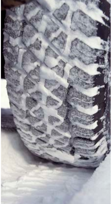
Samgöngustofa mælir eindregið með því að setja vönduð vetrardekk undir bíla.