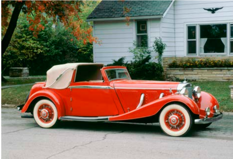
Dekk voru lengi vel hvít á litinn en svarti liturinn kom fram í kringum 1917.

gerði þau enn þá endingabetri en sinkoxíðið.