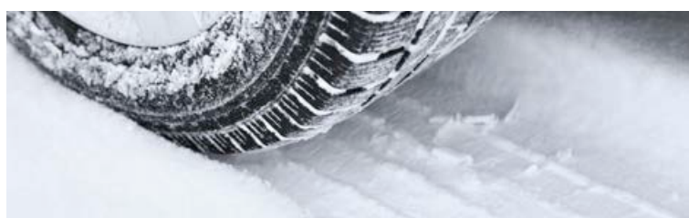
Mynstrið á vetrardekkjunum bitur sig fast í snjó, ís og slyddu, dreifir vatni hraðar og tryggir betra grip á vegum og betri stjórn.

betri stjórn. Aukin dýpt hjálpar mynstrinu að grípa í snjó, sem gefur betra grip á þökkuðum snjó. Vetrardekk sem hafa staðist veggripspróf hafa rétt á að vera merkt með þriggja tinda fjalli með snjó-korni.