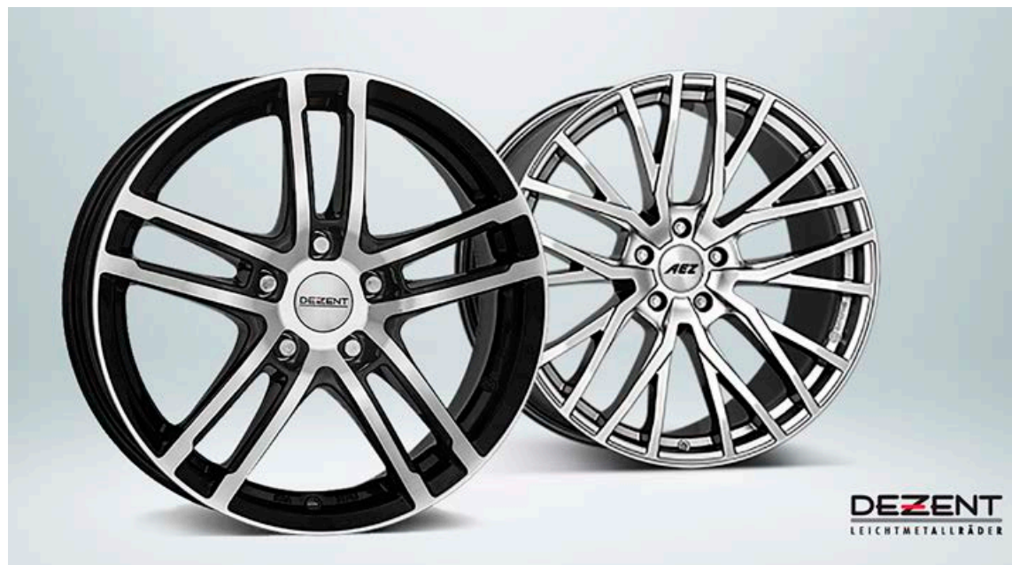
N1 hefur átt í áratuga samstarfi við Alcar sem er austurrískur felguframleiðandi í fremstu röð í Evrópu.

N1 hefur átt í áratuga samstarfi við Alcar sem er austurrískur felguframleiðandi í fremstu röð í Evrópu. Alcar leggur mikið upp úr gæðum og má nefna að felgur frá þeim eru sérvarðar gegn seltu