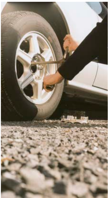
Metið var innan við ein mínúta.