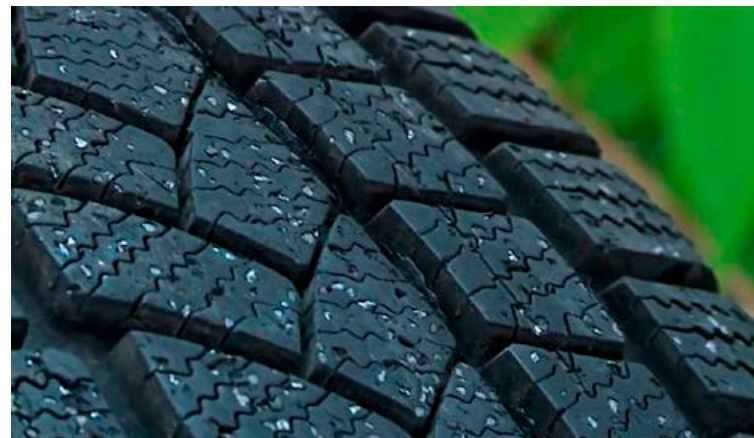
Iðnaðardemanturinn í Green Diamond dekkinu er vel sjáanlegur nær í gegnum allt slitlag dekkisins, sem þýðir að virknin varir allan líftíma dekkisins

Ég leyfi mér bara að orða það þannig að naglar drepa. Læknar segja að allt að 80 Íslendingar deyja ótímabærum dauða árlega vegna svifryksmengunar og mörg hundruð glíma við heilsufarsvandamál. Það má rekja allt að 25% af uppsprettu svifryks til nagladekkja,“