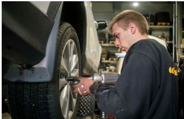
Vönduð, traust vinnubrögð eru í hávegum höfð á dekkjaverkstæði Kletts.

„Með því að vera á réttum dekkjum fyrir hvern árstíma; góðum, öruggum vetrardekkjum á veturna og góðum sumardekkjum á sumrin, fæst betri ending á dekkjum og bíllinn eyðir minna, sem, þegar upp er staðið, veldur