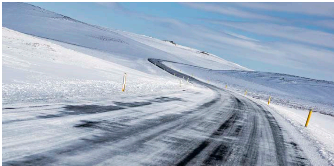
Það er svo sannarlega full þörf á negldum hjólbörðum á þjóðvegum landsins yfir vetrartímenn.

Mynstrið á dekkjunum bitur sig fast í snjó, ís og slyddu, dreifir vatni hraðar til að koma í veg fyrir að bílar fljóti ofan á hjólförum og tryggir betra grip á vegum og