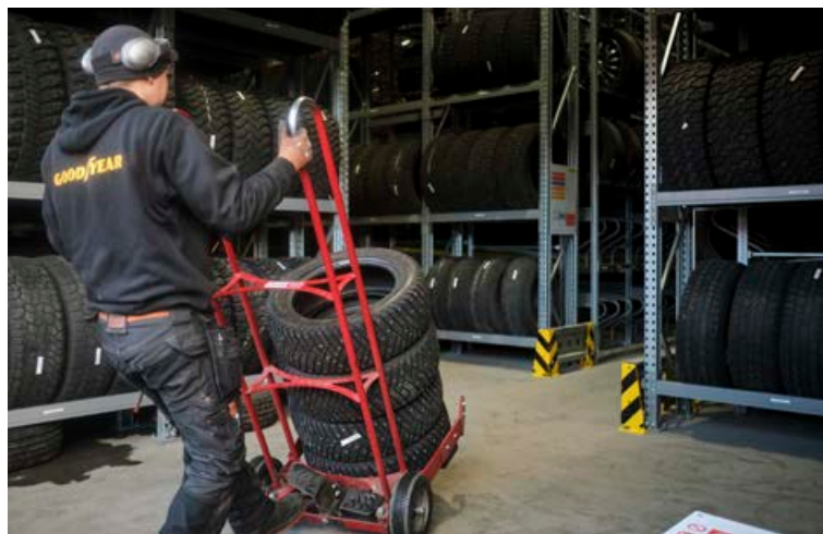
Nýtt dekkjahótel Kletts hefur aukið öryggi og þægindi starfsfólks til muna.