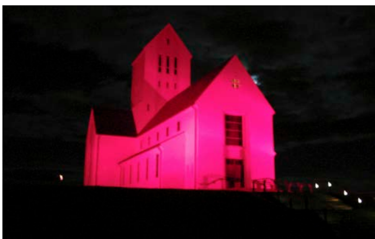
Hér er Flat-eyrarkirkja í bleiku ljósi fyrir nokkrum árum.

Að lýsa upp stytur bæjarins gefur þeim aukid gildi og laðar fram afskaplega fallega stemmingu í kringum þær. Vetrarhátíð í Reykjavík hefur einnig nýtt sér lýsingu á skemmtilegan hátt.