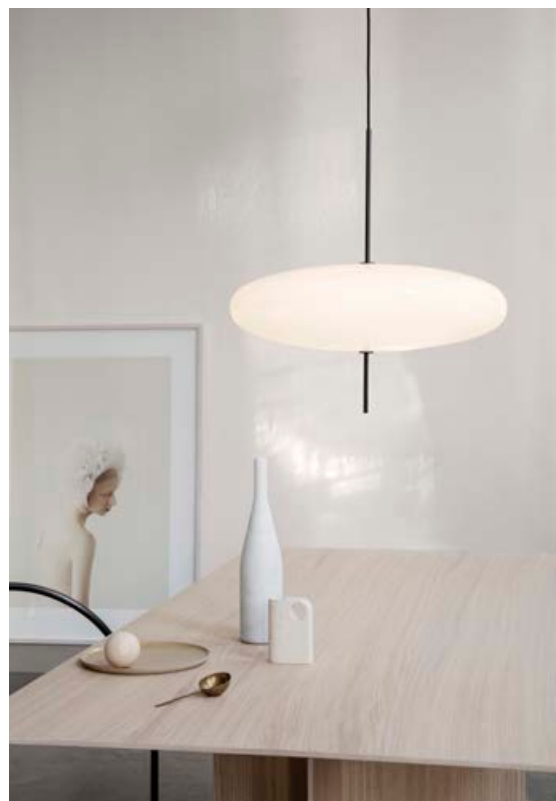
Astep gefur mjúka birtu og glæsilegat útlit á heimilið.

Melt Chrome-ljósín eru hönnuð af Tom Dixon. Þau eru skemmtileg tilraun málmhúðunar þar sem samspil ljóss og skugga fá að njóta sín.