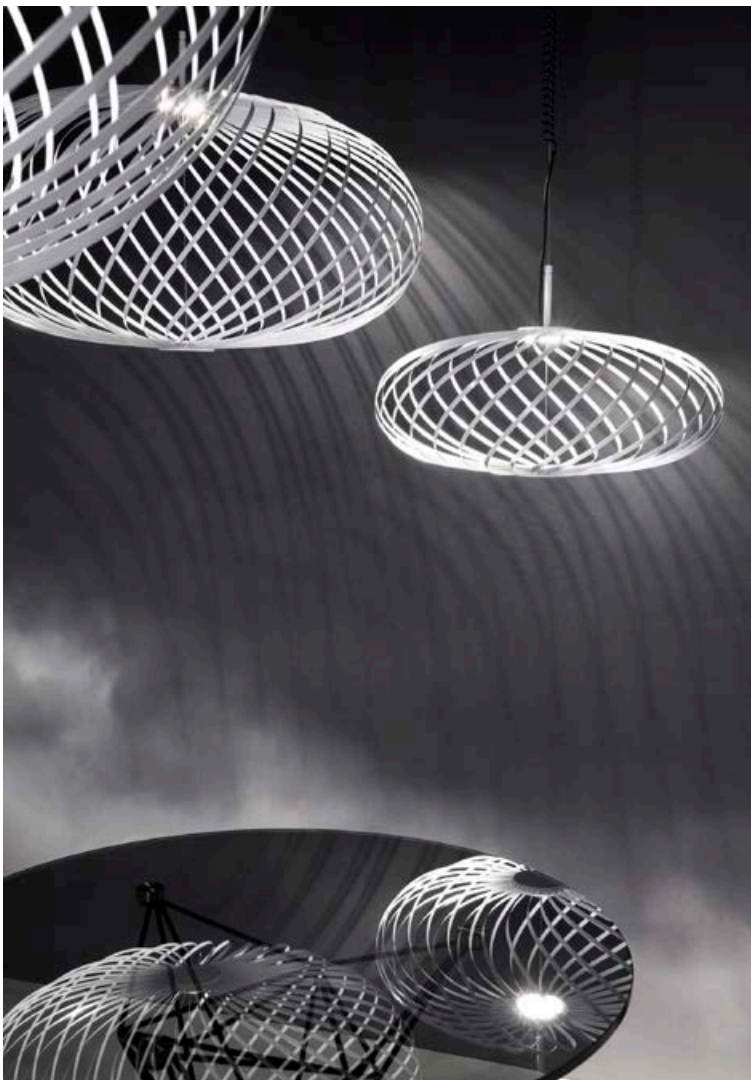
Phylon White er stásslétt loftljós sem sendir frá sér munstraða birtu.