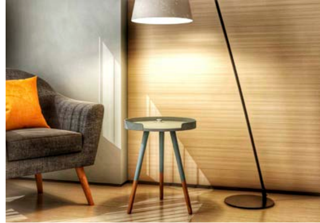
Lýsing hefur mikið að segja.

Það getur verið sniðugt að hafa lampa í einu horninu sem lýsir á þau húsgögn sem eru mesta stofuprýðin. Einnig er hægt að hafa ljós í hillum eða á veggjum með ólíkum birtustillingum til að skapa notalega stemmningu. Ofbjart eða of dimmt herbergi er ekki notalegt og best er að finna milliveg til að lýsingin sé aðlaðandi og skapi hlýju.