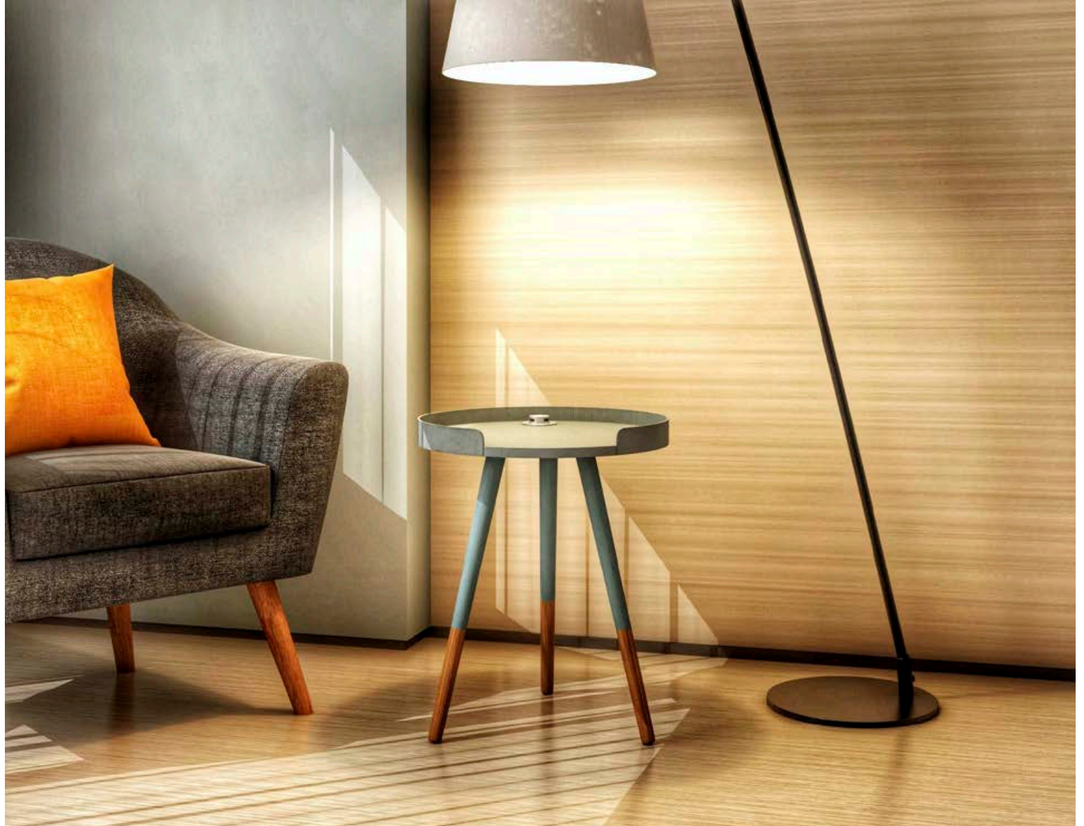
Góð lýsing veitir fólki vellíðan um leið og heimili og húsgögn fá að njóta sín.

Í borðstofunni passar vel að vera með hangandi loftljós yfir borðstofuborðinu. Það er hægt að velja um ótal smart loftljós en hafa þarf í huga að þau lýsi beint niður á borðið. Ljósíð ætti helst að hanga í um 80 cm hæð frá borðinu. Margir nota borðstofuborði fyrir