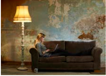
Lýsingarpörf eykst með aldrinum.