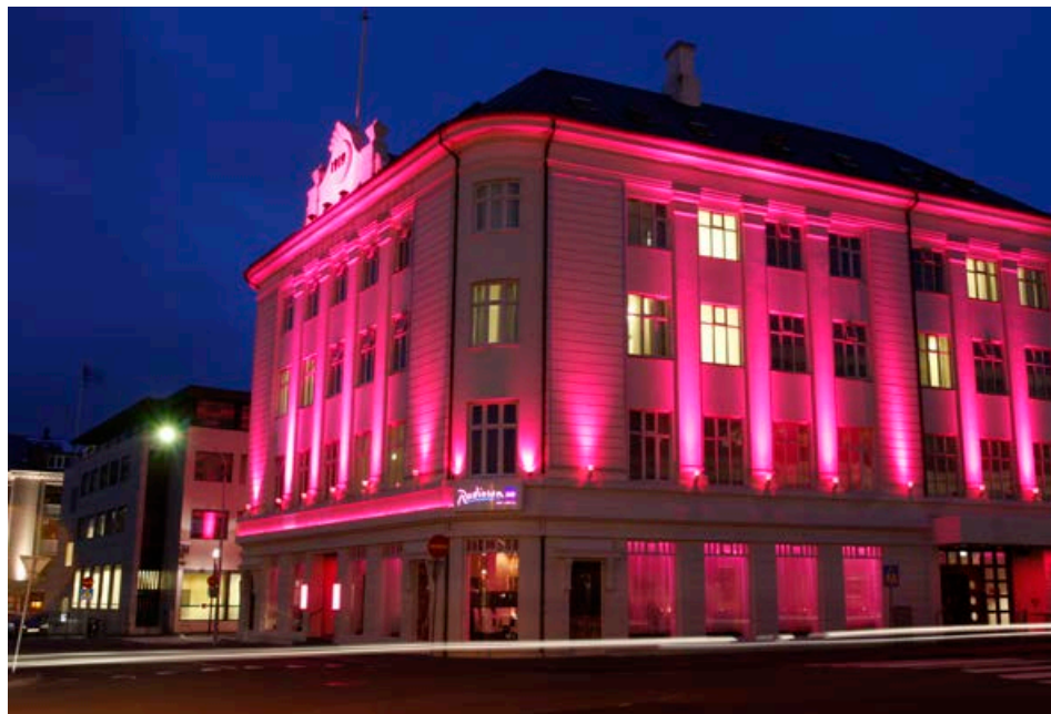
Radisson SAS Hótel 1919 er lýst upp með bleikum lit í október.