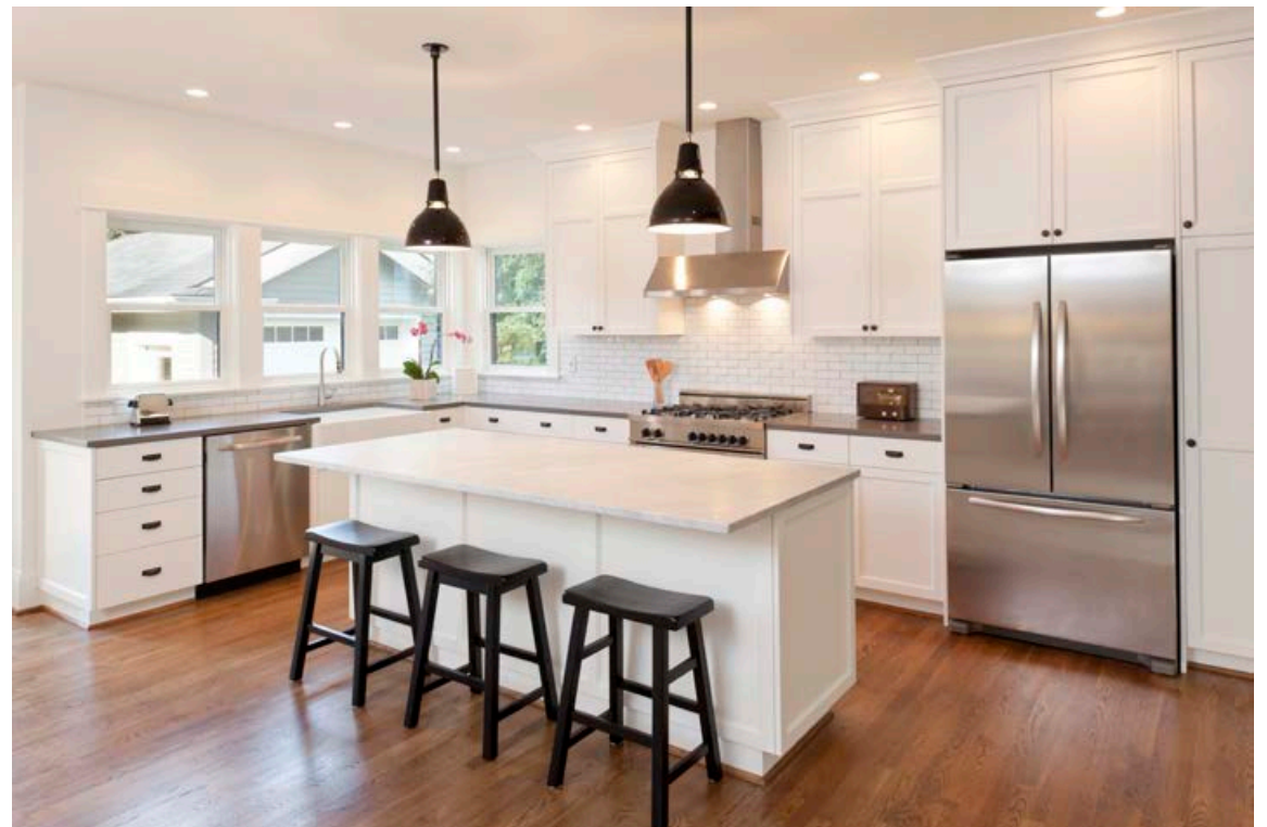
Lýsing í eldhúsi þarf að vera þannig að gott sé að vinna í því.