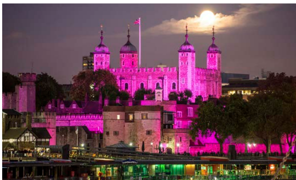
The Tower of London hefur fengið á sig fallegan bleikan lit.