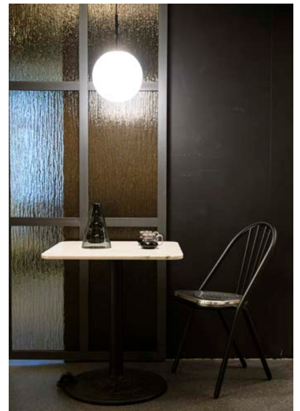
Ljosið Opal frá Slap gefur frá sér fallega lýsingu.

„ Á afmælisárinu höldum við ótraud áfram að gera það sem okkur þykir skemmtilegast; að skapa flotta lýsingu þar sem hægt er að lýsa upp rýmin á heillandi hátt.