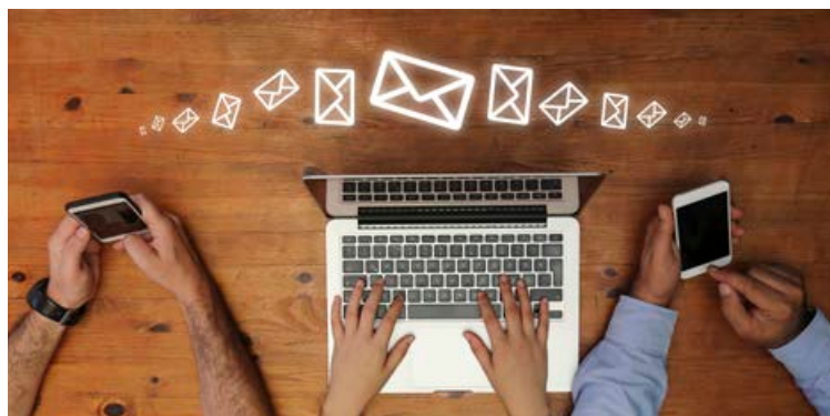
Æ fleiri skoða tölvupóst, fréttabréf, samfélagsmiðla og blogg í snjallsímum og það þarf að skrifa texta með þessa notendur í huga.

láta aðalflugmyndirnar koma strax fram svo að lesandinn þurfi ekki að skruna niður í gegnum póstin til að átta sig á um hvað hann snýst. Svo geta smáatriðin fylgt í kjölfarið. Þannig getur viðtakandinn tekið ákvörðun hratt og auðveldlega um hvort hann vilji bregðast við póstinum strax eða láta það bíða betri tíma.