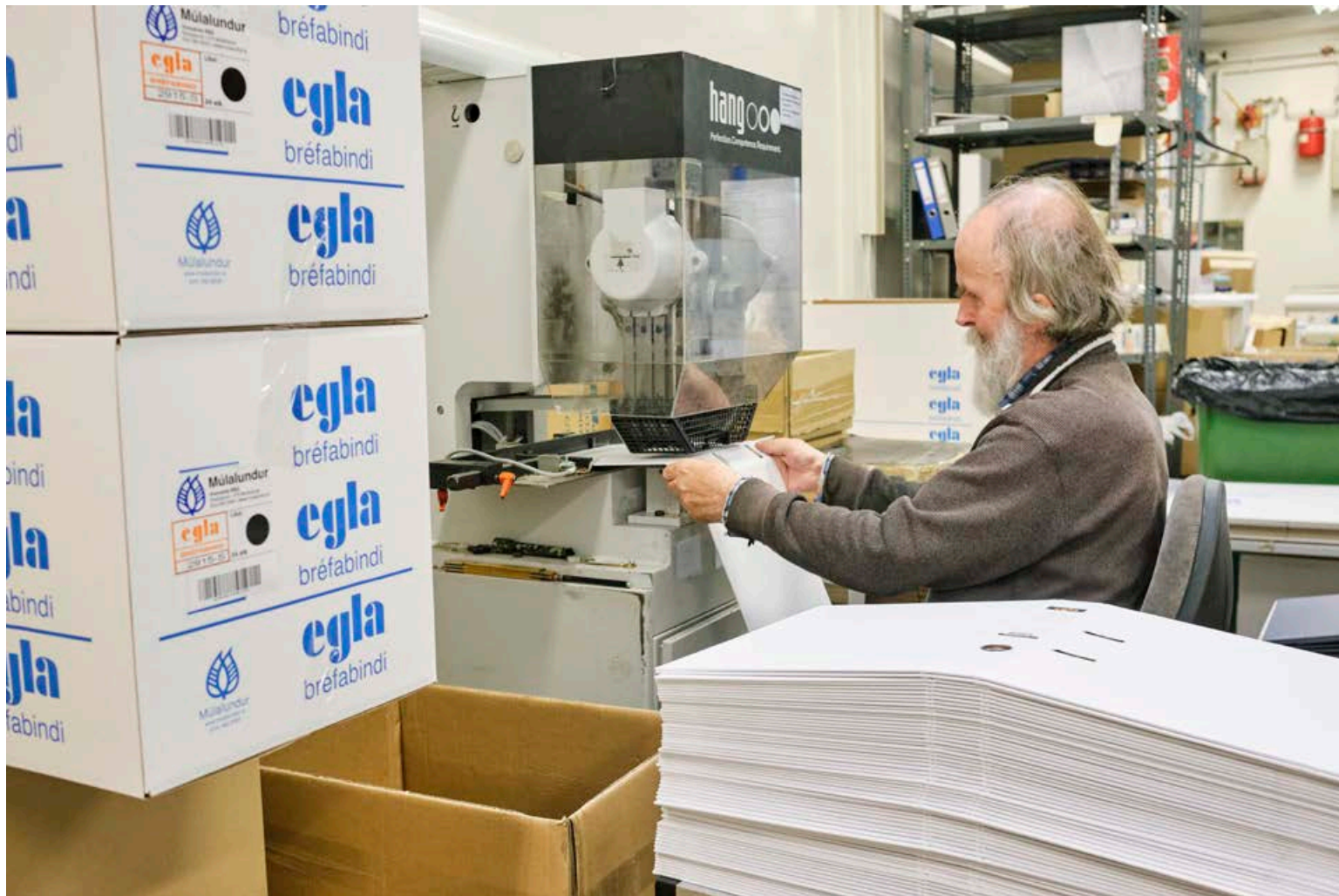
Nýju Egla-möppurnar eru úr pappa og pappír og því plastlausar

Múlalundur býður einnig upp á að lettra fyrirtækjamerki og upp-