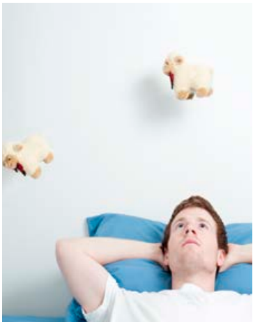
Endurskoðandi telur kindur.

Ef aukið svigrúm skapast má nýta það til að greiða inn á lán, greiða niður skammtímaskuldir eða leggja inn á sparnaðar-reikning. Með því að ráðstafa umfram fjármunum með þessum hætti erum við betur búin undir óvæntar aðstæður.