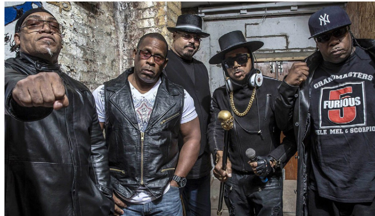
The Sugarhill Gang með Grandmaster Melle Mel og Scorpio úr Furious 5.

Sugarhill Gang kemur fram á Secret Solstice með godsögnunum Grandmaster Melle Mel og Scorpio úr Furious 5 sem myndað hafa sjóðheita súpergrúppu sem vinnur þessa dagana að nýjum lögum og túrar um heiminn, meðal annars til Íslands. Þeir segjast blessaðir að geta enn unnið við það sem þeir elska og með því haldið áfram að skapa hip hop-söguna.