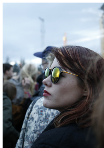
Afhending armbanda inn á hátíðina byrjar á morgun kl. 14

Öllum hátíðarhöldum verður lokið í Laugardalnum klukkan 23.30.