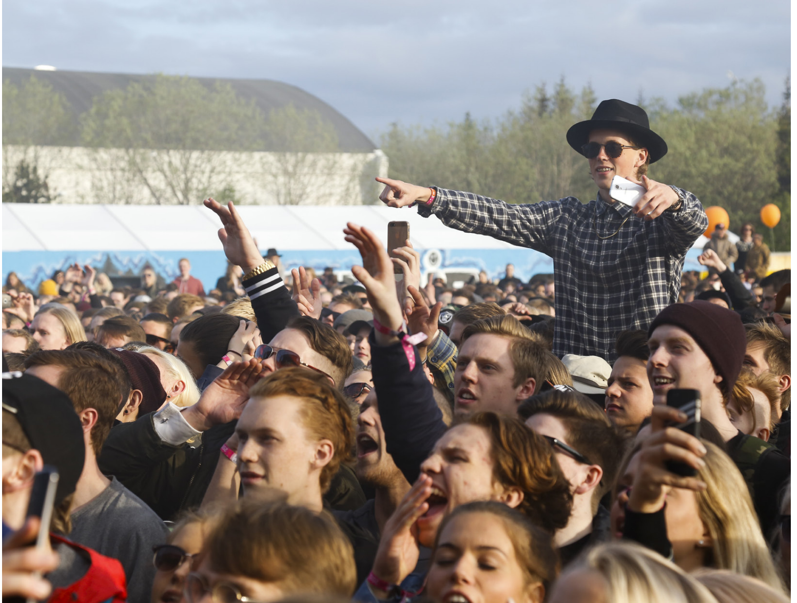
Í fyrsta sinn verður hægt að kaupa sérstaka dagspassa á alla dagana fyrir 10.900 krónur.

Af íslenskum tónlistarmönnum ber helst að nefna hljómsveitina Hatara en Vök, Jói Pét og Króli, Auður, Sólstafir og Vintage Carav-