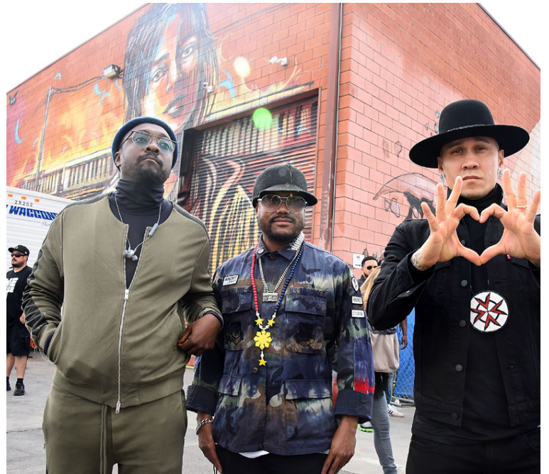
Á blaðamannafundi fyrir Superbowl 2010 sagði will.i.am að hægt væri að rekja sögu hljómsveitarinnar til ársins 1988 þegar hann, og apl.de.ap hittust og byrjuðu að rappa saman um Los Angeles.

Það má segja að með plötunni fari Black Eyed Peas frá danspopp-tónlistarstílnum eins og í lögnum á hinum sívinsælu plötum The E.N.D. og The beginning og aftur til hipphopp-stíls af gamla skólanum sem einkenndi tónlist hljómsveitarinnar í byrjun ferilsins. Platan hefur fengið ágætari viðtökur og