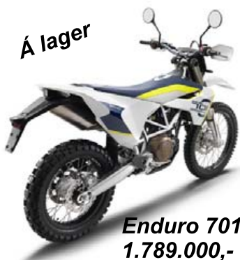
Enduro 701 1.789.000,-