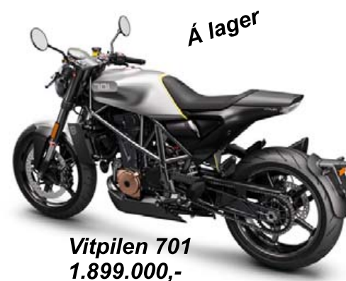
Vitpilen 701 1.899.000,-