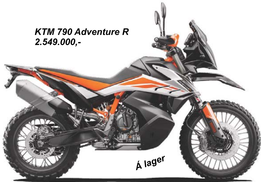
KTM 790 Adventure R 2.549.000,-

KTM eru mest seldu mótorhjólin á Íslandi.