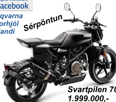
Svartpilen 701 1.999.000,-