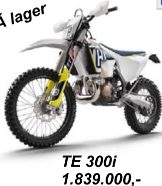
TE 300i 1.839.000,-