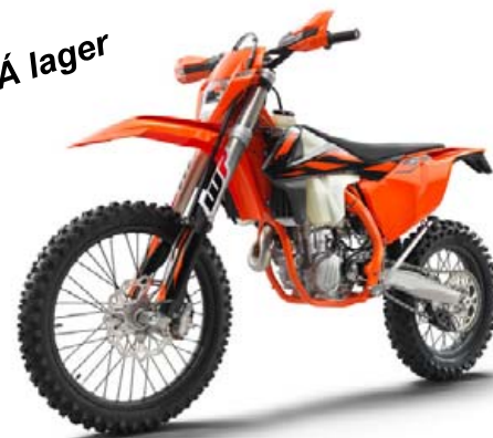
KTM 500 EXC 1.899.000,-