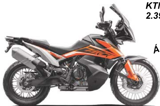
KTM 790 Adventure standard 2.399.000,-

Nýja KTM 790 Adventure hjólið er eitt öflugasta og léttasta Adventure hjólið á markaðnum í dag. Aðeins 189 kg. 799cc 2 cylendra með 6 gíra. ABS bremsukerfi. MTC spólvörn. TFT mælaborð. Eigum hjól á lager til afgreiðslu strax.