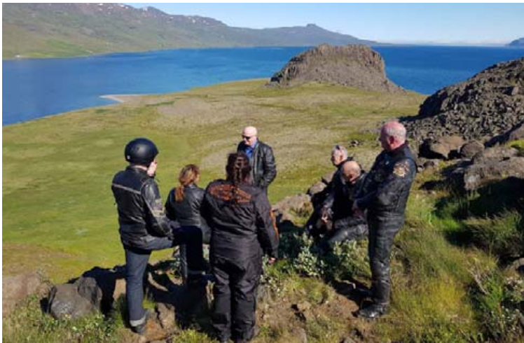
Það er nauðsynlegt að stoppa reglulega og taka létt spjall.

Útsýnið er oft ótrúlega fallegt í hjólaferðum um landið.