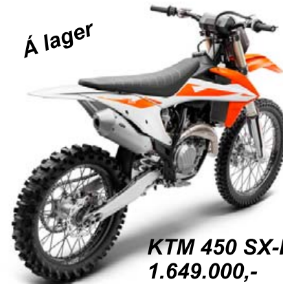
KTM 450 SX-F 1.649.000,-

Gylfaflöt 16-18 - 112 Reykjavík - S: 586-2800