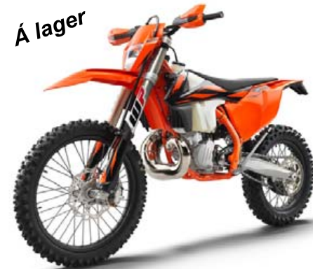
KTM 300 EXC TPI 1.789.000,-

Nýja KTM 790 Adventure hjólið er eitt öflugasta og léttasta Adventure hjólið á markaðnum í dag. Aðeins 189 kg. 799cc 2 cylendra með 6 gíra. ABS bremsukerfi. MTC spólvörn. TFT mælaborð. Eigum hjól á lager til afgreiðslu strax.