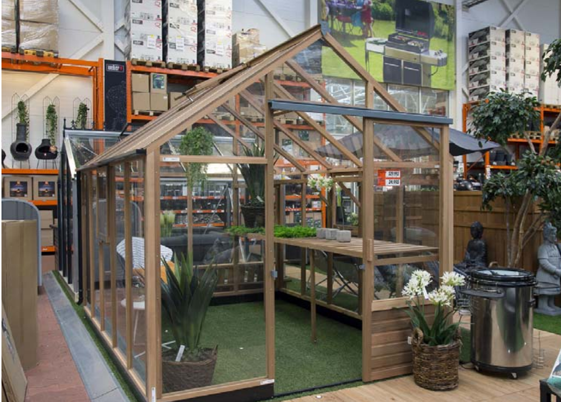
BAUHAUS býður upp á tugi gerða af garðhúsum og smáhúsum, en þar er líka hægt að fá stærri hús og gróðurhús.