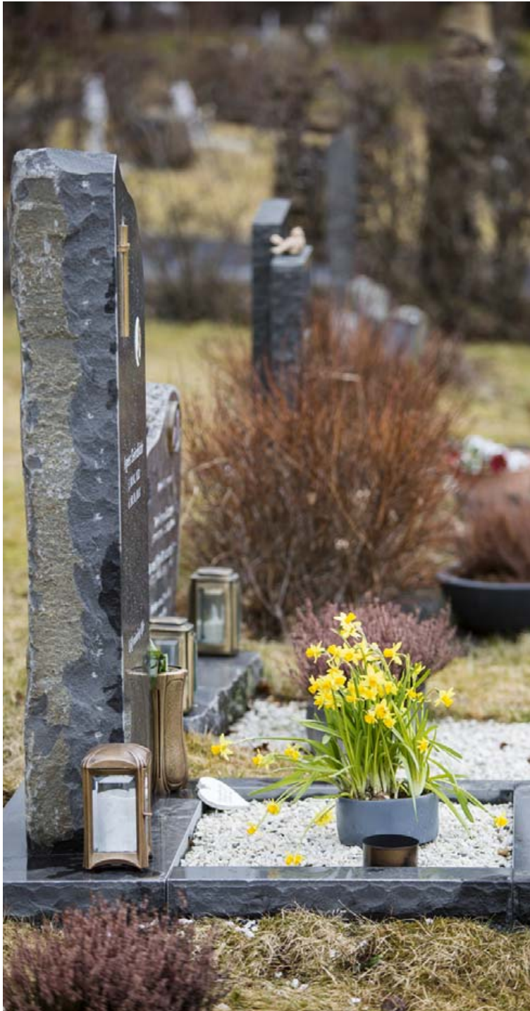
Misjafnt er hversu duglegt fólk er að hugsa um leiði ástvina sinna. Sumir halda öllu hreinu og finu á meðan aðrir koma sjaldnar. Það er fallett að setja páskaliljur eða erikur í potta hjá látnum ástvinum fyrir páskana.