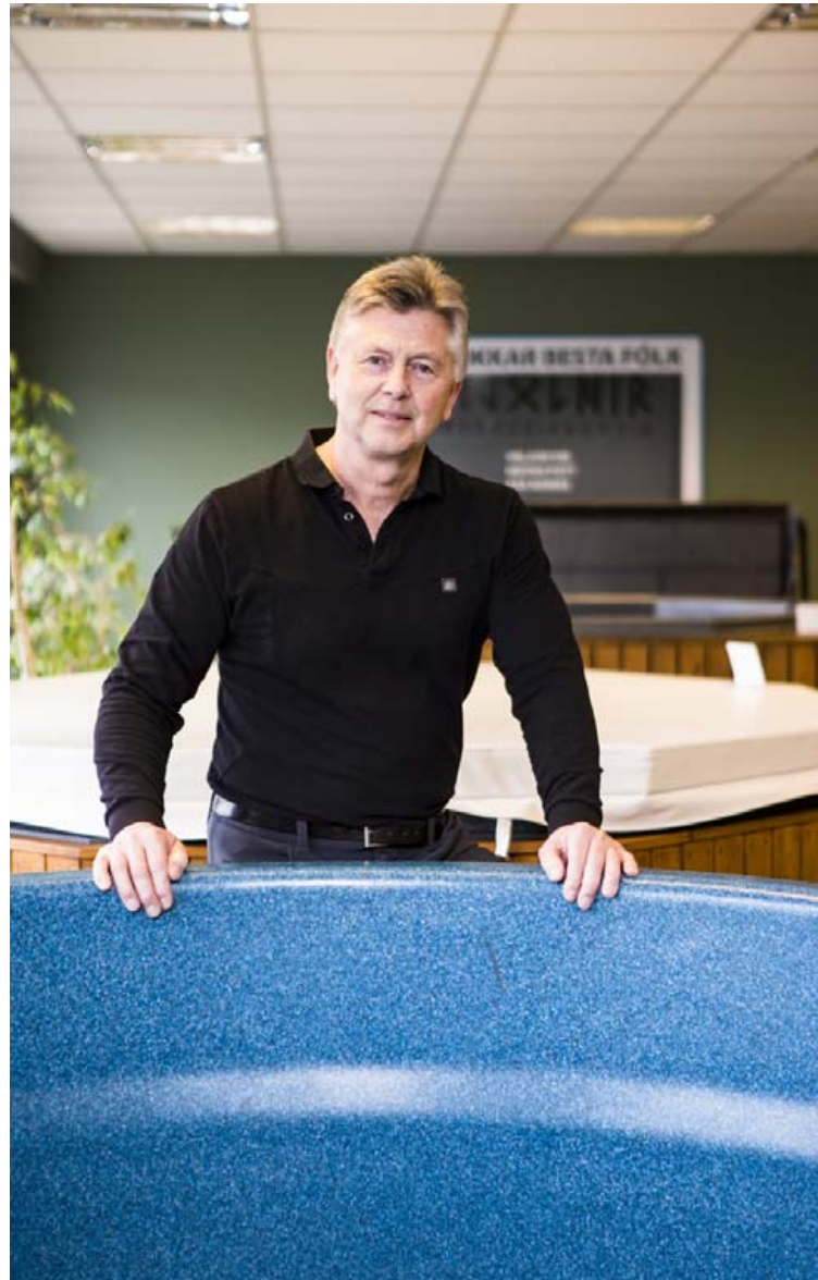
Normx framleiðir pottana, sem eru heilsteyptir og sérhannaðir fyrir íslenskar aðstæður. Engar rassaskálar og því tæmist potturinn algjörlega.