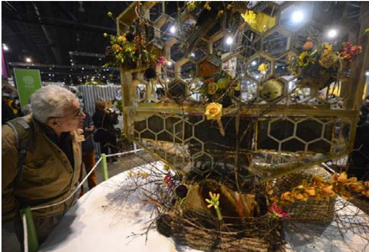
Gestir voru agndofa yfir mörgum listaverkunum á sýningunni.