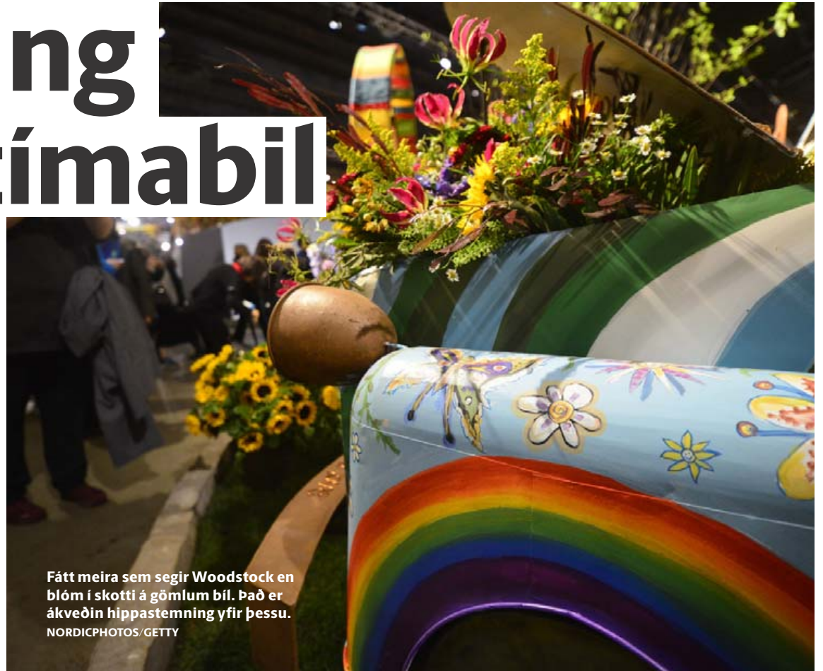
Fátt meira sem segir Woodstock en blóm í skotti á gömlum bíl. Það er ákveðin hippastemming yfir þessu.

Sýningin stendur yfir í níu daga og rúmlega 150 heildsalar setja upp bása og sýna sínar nýjustu afurðir. Fjöldmargir fyrirlestrar eru haldnir og það er sama hvert er lítið – alls staðar blasir litadýrð og fegurð við.