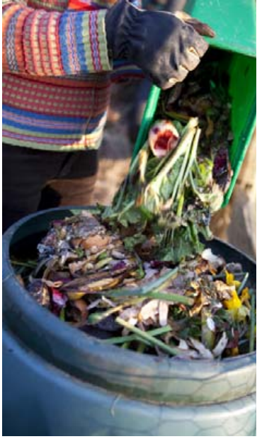
Nota má í jarðgerð meðal annars ávexti og grænmeti, egg og eggjaskurn, brauð, kaffi, te og fleira.