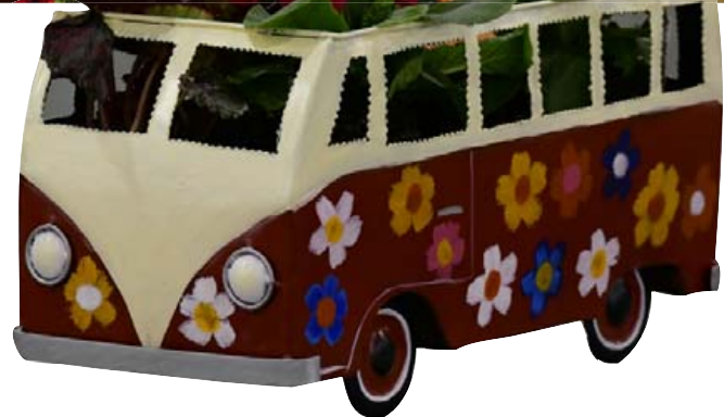
Woodstock í einni mynd. Dásamlegt.

Friður og ró var yfir sýningunni þó að einhverrar mestu rokkhátíðar sögunnar hafi verið minnst.