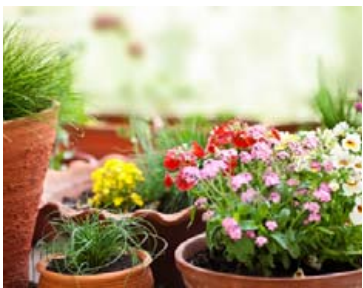
Þrýði er að blómum og öðrum gróðri á svölum.