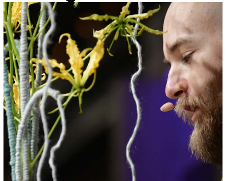
Fjöldmargir fyrirlesarar fræddu aðra um allt það nýjasta í blómaskreytingum.

Hvort sem fólk elskar Andy Warhol eða Roy Lichtenstein þá var eitt-hvað fyrir alla á sýningunni og ástin sveif svo sannarlega yfir vötnum.