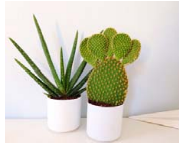
Grænar plöntur passa alls staðar við, sérstaklega inn á baðið.

Þó tannhvöss sé er þessi planta sérstaklega góð í að hreinsa andrúmsloftið og fer því