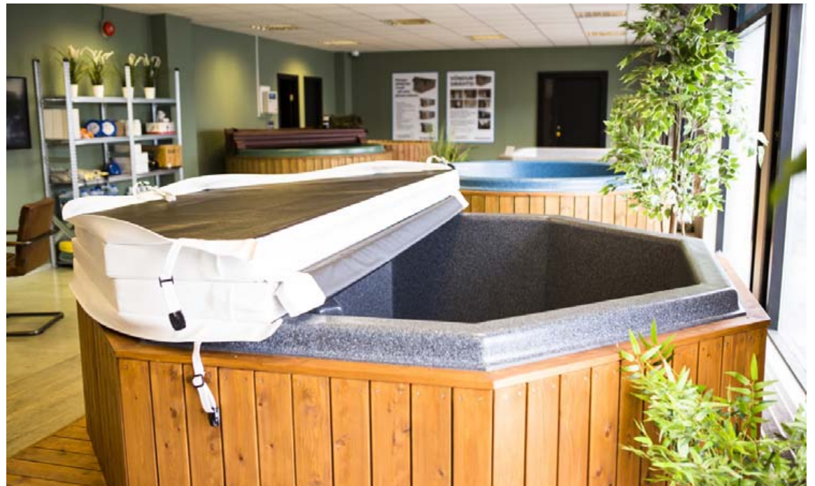
Fyrir tveimur árum byrjaði Normx að selja forsmíðaðar burðargrindur fyrir pottana sem hafa slegið í gegn. Sparar bæði tíma og fyrirhöfn.

N ormx er íslenskt fjölskyldu-fyrirtæki sem framleiðir og selur heita potta og allt sem þeim tilheyrir. Normx er 40 ára gamalt dótturfyrirtæki vélsmíðjunnar Norma, en bæði fyrirtækin hafa verið í eigu sömu fjölskyldu frá upphafi. Fyrirtækið framleiðir sjálfstætt pottana, sem eru heilsteyptir og sérhannaðir fyrir íslenskar aðstæður og það er stærst á markaðnum hérlandis. Fyrir tveimur árum byrjaði fyrirtækið svo líka að selja forsmíðaðar burðargrindur fyrir pottana, sem hafa slegið í gegn.