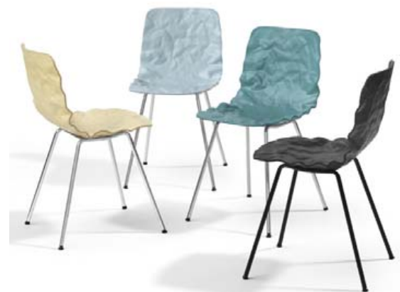
Dent frá Blá Station er svansvottaður í öllum útfærslum.