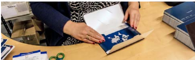
Verkefni hjá Múlalundi eru afar fjölbreytt.

fötun og veikindi, bæði andleg og líkamleg, í kjölfar slyss eða heilsuþrestra.