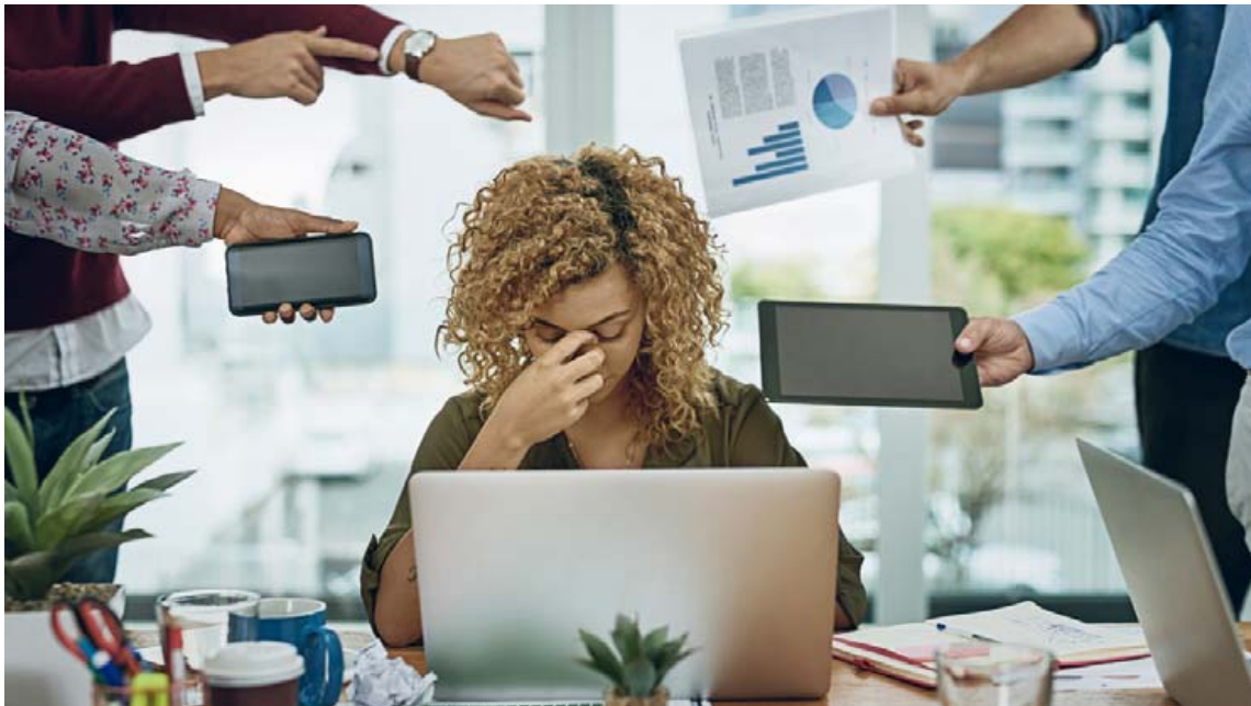
Allir þurfa að hjálpast að við að koma í veg fyrir streitu og kulnun á vinnustað.

Í Svíþjóð hefur verið unnið markvisst að því að fá fólk aftur út í atvinnulífið sem orðið hefur fyrir kulnun í starfi vegna streitu og álags. Sænska verkefnið kallast Hugsandi vinnustaðir (Reflective