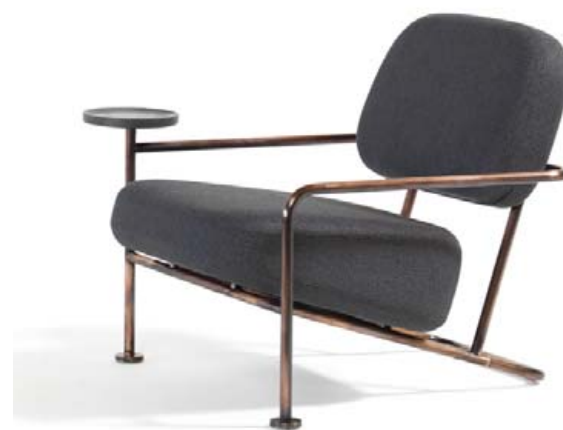
Stóllinn Áhus frá nýjasta samstarfsaðila A4, Blá Station.