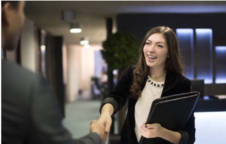
Allir muna eftir fyrsta vinnudegi sínum á nýjum vinnustað. Góðar móttökur geta skipt sköpum til að skapa jákvætt viðhorf.

Harpa segir mörg stærri fyrirtæki vera með formlegt fóstarkerfi þar sem eldri og reyndari starfsmenn taki á móti þeim nýju