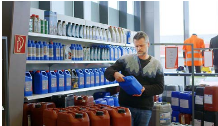
N1 býður upp á flott merki í olíum og efnavörum, t.d. Mobil, Q8 og Comma.

„Við viljum stöðugt bæta þjónustuna og ná til fleiri viðskiptavina og þá sérstaklega til smærri verktaka og einstaklinga. Við hvetjum fólk til þess að koma við hjá okkur og kynna sér þjónustuna en fyrir tveimur árum