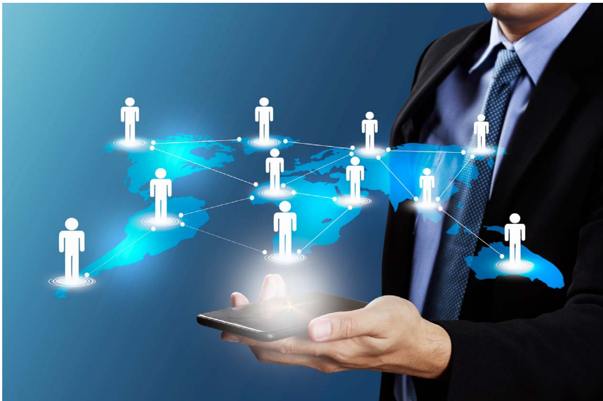
WiseFish var innleitt í fyrirtæki í Súrínam, sem er á norðausturströnd Suður-Ameríku. Innleiðing var framkvæmd í gegnum fjartengingu og þannig sparaðist tími og peningar.

H ugbúnaðarfyrirtækið Wise sérhæfir sig í viðskiptalausnum fyrir allar greinar atvinnulífsins. Wise hefur um 20 ára skeið verið leiðandi í þróun hugbúnaðarlausna fyrir fjölda fyrirtækja hérlendis og erlendis. Auðvelt er að aðlaga hugbúnaðinn hverju fyrirtæki fyrir sig en sérlausnir Wise svo sem laun, banki, innheimta og WiseFish eru í raun allsherjarlausn sem notar Microsoft Dynamics NAV, nú í nýrri útgáfu sem kallast Microsoft Dynamics 365 Business Central eða Business Central (BC).