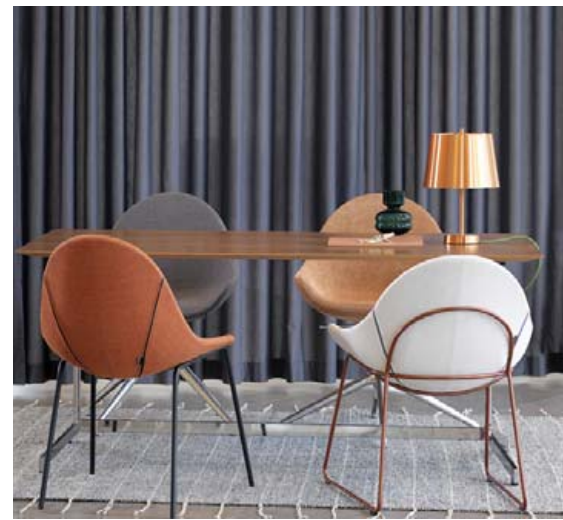
Atticus stóllinn frá Johanson er fánlegur í mörgum flottum útfærslum. MYND/A4