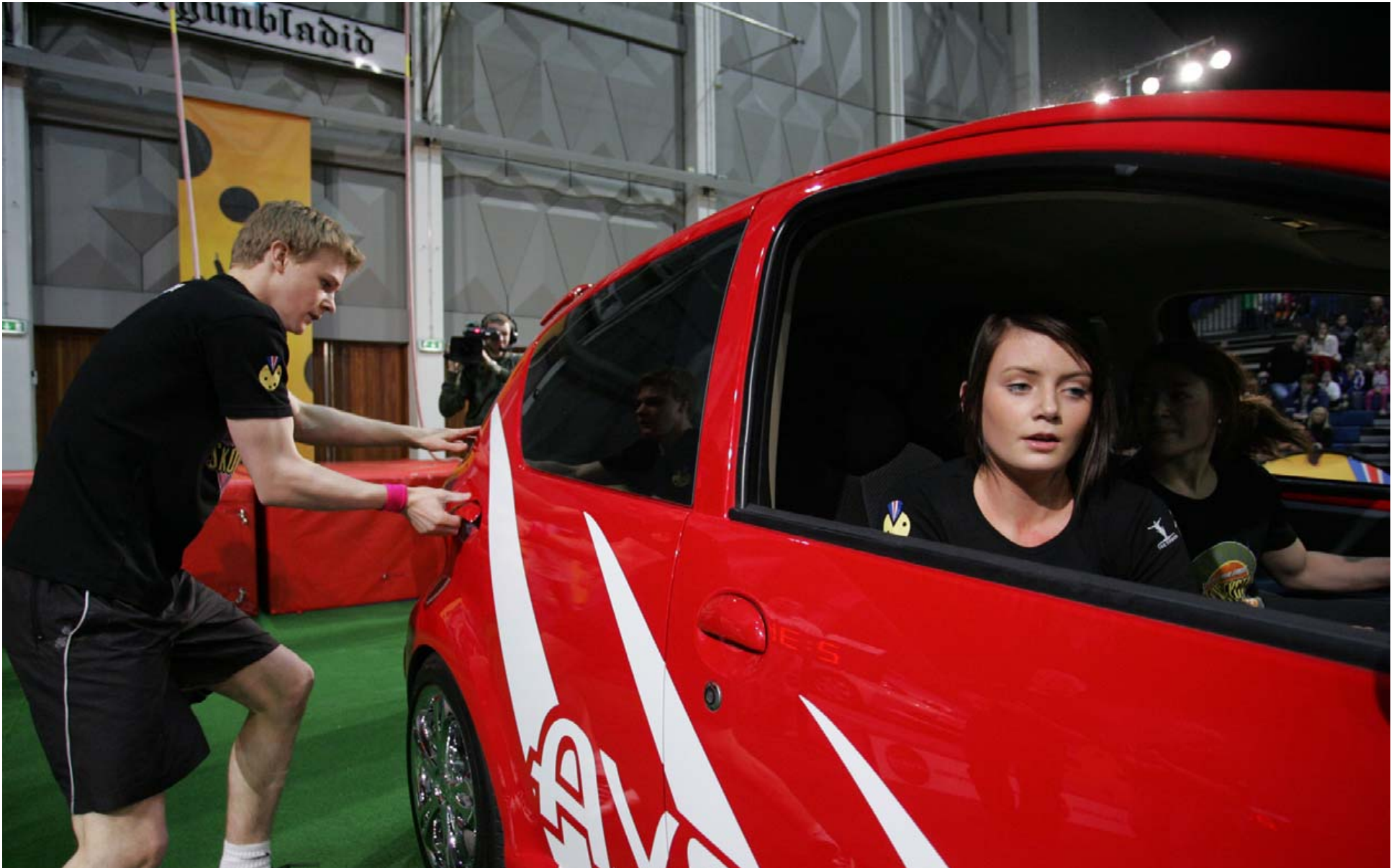
Tímabprautin í Skólahreysti hefur lengi endað á því að krakkarnir skella aftur hurð á Toyota-bíl. Gífurlegur hávaði er í höllinni þegar krakkarnir þeysast af stað í tímabprautinni.