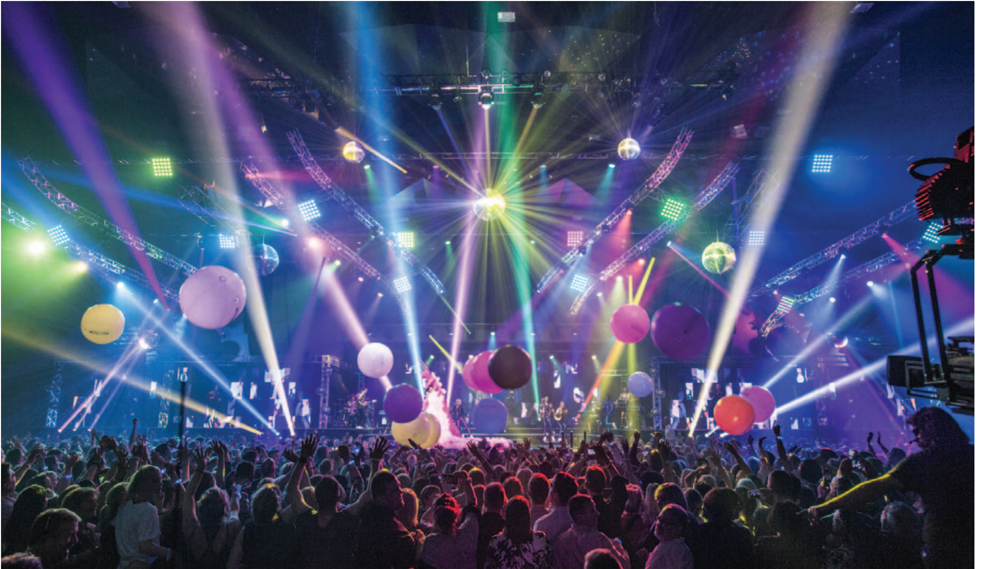
Frá stórtónleikum Páls Óskars í Laugardalshöll.