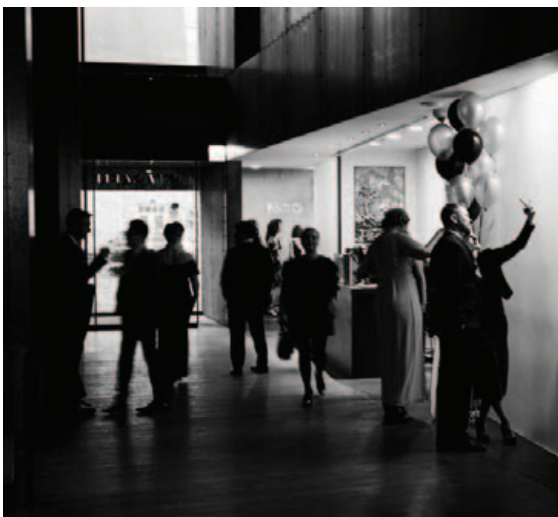
Heillandi viðburðir eru aðalsmerki Trío Events.

Nýjasta verkefni Trío Events var verkefnastjórnun við framleiðslu á nýrri náttúruminjasýningu í Perlunni á vegum Náttúruminjasafns Íslands sem lauk með glæsilegri opnun 1. desember síðastliðinn.