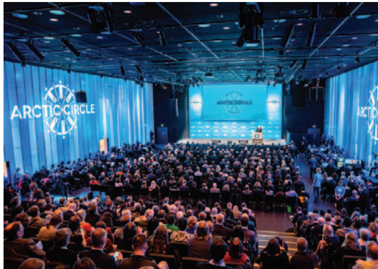
Arctic Circle ráðstefnan er haldin í Hörpu á hverju ári.

Hún segir gífurlega eftirvæntingu ríkja eftir opnun Edition hótelins við hliðina á Hörpu árið 2020. „Það mun klárlega auka möguleika Hörpu í alþjóðlegu samhengi en mörg erlend samtök hafa bedið í eftirvæntingu eftir opnun hótelins þar sem hótelíð gerir það enn fýsilegra fyrir þau að koma með sína viðburði til landsins. Hótelíð gerir okkur einnig kleift að sækja um annars konar fyrsta flokks viðburði þar sem samspil hótelins og Hörpu skiptir meginmáli. Lega Hörpu, miðsvæðis í hjarta miðborgar, er ekki