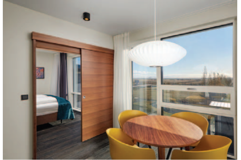
Falleg svíta á hótelinu þar sem fólk getur notið lífsins.