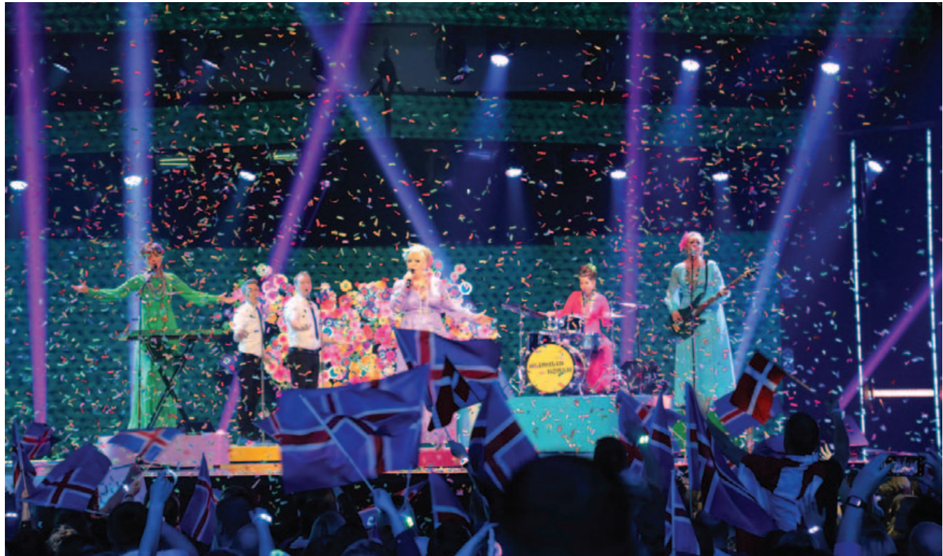
Frá Söngvakeppni RÚV 2018.