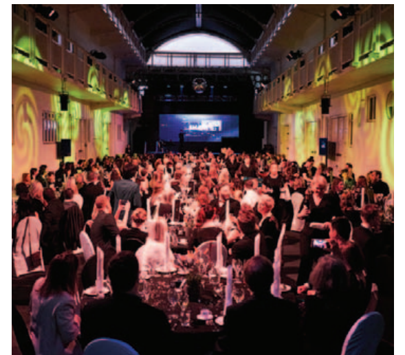
Árshátíðum og ráðstefnuhaldi eru fundnir fallegir staðir.