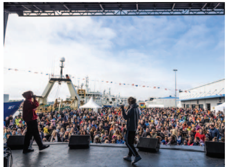
Frá Sjómannadeginum við HB Granda og Hátíð hafsins í Reykjavík.