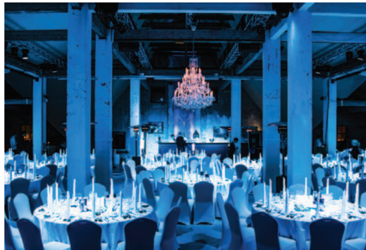
g-events kann svo sannarlega að skapa einstaka umgjörð um viðburði sína.

„Við þurfum að vera frjóg þegar kemur að nýjungum í upplifunum því oft vinnum við fyrir sömu fyrirtækin aftur og aftur. Útlendir viðskiptavinir eru jafnan undrandi á því hversu mikið er í boði í svo litlu landi; flottir salir, mikið af skemmtilegri afþreyingu og Íslendingar fara alla leið í öllu því sem þeir gera. Við þykjum því