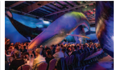
Það er ógleymanleg upplifun að sitja í veislu með stórhvelum Íslands.