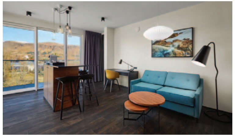
Önnur svíta þar sem fallegt umhverfið er allt um kring.