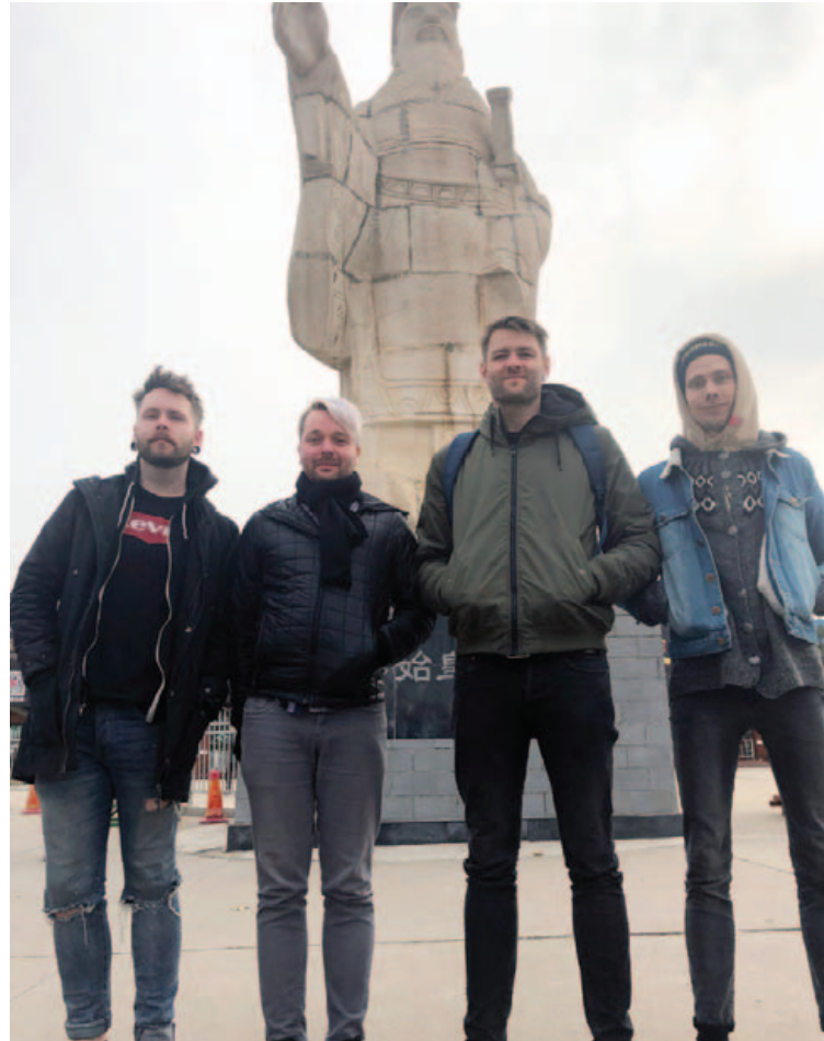
Félagarnir í We Made God við stytta af Qin Shi Huang, fyrsta keisara Kína.