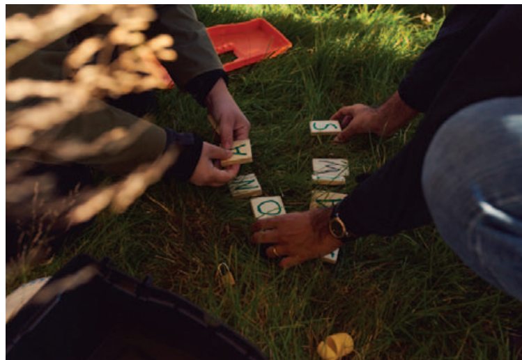
Prautir og skemmtilegir leikir eru stundum viðfangsefni í hvataferðum.