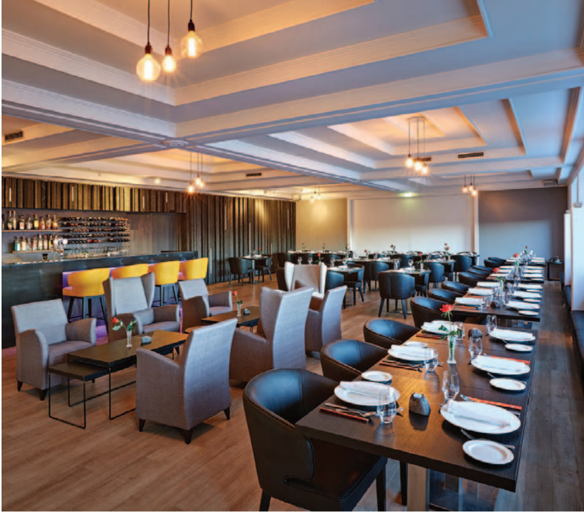
HVER er frábær veitingastaður fyrir alla fjölskylduna sem var gerður upp samhliða öðrum endurbótum á hótelinu.