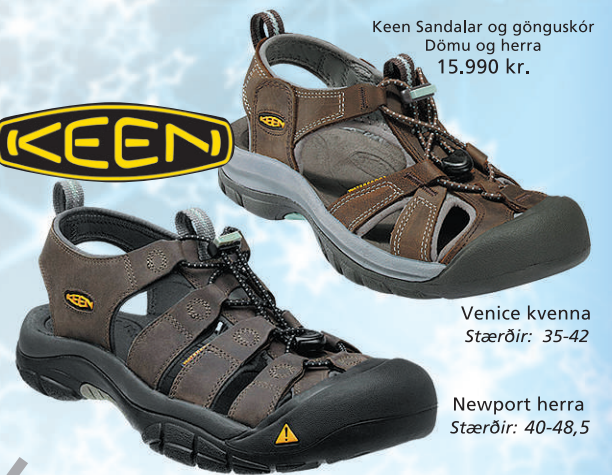
Keen Sandalar og gönguskór Dömu og herra 15.990 kr.