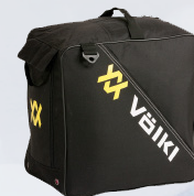
Skíðapakkar fyrir skíðin, skóna, hjálma o.fl. mikið úrval Verð frá 4.995,-