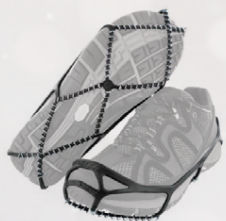
Yaktrax hálkugormar fjölmarginar tegundir Verð frá 1.995,-