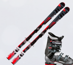
Skíðapakkar fyrir alla fjölskylduna 20% JÓLAFLÁTTUR

Herra: Verð frá 72.784,- Dömu: Verð frá 71.184,- Unglinga: Verð frá 49.984,- Barna: Verð frá 35.188,-