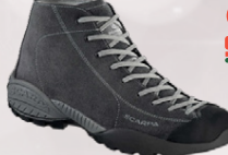
Scarpa Mojito Mid Jólatilboð 23.996,-