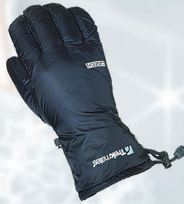
Trekmatess Lite Dry 5.990 kr.