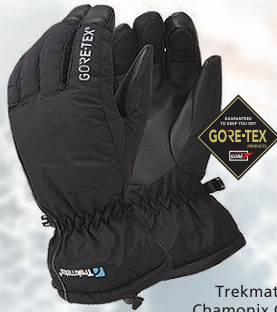
Trekmatess Chamonix Glove 9.990 kr.