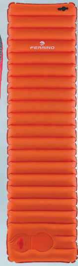
Ferrino Swift60 Tjalddýna með innb. fótapumpu 13.995 kr.