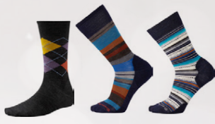
Smartwool sokkar fjölbreytt úrval Verð frá 2.595,-