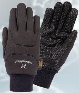
Sticky Powerliner Glove 5.590 kr.