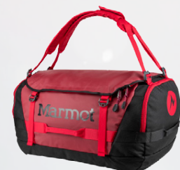
Ferðatöskur / Duffles Marmot og Sea To Summit Verð frá 17.995,-