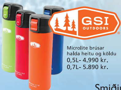
Microlite brúsar halda heitu og köldu 0,5L- 4.990 kr. 0,7L- 5.890 kr.