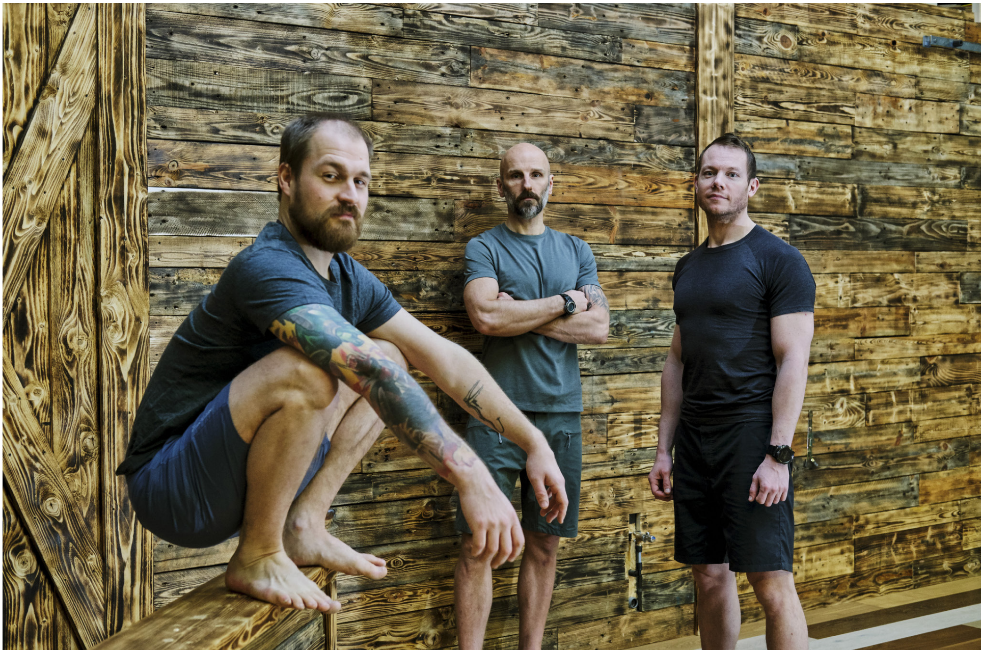
Fötin frá Houdini hindra ekki hreyfingar á neinn hátt og henta því sérstaklega vel í æfingarnar hjá Primal Iceland, sem snúast um að hreyfa líkamann á nýjan hátt.