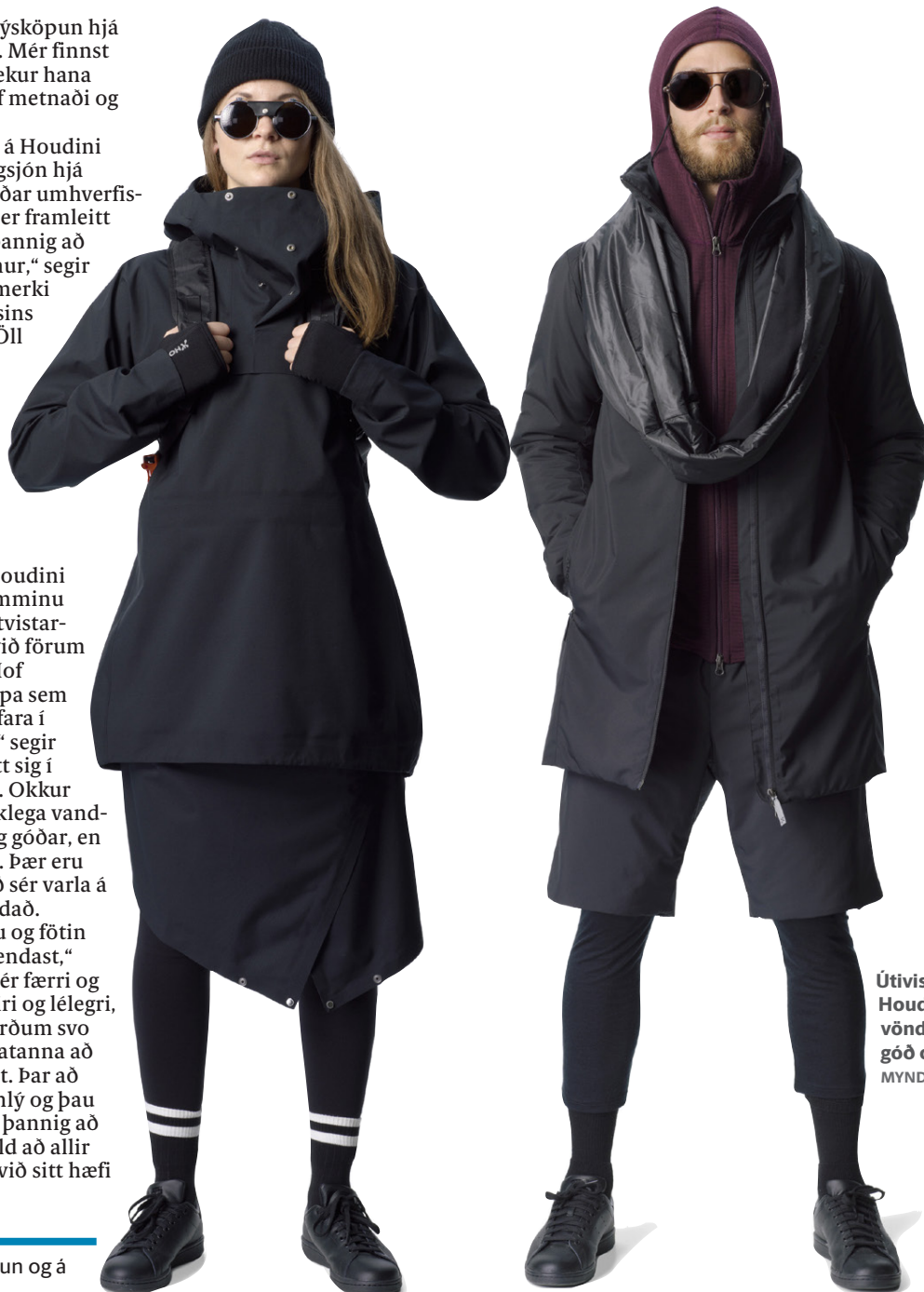
Útivistarfötin frá Houdini eru bæði vönduð, endingargóð og flott.

Houdini vörurnar fást í H Verslun og á www.hverslun.is .