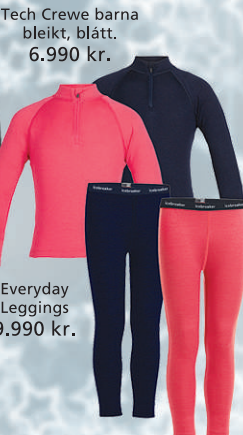
Tech Crewe barna bleikt, blátt. 6.990 kr.