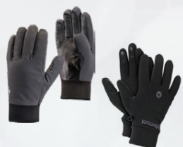
Vettlingar mikið úrval Marmot, Dakine o.fl. Verð frá 4.995,-