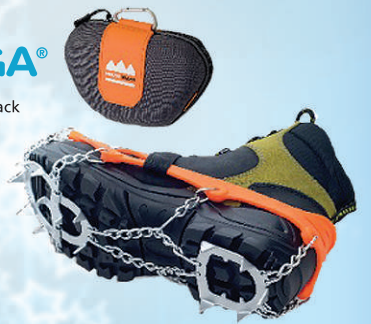
Veriga Mount Track broddar 6.990 kr.