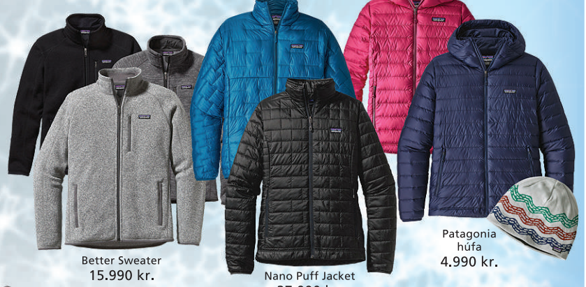
Better Sweater 15.990 kr.