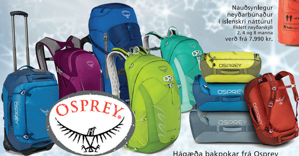
Hágæða bakpokar frá Osprey Eitt mesta úrval landsins

Mikið úrval af Patagonia vörum fyrir dömur og herra.