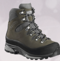
Scarpa Mythos Pro Gtx. Dömu gönguskór Jólatilboð 43.996,-