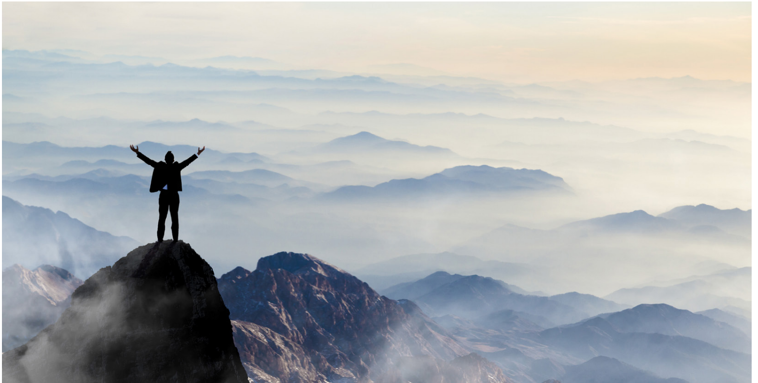
Reykbindindi er dæmt til að mistakast ef það er ekki hafid af réttum ástæðum. Mikilvægt er að hafa löngun til að hætta að reykja ef það á að takast.

Reykbindindi er dæmt til að mistakast ef það er ekki hafid af réttum ástæðum. Þú skalt hætta