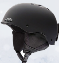
Skíðahjálmar Smith, Julbo og Shred Verð frá 9.995,-