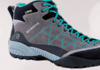
Scarpa Zen Pro Mid Herra og dömu skór Jólatilboð 27.996,-