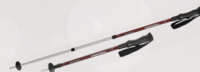
Göngustafir mikið úrval Black Diamond og Komperdell Verð frá 8.995,-