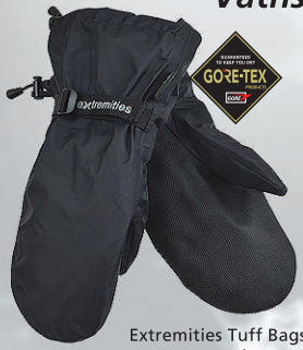
Extremities Tuff Bags 12.990 kr.