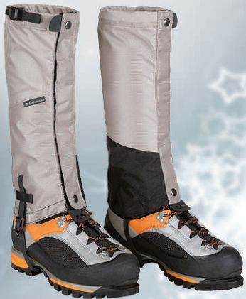
Legghlífar, svartar/gráar verð frá 7.790 kr.