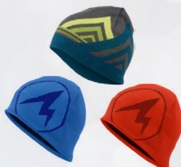
Húfur mikið úrval Marmot, Arcteryx o.fl. Verð frá 4.995,-