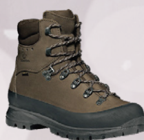
Scarpa Hekla Gtx. Dömu gönguskór Jólatilboð 39.996,-