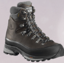
Scarpa Kinesis Pro Gtx. Herra gönguskór Jólatilboð 43.996,-