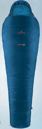
Ferrino Lighttec SM1100 15.990 kr.