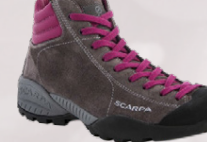
Scarpa Mojito Plus Jólatilboð 23.995,-