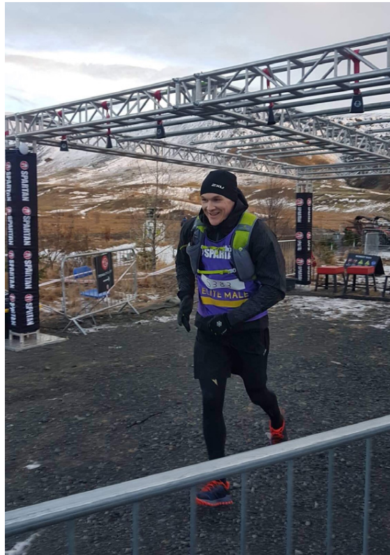
Lagt af stað í 24 stunda hindrunar- og þreklaup.