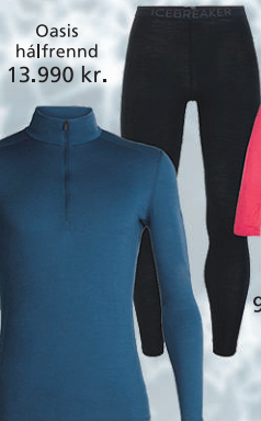
Oasis hálfrennd 13.990 kr.