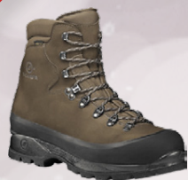
Scarpa Ladakh Gtx. Herra gönguskór Jólatilboð 39.996,-