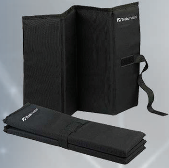
Trekmatess ferðasessa Ver bossann fyrir bleytu og kulda 1.590 kr.

Full búð af spennandi vörum fyrir útivistarfólk á öllum aldri