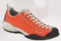
Scarpa Mojito Jólatilboð 15.996,-