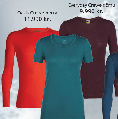
Oasis Crewe herra 11.990 kr.