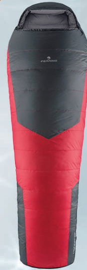
Ferrino Lighttec Duvet 1200 dúnpoki 42.590 kr.