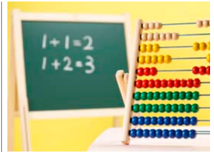
Tvíhliða bókhald á rætur sínar að rekja til Ítalíu.

t.d. tvíhliða bókhald þegar á 14. og 15. öld. Tvíhliða bókhald þýðir í sinni tærustu mynd að hverja bókhaldsfærslu þarf að færa á tvo bókhaldslykla og að debet verður að vera jafnt og kredit. Frönsk lög frá árinu 1673 eru þau fyrstu sem sett voru um færslu bókhalds en samkvæmt þeim var kaupmönnum skylt að færa bókhald árlega og efnahagsreikninga annað hvert ár og fylgigögn skyldu geymd í ákveðinn tíma. Á nítjándu öld kom dálka- dagbókin fram á sjónarsviðið og hafði í för með sér miklar framfarir í færslu bókhalds. Árið 1911 var bókhaldsskylda lögleidd hér- lendis með lögum um versunarbækur.