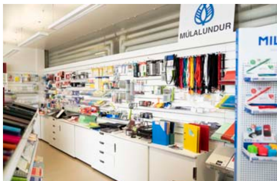
Múlalundur selur allt sem hugsast getur fyrir skrifstofuna