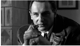
Liam Neeson fór með hlutverk bókarans Oscars Schindler.