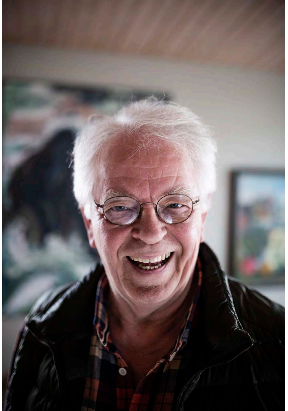
Arnar er með mörg járn í eldinum, les ljóð, inn á auglýsingar og leikur í sjónvarpi og kvikmyndum. Hann segir skrytið að unglingar séu sminkaðir upp sem gamalmenni þegar gamalreynndir leikarar séu til í verkin.

„Síðan ég kom fyrst til Reykjavíkur hafa orðið gríðarlegar