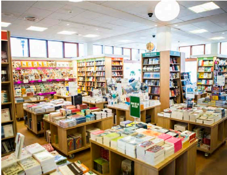
Í Pennanum Eymundsson á Skólavörðustíg er áhersla lögð á fjölbreytt úrval bóka og tímarita.