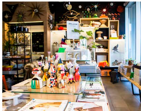
Í versluninni á Laugavegi 77 er áhersla mest á hönnunartæki frá hinu þekktu svissneska fyrirtæki Vitra.

fulness for Cats, Cats in hats, Be more Cat og svo framvegis. Svona lífsleikni-kattabækur.“ Og þessi áhersla hefur aukid fjölbreytni viðskiptavinahópsins. „Við fáum