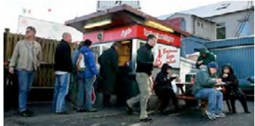
Bæjarins beztu urðu 80 ára í fyrra.