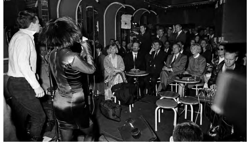
Sykurmolarnir halda tónleika fyrir Mitterrand, Vigdísí Finnbogadóttur og fleiri gesti á Duus í lok ágúst 1990.

Eftirminnilegustu tónleikarnir sem haldnir voru í húsinu eru að mati margra þeir sem Sykurmolarnir héldu fyrir François Mitterrand Frakklandsforseta, frá Vigdísí Finnbogadóttur forseta og aðra gesti árið 1990.