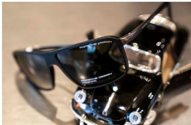
Mikið úrval sólgleraugna fæst hjá Gleraugnasölnni, meðal annars frá Porsche.

sérfræðing sem sér um þær fyrir okkur. Það er allt svona hjá okkur, við viljum bara vera með toppvöru og við leggjum mjög mikla áherslu á að allur okkar varningur og þjónusta sé í úrvalsflokkki.