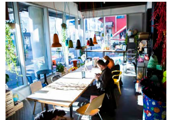
Kaffihús Te og kaffi eru starfrækt í öllum bókabúðum Pennans Eymundsson í miðborginni, starfsfólki og gestum til mikillar ánægju.

sátt við það en hún spígsporar um búðina og hjálpar til við að kynna kattabækurnar. Og nýtir sér örugglega fróðleikinn úr þeim í leiðinni.“