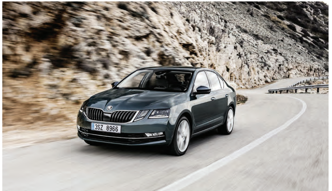
Skoda Octavia G-Tec.

Suzuki efstur á blaði, annar var Nissan Micra og þriðji Kia Rio. Í flokki millistærðarfólksbíla varð efstur Hyundai Ionic, annar Honda Civic og þriðji Hyundai i30. Í flokki jeppa og jeppinga bar sigur úr þytum Volvo XC60, annar varð Skoda Kodiaq og þriðji Renault Koleos. Allra hæstu einkunn allra þessara bíla hlaut Peugeot 3008. Næstflestu stigin fékk svo Hyundai Ionic og þau þriðju flestu Volvo XC60. Verðlaun fyrir bíl ársins, sem og fyrir fyrstu þrjú sætin í hverjum flokki voru veitt með viðhöfn í sal Blaðamannafélagsins í Síðumúla á fimmtudagskvöldið og voru margir viðstaddir þá athöfn.