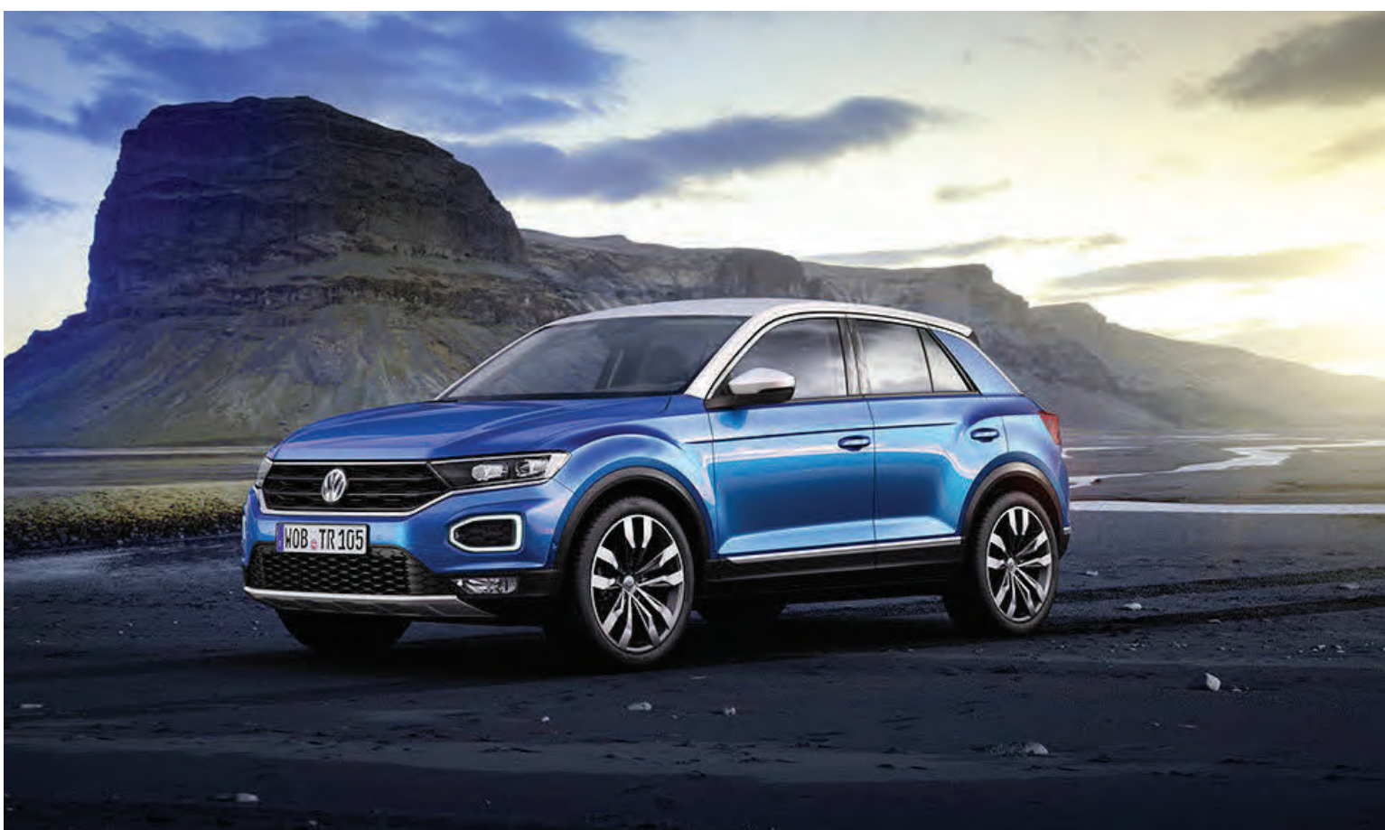
Það er greinilega í mikilli tisku að bjóða nýja bíla með öðrum lit á þaki bílanna. Það kemur einkar vel út hér.

Sem fyrr segir klikkar Volkswagen ekki á vélaúrvalinu og býður T-Roc með 6 vélagerðum, þremur bensínvélum og þremur dísilvélum. Þarna gerir Volkswagen mun betur en margur annar bílaframleiðandinn þar sem oft skortir á meira úrval og að minnsta kosti eina öfluga gerð. T-Roc má nefnilega fá með 190 hestafla bensínvél og er sá bíll ekki nema 7,2 sekúndur í hunddraðið. Vélarnar eru frá 115 til 190 hestafla og