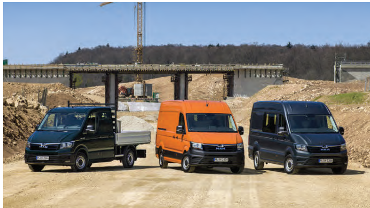
Kaupendur MAN sendibíla geta valið úr gríðarlegu úrvali í útfærslum.

TGE-sendibílar frá MAN eru búnir 2,0 lítra dísilvél sem fáanleg verður í fjórum útfærslum, 102, 122, 140 og 177 hestafla. Margir valkostir í útfærslu sendibíla munu fást. Fjöldi möguleika verður á yfirbyggingum, lokaður sendibíll og grindarbílar með einföldu húsi eða flokkahúsi. Flokkahúsið verður fáanlegt í fjölda útfærslu. Bílarnir verða fáanlegir með fjórhjóladrifi, framhjóladrifi og afturhjóladrifi og annað hvort með 8 gíra sjálfskiptingu eða 6 gíra beinskíptingu. TGE sendibílar eru af þremur mismunandi lengdum, með tvenns konar hjólhaf og þrjár mismunandi þakhæðir. Lokaði sendibíllinn verður til í 6 metra, 6,8 metra og 7,4 metra lengdum og hæðin 2,3m, 2,6 og 2,8 metrar. Hámarks rúmmál er 18,3 rúmmetrar. Að auki verða í boði sendibílar til fólksflutninga og má kalla slíka bíla mini-rútur sem henta mjög vel fyrir íslenska ferðabjónustu.