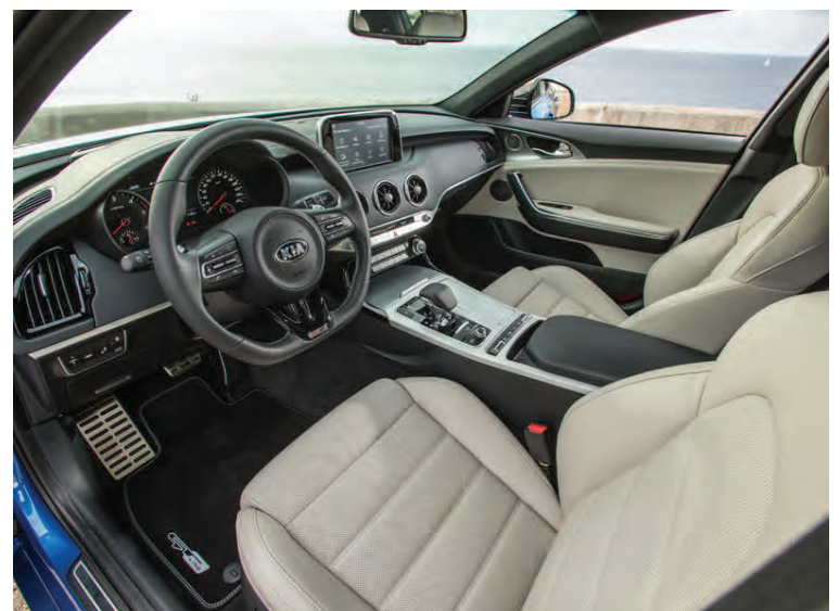
Jafn fögur sýn blasir við þegar inn er komið.

Kia Stinger verður í boði hér á landi með tveimur vélarkostum. Með 2,2