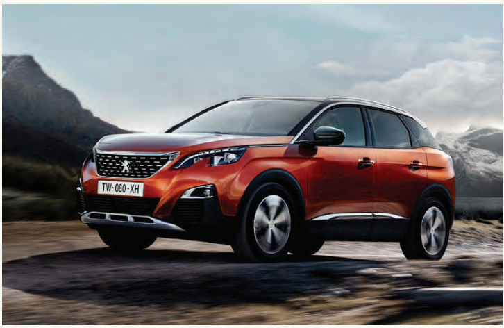
Peugeot 3008 var einnig kjörinn bíll ársins í Evrópu.