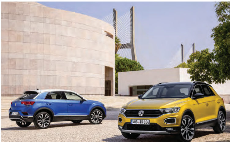
Litaútfærslurnar í T-Roc eru nánast óteljandi.