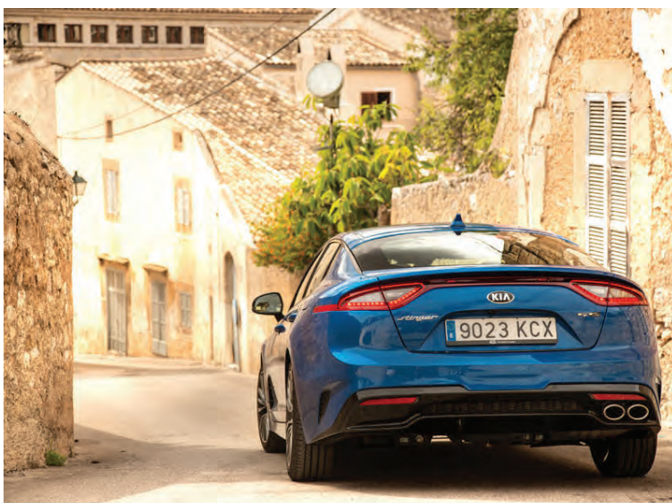
Í reynsluakstrinum á Mallorca blöstu bæði við fögur hús og fagrir bílar.

marga farþega í gleðiaksturinn, heldur er þarna kominn hörkuflottur bíll sem dregur augun að sér ef marka má forvitnina sem vegfarendur sýndu er hann rann um göturnar á Mallorca. Víst er að hann er enginn eftirbátur bíla í sama stærðar- og kraftaflokkki hvað fegurð varðar, þ.e. bíla eins og BMW 5, Audi A6, Mercedes Benz E-Class og Lexus GS og að margra áliti slær þeim hreinlega við. Coupé lag bílsins, sterkar línur og lengd bæði húdds og bílsins alls ljær honum mikinn edalsvip og hann á sannarlega eftir að vekja athygli hér á landi er hann fer að streyma á göt-