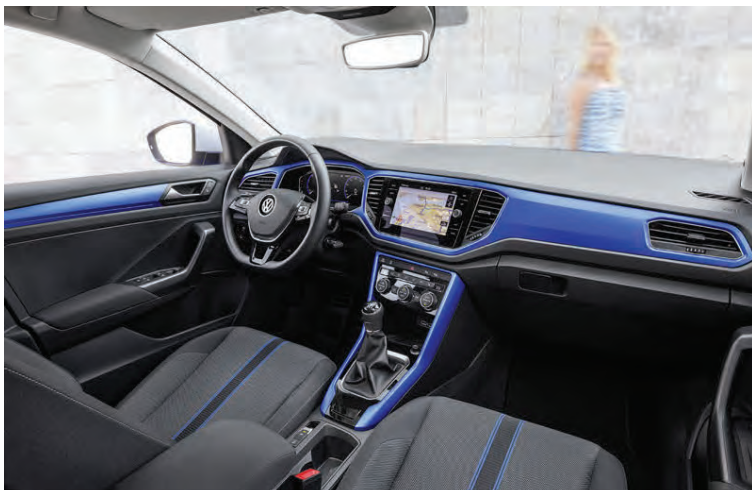
Ytri litur bílsins er færður í innanrýmið og það gefur frísklegt yfirbragð.

sú aflminnsta er ekki nema 1,0 lítra og þriggja strokka vél. Staðreyndin er bara sú að flestar af þeim þriggja strokka vélum sem bjóðast í smærri bílum nú eru ári skemmtilegar, hljóma vel og duga þeim flestum. Það mun vafalaust einnig eiga við í tilfelli T-Roc en nú við kynningu T-Roc, sem fram fór í nágrenni Lissabon í Portúgal, var sá bíll ekki til reynslu þar sem framleiðsla hans er ekki hafin. Þar voru hins vegar 150 hestafla dísilútgáfa hans og 190 hestafla bensínbíll. Svo athyglivert er að bæði dísilvélnar þrjár og bensínvélnar þrjár eru 115, 150 og 190 hestöfl og allar forþjöppudrifnar. Með minnstu bensín- og dísilvélunum er T-Roc aðeins með framhjóladrifi, með öflugustu vélunum eingöngu með fjórhjóladrifi en með 150 hestafla vélunum fæst hann bæði með fjór- og framhjóladrifi. Fá má bæði 6 gíra beinskíptingu og 7 gíra DSG-sjálfskíptingu.