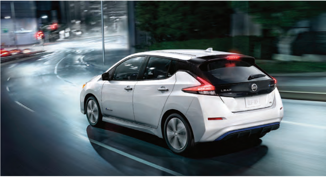
Nýasta kynslóð Nissan Leaf er mun fegurri en forverinn.