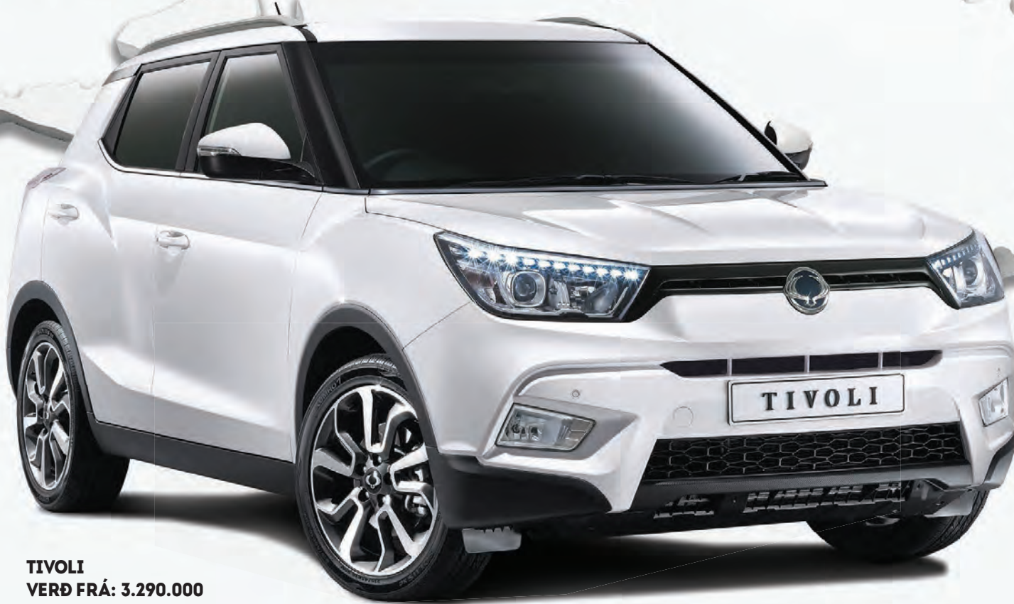
TIVOLI VERÐ FRÁ: 3.290.000