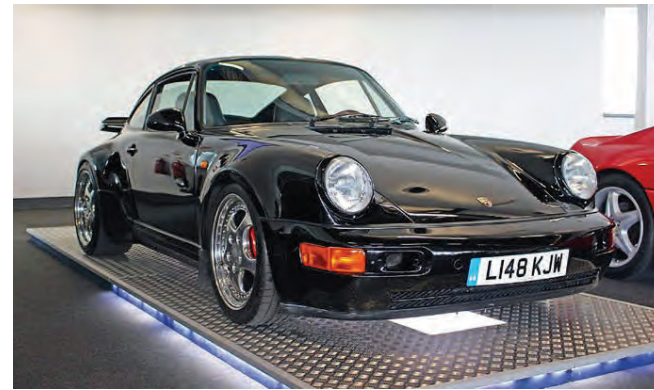
Porsche 911 Turbo S Leichtbau árgerð 1993.

var barist á uppboðinu um bílinn og fékkst fyrir hann mun hærra verð en búist hafði verið við. Porsche 911 Turbo S Leichtbau er 180 kílóum léttari en hefðbundin gerð Porsche 911 Turbo S frá þessum tíma. Notkun koltrefja og áls, engin aftursæti, þynnra gler og teppi, skottlok og vindskeið úr kevlar-efni eiga mestan hlut í því að bíllinn er svo léttur. Ekki nóg með það að Porsche 911 Turbo S Leichtbau sé svona miklu léttari þá er hann með 61 hestafla meira en hefðbundna gerðin og skilar 381 hestafla úr 3,3 lítra og 6 strokka vél með forþjöppu, sem tengd er við 5 gira beinskíptingu.