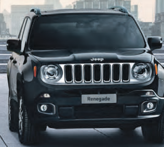
JEEP RENEGADE VERÐ FRÁ 4.790.000 KR.