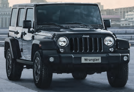
JEEP WRANGLER VERÐ FRÁ 8.490.000 KR.

Hvort sem þú ert að leita að vel búnum og þægilegum borgarbil eða öflugum jeppa, þá uppfyllir Jeep hvort tveggja, auk þess að bjóða upp á kraftmiklar en hagkvæmar vélar. Komdu í reynsluakstur og finndu út hvaða Jeep hentar þér.