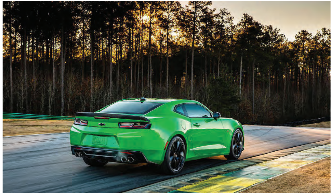
Chevrolet Camaro er einn öflugra bíla sem framleiddir eru í Bandaríkjunum.

EPA segir að hæsta sekt sem leggja má á fyrir þetta svindl ef satt reynist sé 4,6 milljarðar dollara, eða 460 milljarðar króna. Ákæran nú varðar sölu á 104.000 bílum af Jeep Grand Cherokee og Ram 1500 bílum með dísilvélum. Til samanburðar hefur Volkswagen samþykkt að greiða 25 milljarða dollara vegna dísilvélasvindl þess vegna bíla sem seldir voru í Bandaríkjunum, en það varðaði sölu á 500.000 bílum. Yfirvöld í Þýskalandi hafa einnig ásakað Mercedes Benz fyrir að gefa upp rangar mengunartölur fyrir dísilbíla sína sem seldir voru þar í landi. Það er því ekki bjart yfir dísilbílaframleiðendum víða um heiminn nú og hætt við því að framleiðsla dísilvéla muni svo gott sem leggjast af í fólksbílum á næstu árum.