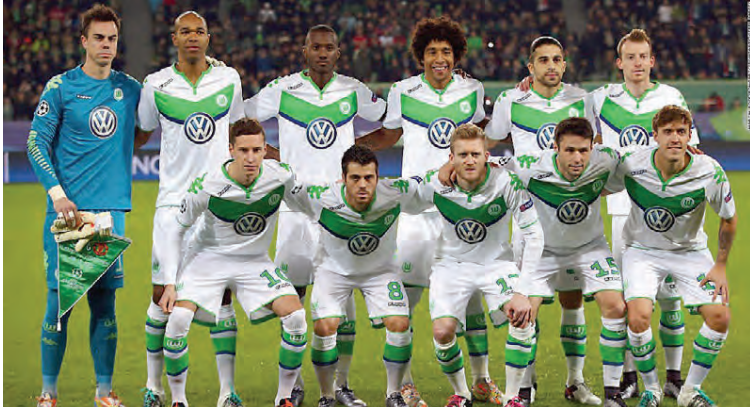
Wolfsburg-liðið er ávallt með merki Volkswagen á brjóstinu.

Tenging bílaframleiðenda við knattspyrnufélög er afar þekkt og til dæmis er General Motors með Chevrolet merki sitt á búningum Manchester United og Fiat hefur löngum verið með eitt af sínum bílamerkjum framan á búningum Juventus. Volkswagen hefur gegnum tíðina eytt ógrynni peninga í Wolfsburg liðið og það hefur verið stolt Volkswagen. Ekki bar sú peningaeyðsla mikinn ávöxt þetta keppnistímabilið. Wolfsburg er fimmta verðmætasta lið þýskrar knattspyrnu þó það hafi ekki sýnt sig á vellinum á nýliðnu keppnistímabili. Það gerði það hins vegar árið 2015 þegar Wolfsburg vann