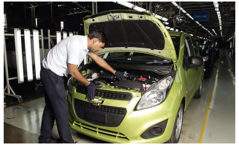
Frá verksmiðju General Motors á Indlandi.

asta ári, svo þessi tvö lönd skipta ekki miklu máli í heildarstarfsemi GM. Undanfarið hefur bílasala á Indlandi verið á undanhaldi og auðveldar það GM að taka þessa ákvörðun. GM er reyndar með eina bílaverksmiðju á Indlandi og verður starfsemi hennar haldið áfram, en allir bílar sem þar verða framleiddir verða fluttir til annarra landa. Þar vinna um 2.500 manns. GM er líka með eina verksmiðju í Suður-Afríku en ætlar að selja hana til Isuzu Motors sem og 30% hlut sem GM á í annarri verksmiðju með Isuzu.