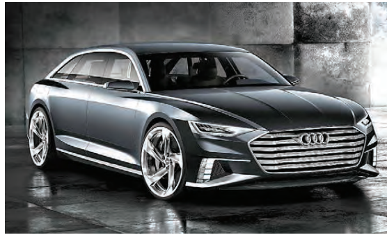
Audi A8 nýr mun fá útlitsein-kenni frá Prologue tilraunabíl Audi.

annað sem rafdrifið er í bílum. Mercedes Benz mun einnig kynna samskonar kerfi í andlitslyftum S-Class bíl sínum sem kynntur verður í næsta mánuði. Renault hefur nú þegar sett svona kerfi í dísilútgáfu Megane skutbilsins og Scenic minivan bílsins. Bílaframleiðendur leita allra leiða til að minnka bæði eyðslu og mengun bíla sinna og notkun þessarar nýju tækni í því augnamiði er gott dæmi þess.