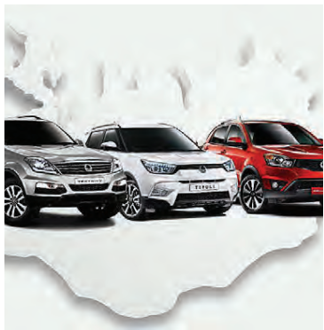
Rexton, Korando og Tivoli eru fyrir ferðaglaða Íslendinga.