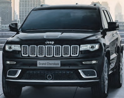
JEEP GRAND CHEROKEE VERÐ FRÁ 8.990.000 KR.