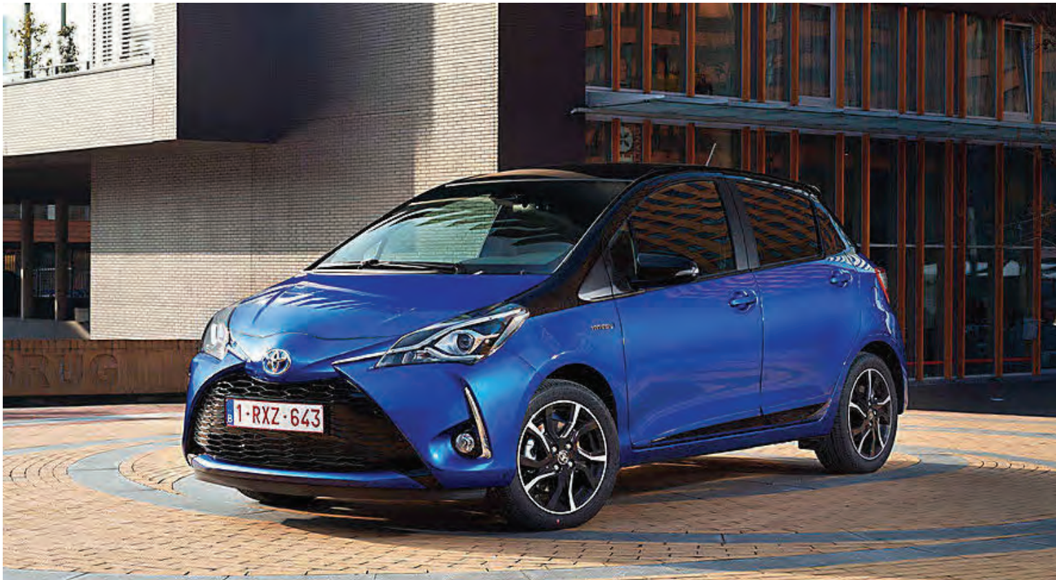
Breytingin á bílnum nú ætti að falla í góðan jarðveg, enda bíllinn allur fegurri og reffilegri.

Yaris hefur frá upphafi, sem spannar frá árinu 1999, verið frekar „chic“ bíll sem höfðað hefur til ungu kynslóðarinnar og hefur gjarnan verið annar bíll heimila sem haft hafa efni á því að eiga tvo bíla. Hann hefur því gjarna verið til afnota fyrir þau afkvæmi sem komin eru með bílpróf, sem og frúna sem kys sætan og lítinn bíl. Þó hefur greinarritari oft séð að hann er ekki síður val hús-