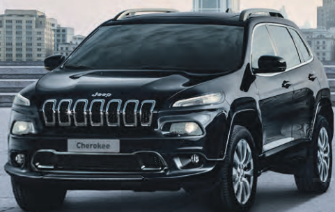
JEEP CHEROKEE VERÐ FRÁ 6.990.000 KR.