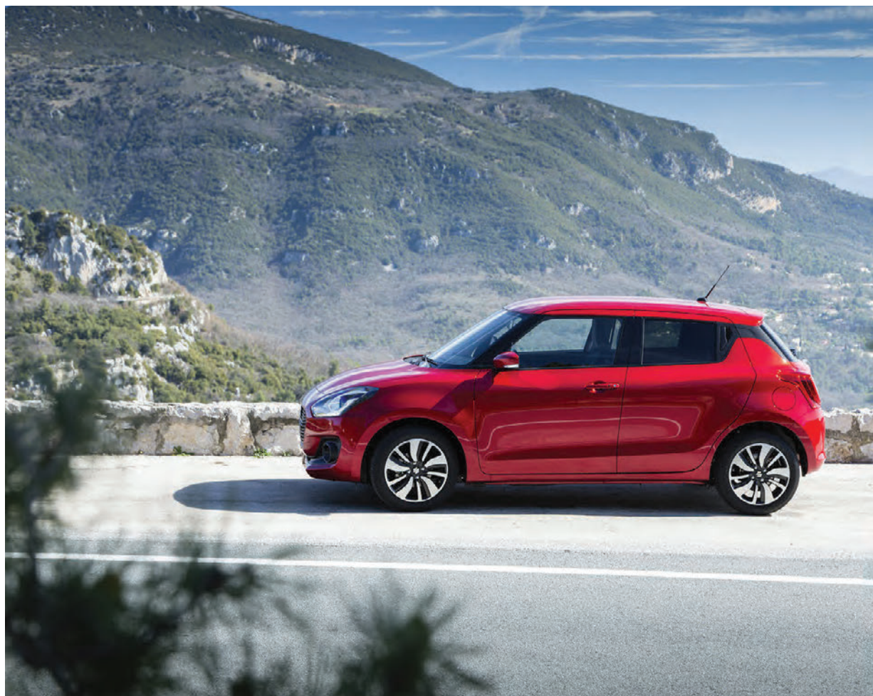
Suzuki Swift af nýrri kynslóð má vel þekkja frá þeirri síðustu.

Suzuki Swift hefur verið einn allra besta smábíll sem fá má frá því hann fyrst kom fram á sjónarsviðið árið 1983. Hann er nú kominn af sjöttu kynslóð en sú síðasta var fyrst kynnt árið 2010, þó svo hann hafi fengið andlitslyftingu í millitíðinni. Það er afar mikilvægt að Suzuki lukkist vel við smíði nýs Swift því hann er lykilbíll í bílafloðu Suzuki og alls hafa selst af honum hátt í 5 milljón eintök um heim allan. Hann hefur frá upphafi fengið meira en 60 alþjóðleg verðlaun og safnar enn grímt. Swift er smíðaður á léttvigtarundirvagninum „Heartect“ sem einnig er undir nýju Suzuki Baleno og Ignis bílunum. Nýr Suzuki Swift var kynntur bíla- blaðamönnum á ekki leiðinlegri stað en í Mónakó um daginn og átti sú staðsetning vel við fallega endurhannaðan bílinn. Sem fyrr er Swift friður sýnum, skemmtilega kantaður og með mikinn karakter. Mjög vel má sjá að þarna fer arftaki síðustu kynslóðar, en allar þær breytingar sem hafa verið gerðar eru til góðs og eina ferðina enn er Swift með sportlegri smábílum sem bjóðast og það rímar líka einkar vel við sportlega eiginleika hans. Swift hefur nú styst um 1 cm, breikkað um 4 cm og lækkað um 1,5 cm í framhjóladrífsútgáfunni, en hækkað um 1 cm í