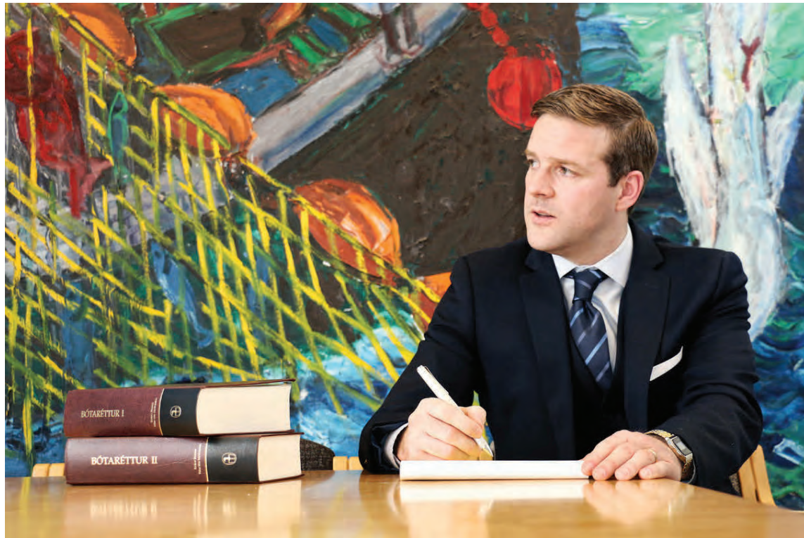
Námið er til að mynda tilvalið fyrir stjórnendur og er einnig sérlega góður kostur fyrir þá sem hafa lokið grunnnámi í lögfræði.