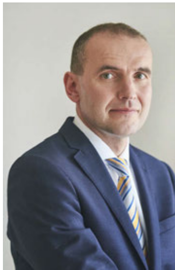
Guðni Th. Jóhannesson, forseti Íslands, afhendir Menntaverðlaun atvinnulífsins.

Í framtíðinni má jafnvel sjá fyrir sér að mannhöndin verði nær alfarið óþörf á einhverjum veitingastaðum því víða er þegar í dag hægt að tölvuæða nær allan hluta rekstursins, þar með talið eldamennskuna og framreiðsluna.