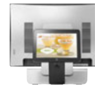
AUKASKJÁR FYRIR VIÐSKIPTAVINI