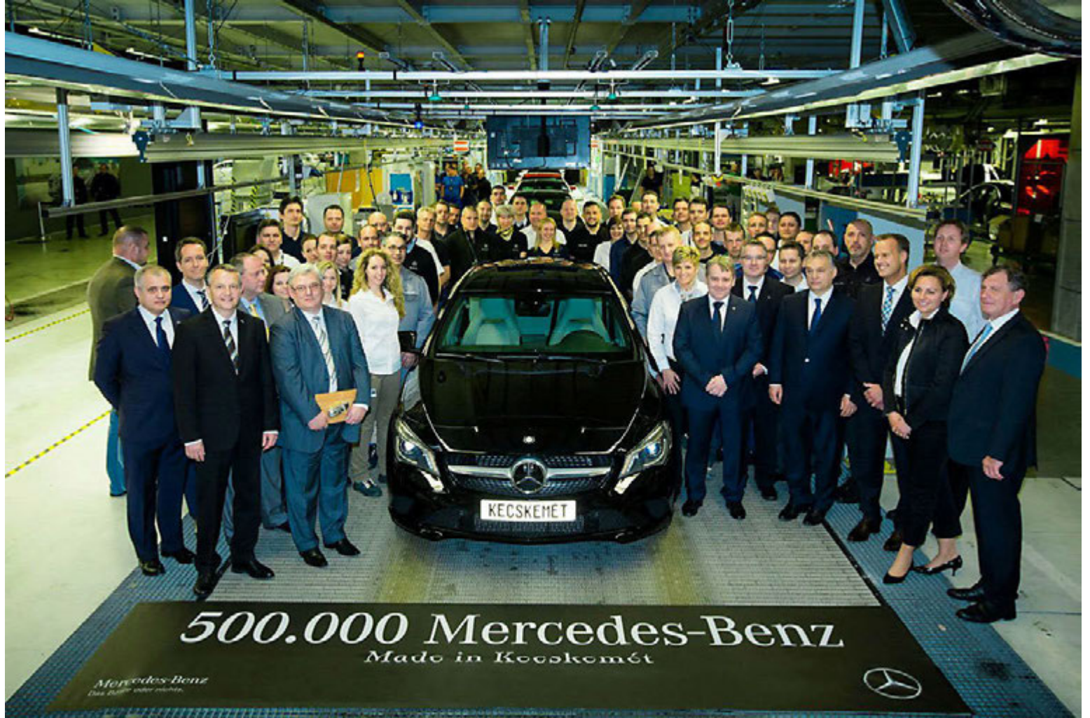
Starfsfólk verksmiðjunnar í Kecskemet fagna sínum fimmhundraðasta bíl.

Subaru í Bandaríkjunum fagnaði þeim áfanga í lok júlí að þrjár milljónir Subaru-bíla hafa verið framleiddar í verksmiðju fyrirtækisins í Indiana sem tók til starfa í september árið 1989. Þriðja milljónasta eintakið sem kom af færribandinu þann 28. júlí var af gerðinni Subaru Outback. Eftirspurn eftir Subaru hefur aukist á liðnum árum í Bandaríkjunum sem mætt hefur verið með aukinni framleiðslu í verksmiðjunni í Indiana. Þar var sett framleiðslumet á síðasta ári þegar 18,5% fleiri bílar komu af færriböndunum en árið á undan, eða alls 228.804 bílar. Subaru hefur ákveðið að auka framleiðslugetuna í 394 þúsund bíla á ári og verður lokið við nauðsynlegar breytingar á framleiðslulínunni í lok ársins. Frekari breytingar eru þó fyrirhugaðar því stefnt er að því að auka framleiðslugetuna enn frekar á næstu misserum og frá og með fyrri hluta árs 2019 er stefnt að því að verksmiðjan geti afkastað framleiðslu á 436 þúsund bílum á ári. Síðar á þessu ári hefst framleiðsla á nýjum Impreza í Indiana og árið 2018 hefst þar einnig framleiðsla á nýjum jepplingi með þremur sætisröðum sem tekur við af núverandi Tribeca-jeppa.