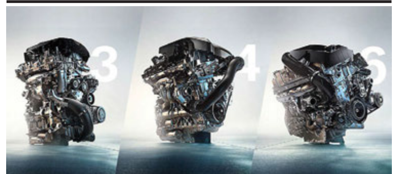
Þriggja, fjögurra og sex stokka vélar BMW.

uðum. Því gæti áhrifa dísilvéla-svindls Volkswagen frá því í september mikið í Bretlandi. Bretar virðast afar ginnkeyptir fyrir hagstæðum bílalánnum því fjórir bílar af hverjum fimm eru keyptir með slíkum lánnum. Bílasalar í Bretlandi óttast að bílasala muni falla mjög mikið á næstunni þar sem ódýr slík lán hafi mettað markaðinn. Á árinu hafa alls selst 1,6 milljónir bíla í Bretlandi og vöxturinn numið 2,8% frá því í fyrra. Minni sala á seinni hluta ársins gæti þurrkað þann vöxt út.