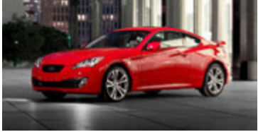
Hyundai Genesis Coupe.