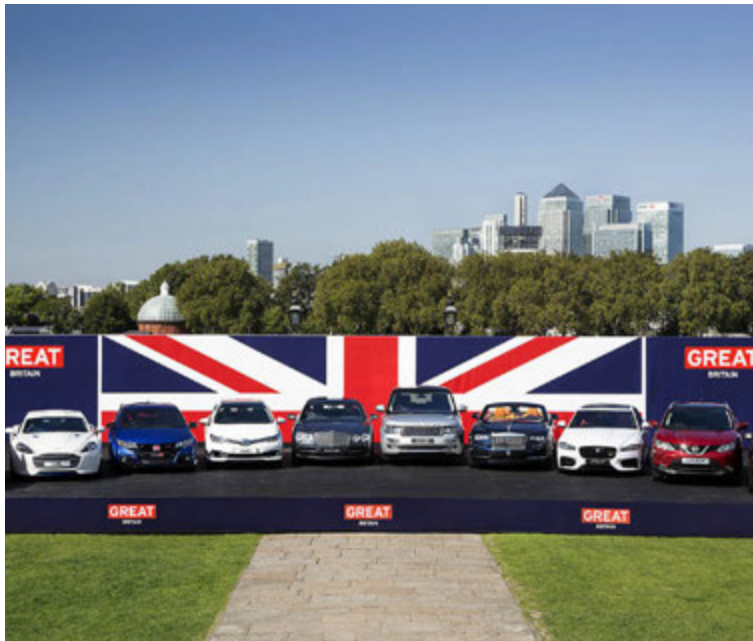
Bílaframleiðsla í Bretlandi er afar fjölbreytt.