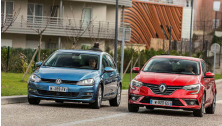
Renault og Volkswagen.