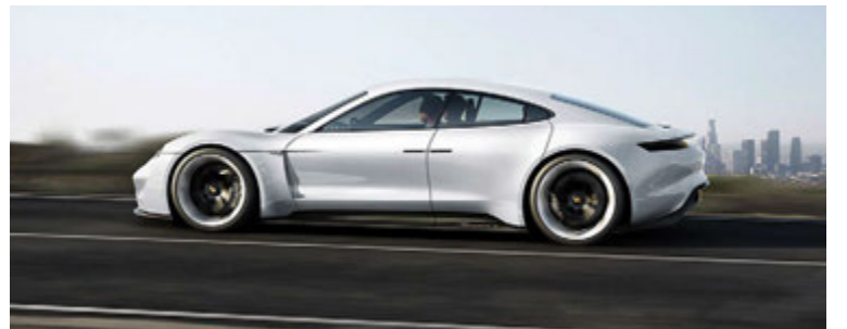
Porsche Mission E.

Porsche vinnur nú hörðum höndum að þróun fyrsta hreinræktada rafbíls síns, Mission E, og til þess þarf greinilega mikinn mannskap. Porsche hefur nú ráðið 1.400 nýja starfsmenn vegna hans. Upphaflega var meiningin að ráða 1.000 manns en nú hefur 400 verið bætt við. Þessi Mission E bíll á að keppa við Tesla Model S bílinn og sýnilegt er að Porsche er mikil alvara í samkeppninni. Um 1.200 þessara nýju starfa eru í Zuffenhausen í nágrenni Stuttgart, þar sem bíllinn verður smíðaður. Porsche segir að mikil samkeppni sé um hæft fólk og mikil barátta um besta fólknið á milli bílaframleiðenda. Mission E bíllinn verður, eins og margur annar bíllinn frá Porsche, mikið kraftatröll enda er hann 600 hestöfl og tekur sprettinn í 100 km hraða á 3,5 sekúndum og bætir með því tíma Porsche 911 Carrera um 0,7 sekúndur þó svo hann