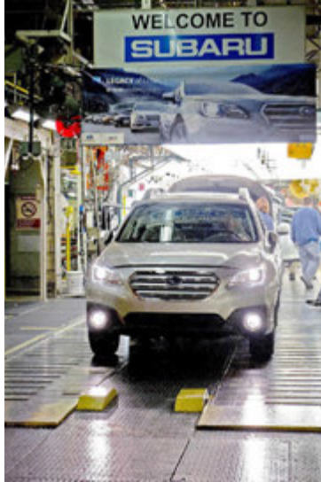
Bíll nr. 3.000.000 var Subaru Outback