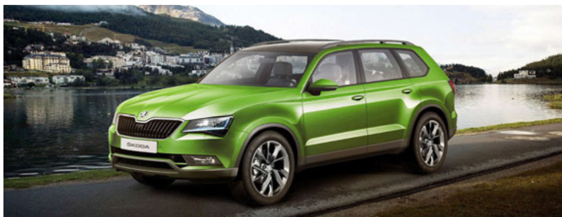
Skoda Kodiaq jeppinn.

af allra bestu og dýrustu sportbíla sem hægt var að festa kaup á þegar Elvis festi sér þetta eintak.