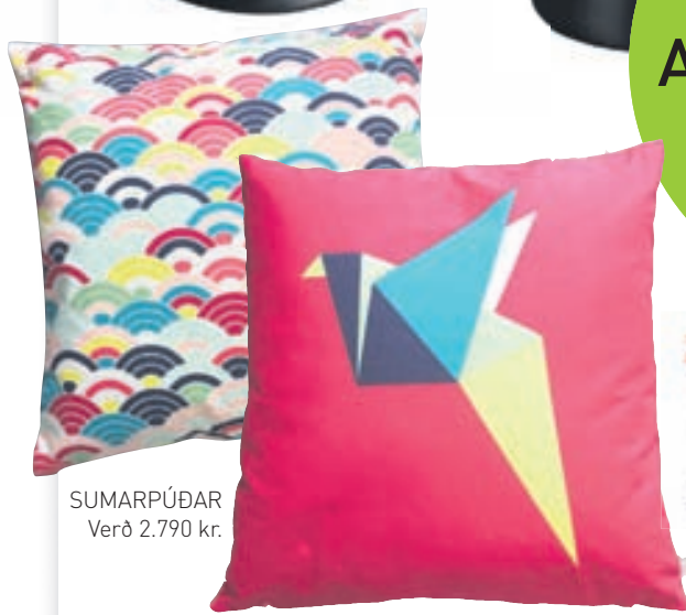
SUMARPÚÐAR Verð 2.790 kr.