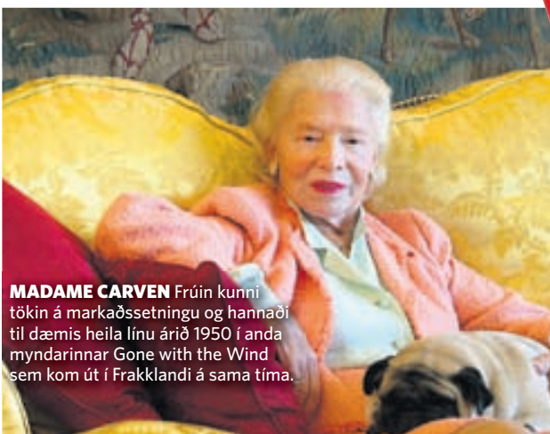
MADAME CARVEN Frúin kunnitökin á markaðssetningu og hannaði til dæmis heila línu árið 1950 í anda myndarinnar Gone with the Wind sem kom út í Frakklandi á sama tíma.

Carven varð fljótt afar vinsælt merki og stjórnur kepptust við að klæðast því. Madame Carven hætti að hanna fyrir merkið þegar hún var 84 ára. Guillaume Henry var gerður listrænn stjórnandi merkisins árið 2009 og hefur síðan hafið þetta gamla merki aftur til vegs og virðingar.