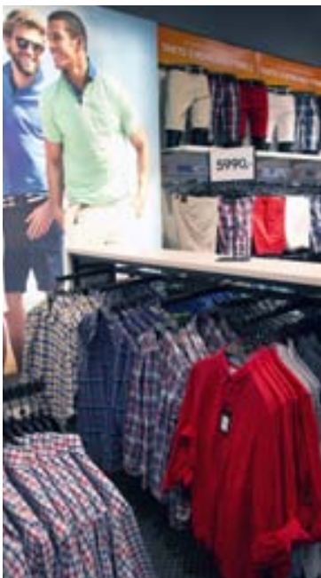
GOTT VERÐ Hjá Dressmann er alltaf hægt að gera góð kaup.