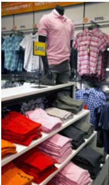
SUMARIÐ KOMIÐ Pólbólin í hressilegum litum verða heitir í sumar.