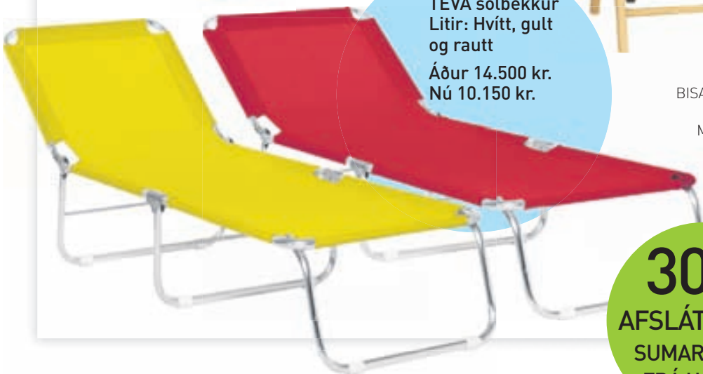
TEVA sólbekkur Litir: Hvítt, gult og rautt Áður 14.500 kr. Nú 10.150 kr.