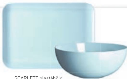
SCARLETT plastáhöld Bakki 1.347 kr. Salatskál 2.065 kr.