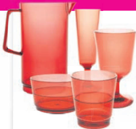
SADIE plastáhöld Margar tegundir Til í rauðu og glæru Kanna 2.065 kr. Kampavínsglas 665 kr. Vínsglas 595 kr. Skál 665 kr. Glas 525/595 kr.