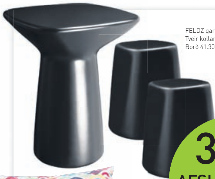
FELTZ garðsett Tveir kollar 15.750 kr. Borð 41.300 kr.