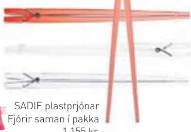
SADIE plastprjónar Fjórir saman í pakka 1.155 kr.