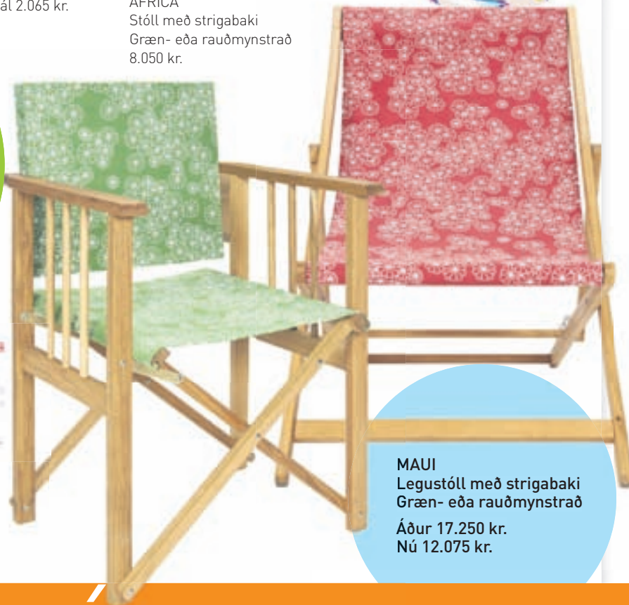
MAUI Legustóll með strigabaki Græn- eða rauðmynstrað Áður 17.250 kr. Nú 12.075 kr.

Öll verð eru afsláttarverð nema annað sé tekið fram