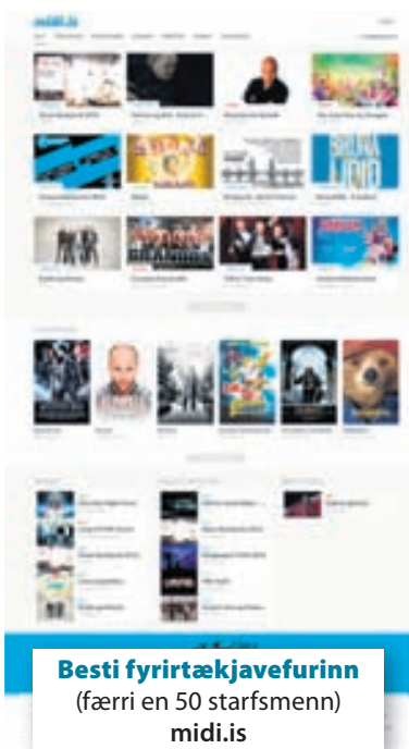
Besti fyrirtækjavefurinn (færri en 50 starfsmenn) midi.is