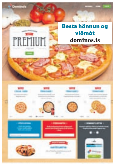
Besta hönnun og viðmót dominos.is