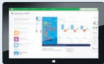
Prófaðu Dynamics NAV í skýinu: http://nav.ruedenet.com