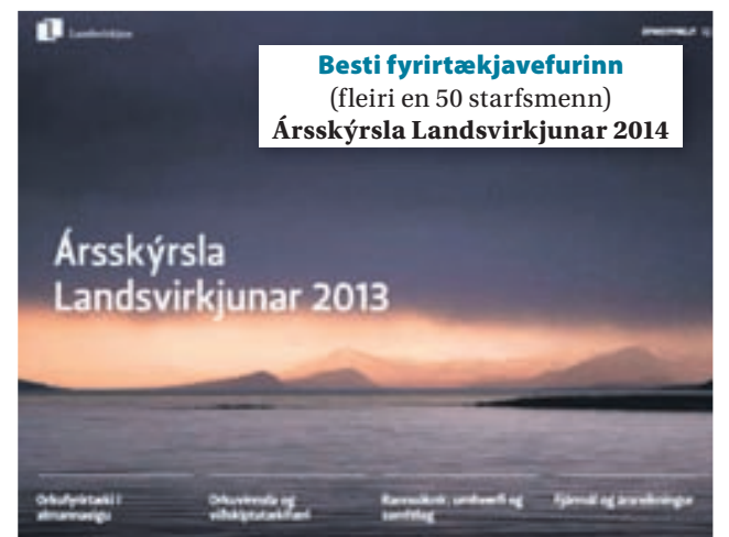
Besti fyrirtækjavefurinn (fleiri en 50 starfsmenn) Ársskýrsla Landsvirkjunar 2014

„Íslensku vefverðlaunin eru uppskeruhátíð í okkar fagi, svona eins konar „Óskar“ ...“