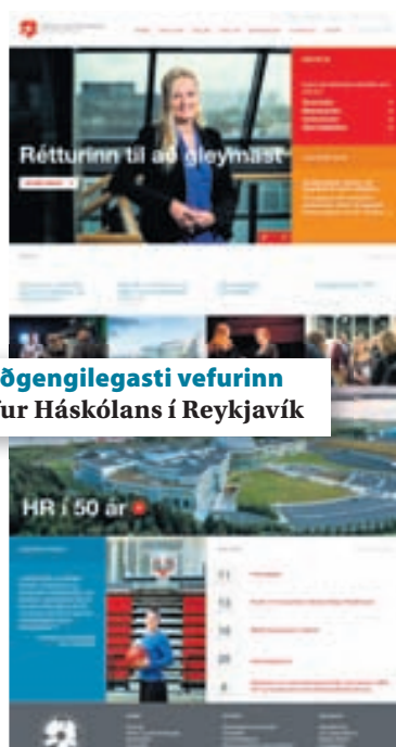
Aðgengilegasti vefurinn Vefur Háskólans í Reykjavík