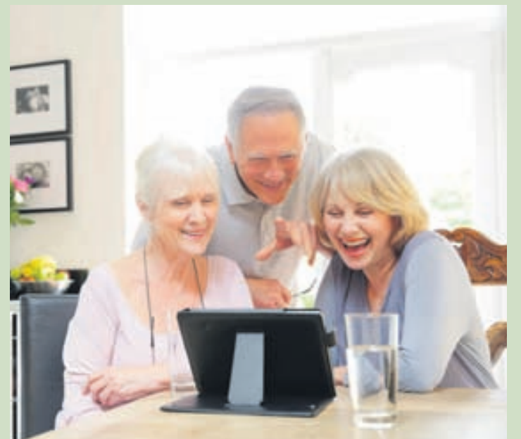
Spjaldtölvun hefur upp á marga möguleika að bjóða sem gott er að kunna skil á.

Til dæmis má nefna að hægt er að kaupa áhugaverðar bækur og lesa á spjaldtölvunni en hún gefur færi á að stækka letrið eftir því sem fólki finnst best.