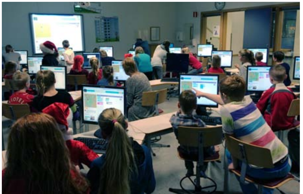
Eldri nemendur hjálpuðu til við forritunarkennslu yngri barnanna í Hörðuvallaskóla og tókst það vel.

20% FRAMHALDSSKÓLAFLÁTTUR NÁMSKEIÐIN ERU STYRKHÆF HJÁ FLESTUM STÉTTARFÉLÖGUM