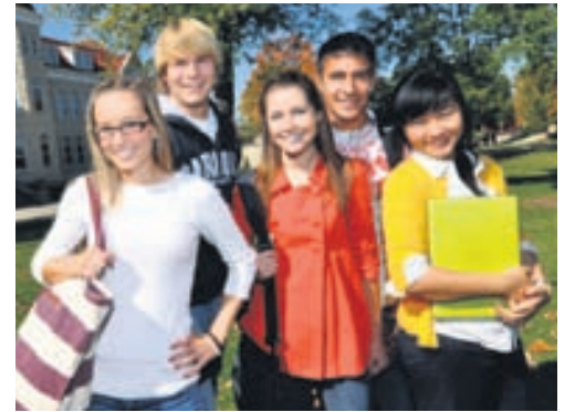
Íslenskir háskólanemar sækja mest til Danmerkur.

fullt nám við skólann, þar af flestir í Íslenska orkuháskólanum. Þeim erlendu nemendum sem sótt hafa skiptinám við Háskóla Íslands hefur fjölgað nær árlega frá 1992 fyrir utan veturinn 2007-2008. Að sama skapi hefur íslenskum nemendum fjölgað sem stunda nám erlendis með þeirri undantekningu að árin um og eftir hrun stóð fjöldinn nokkuð í stað. Eftir stígandi fjölda undanfarin ár fækka reynndar innlendum og erlendum nemendum þetta skólaárið. Flestir erlendir nemendur við Háskóla Íslands eru frá Þýskalandi, Frakklandi, Danmörku, Svíþjóð og Finnlandi en flestir íslenskir nemendur Háskóla Íslands sækja skiptinám til Danmerkur, Bretlands og Bandaríkjanna.