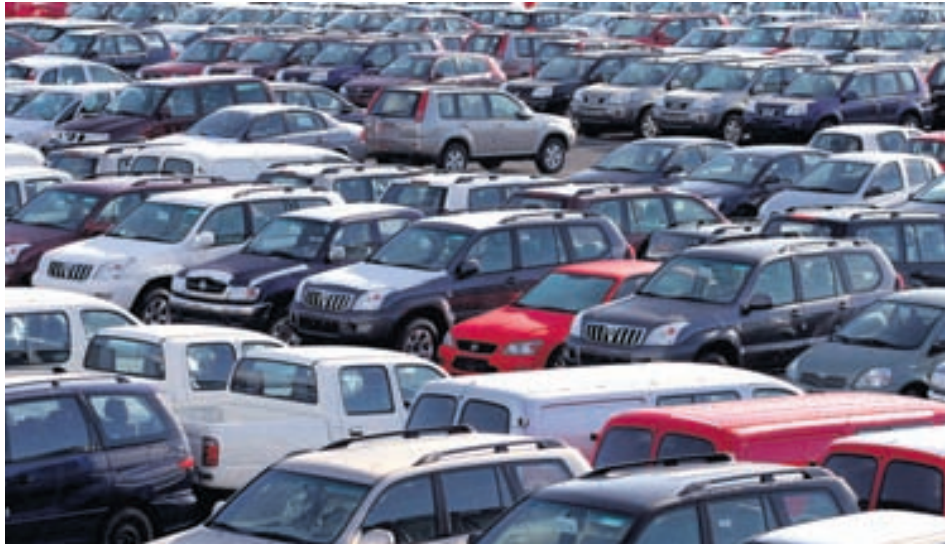
Samsetning bílaflotans hefur breyst hérlendis undanfarin ár.