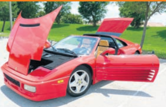
Ferrari 348 TS til sölu á 30.500 dollara.

Strangar reglur um sprengirými, dekk, loftflæði bílanna og aðstoðarkerfi í Formúlu 1-bílum hefur gert þá mun hægskreiddari en fyrir 10 árum. Þegar samanburður er gerður á tíma bílanna árið 2004 og á yfirstandandi tímabili kemur í ljós að miklu munar. Formúlu 1-bíll fór hringinn í Sepang-brautinni á 1:34,223 árið 2004 en á 1:43,066 í ár. Þar munar um níu sekúndum. Í ástralska kappakstrinum náðist 1:24,125 mínútna tími árið 2004 en aðeins 1:32,478 í ár og munar þar 8 sekúndum. Munurinn er minni í Mónakókappakstrinum en þar fór sneggsti bíll hringinn á 1:14,439 árið 2004 en á 1:18,479 í ár. Þar munar því aðeins fjórum sekúndum. Keppnisbíll Ferrari árið 2004 var með 10 strokka vél og drottnaði sá bíll yfir keppnistímabilinu þá. Nú eru Formúlu 1-bílar með sex strokka vélar og ná mest 800 hestöflum úr þeim, en enginn séns er að ná sambærilegum tímum með þeim og með stóru vélunum fyrir tíu árum. Finnst mörgum þetta súrt og að regluverk keppinnar sé of strangt.