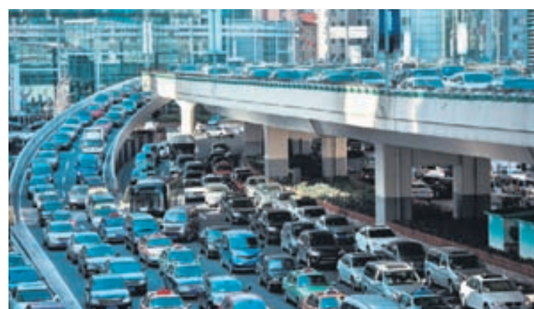
Pung umferð á bandarískri hraðbraut.

Mestar umferðartafir eru í Kaliforníuríki og nemur kostnaðurinn við þær fimmtungi af öllum kostnaðinum í landinu. Þar situr meðalmaðurinn 65 klukkutíma á ári fastur í umferðinni og víst er að á meðan skapa íbúar þar ekki mikið virði, held-