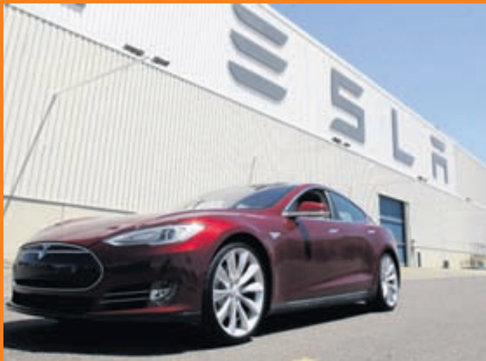
Tesla Model S fyrir utan höfuðstöðvar Tesla.