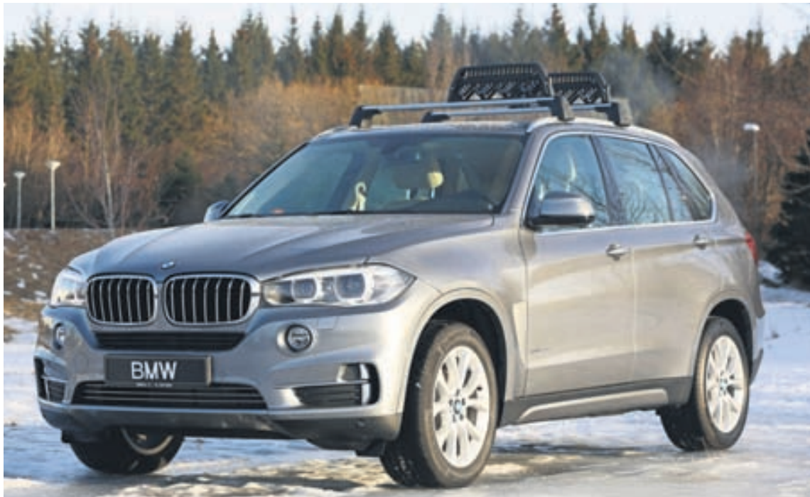
BMW X5 var fyrsti jeppi þýska lúxusbílaframleiðandans.

Bílaframleiðendum er gert af yfirvöldum að framleiða sífellt eyðslugrenni bíla og því streyma nú sífellt fleiri gerðir rafmagns- og tvinnbíla frá þeim, sem illa gengur að selja í Bandaríkjunum. Sú þróun hefur þó ekki orðið í Evrópu, en þar heldur sala rafmagns- og tvinnbíla áfram að aukast enda er eldsneytisverð í álfunni miklum mun hærra en í Bandaríkjunum, vegna hárra skatta á eldsneyti.