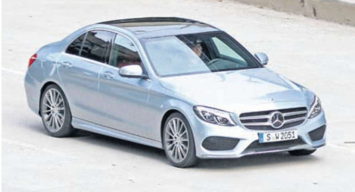
Mercedes Benz C-Class

Hann er einstaklega vel með farinn og eigandinn getur látið alla þjónustusögu hans fylgja með.