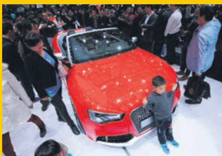
Börn erfa skoðanir foreldra sinna á bílum.

„coupe“-lag og X6 jeppinn, en er jeppingur á stærð við X3. BMW kom svo fram með M-útgáfur af X5 og X6 jeppunum, afar öfluguga bíla með 555 hestafla V8-vélum. BMW X5 er nú af þriðju kynslóð og X3 og X6 eru nú af annarri kynslóð. BMW ætlar að bæta enn einum bíl við blómlega X-flórana því X7 er á leiðinni og verður honum beint sérstaklega að Bandaríkjamarkaði líkt og X5- og X6-bílarirnir voru hugsaðir í upphafi. X7 kemur á markað árið 2016 og þá af árgerð 2017 og verður hann smíðaður í Spartanburg í S-Karólínuríki Bandaríkjanna. X7 verður með öflugum 6 og 8 strokka vélum og að sjálfsögðu stærri en X5 og X6 og mun keppa við stærstu jeppa Audi og Mercedes Benz, sem og stóra jeppa bandarísku framleiðendanna.