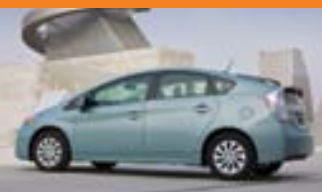
Toyota Prius á heiðurinn af 67% sölu allra hybrid-bíla Toyota.

Sergio Marchionne, forstjóri Fiat-samsteypunnar, jók við hlutabréfaeign sína í Fiat og keypti bréf fyrir 406 milljónir króna. Hann á nú hluti að virði 1,06 milljarða króna í félaginu sem nemur 0,42 af heildarhlutabréfaeigninni. Í ráðningarsamningi forstjórans eru ákvæði um aukioð eignarhald hans og er það hluti af launasamningi Marchionne. Með þessum kaupum vill Marchionne sýna að áætlanir hans um mikla stækkun fyrirtækisins á næstu árum séu raunhæfar. Margir hafa efast um þessi áform forstjórans og telja þau óraunhæf. Þessi gerningur hans sýnir þó að hann er sjálfur sannfærður um hraðan vöxt Fiat og fyrir það mun hann hagnast eða blæða eftir genginu á næstu árum. Gengi bréfa í Fiat stendur nú í um 10 evrum á hlut, en kaupverðið á þessum nýju hlutbréfum hans var mun lægra eða 7,7 evrur. Það má því ýmislegt ganga á til þess að þessi fjárfesting hans beri ekki ávöxt. Fiat er eins og kunnugt er eigandi bandaríska bílaframleiðandans Chrysler og ber starfsemi hans uppi hagnað Fiat-samstæðunnar.