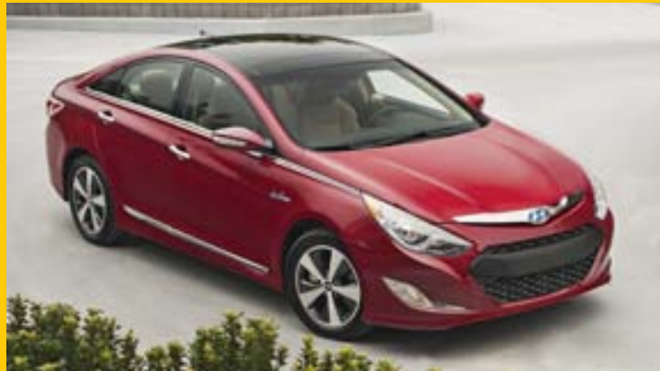
Hyundai Sonata hefur selst illa á lykilmörkuðum.