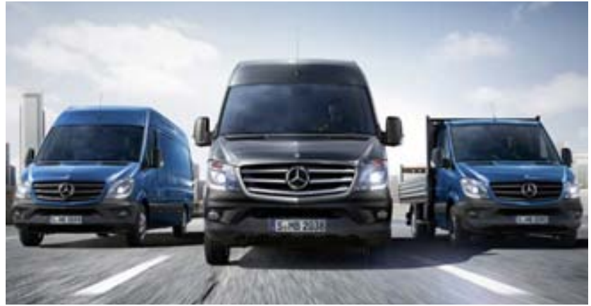
Mercedes Benz Sprinter-sendibílar af ýmsum stærðum

Á tímabili voru Mercedes Benz Sprinter-sendibílar seldir undir merkjum Dodge, en það samstarf hefur nú runnið sitt skeið.