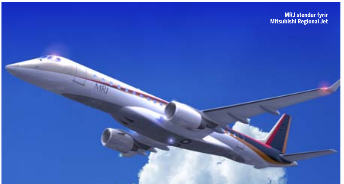
MRJ stendur fyrir Mitsubishi Regional Jet

1986 en þar er kappkostað að bjóða það allra flottasta sem nútíminn getur boðið hverju sinni. Með bílnum fæst sérhannað 5 hluta stórglæsilegt ferðatöskusett sem saumað er úr sama leðri og sætin í bílnum. Þessi lúxus allur er alls ekki gefins því bíllinn mun kosta litlar 249.877 evrur, eða 39 milljónir. Aðeins verða framleiddir bílar með stýrið vinstra megin svo ríkir Bretar gráta sig í svefn eftir lesturinn um bílinn góða. Þrátt fyrir allt afl bílsins eyðir hann aðeins 6,4-10,1 lítra bensins, eftir því hvort honum er ekið innanbæjar eða á utan, en meðaleyðslan er uppgefin 7,9 lítrar og mengunin er 245 g/km.