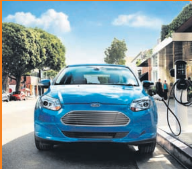
Ford Focus EV í hleðslu.