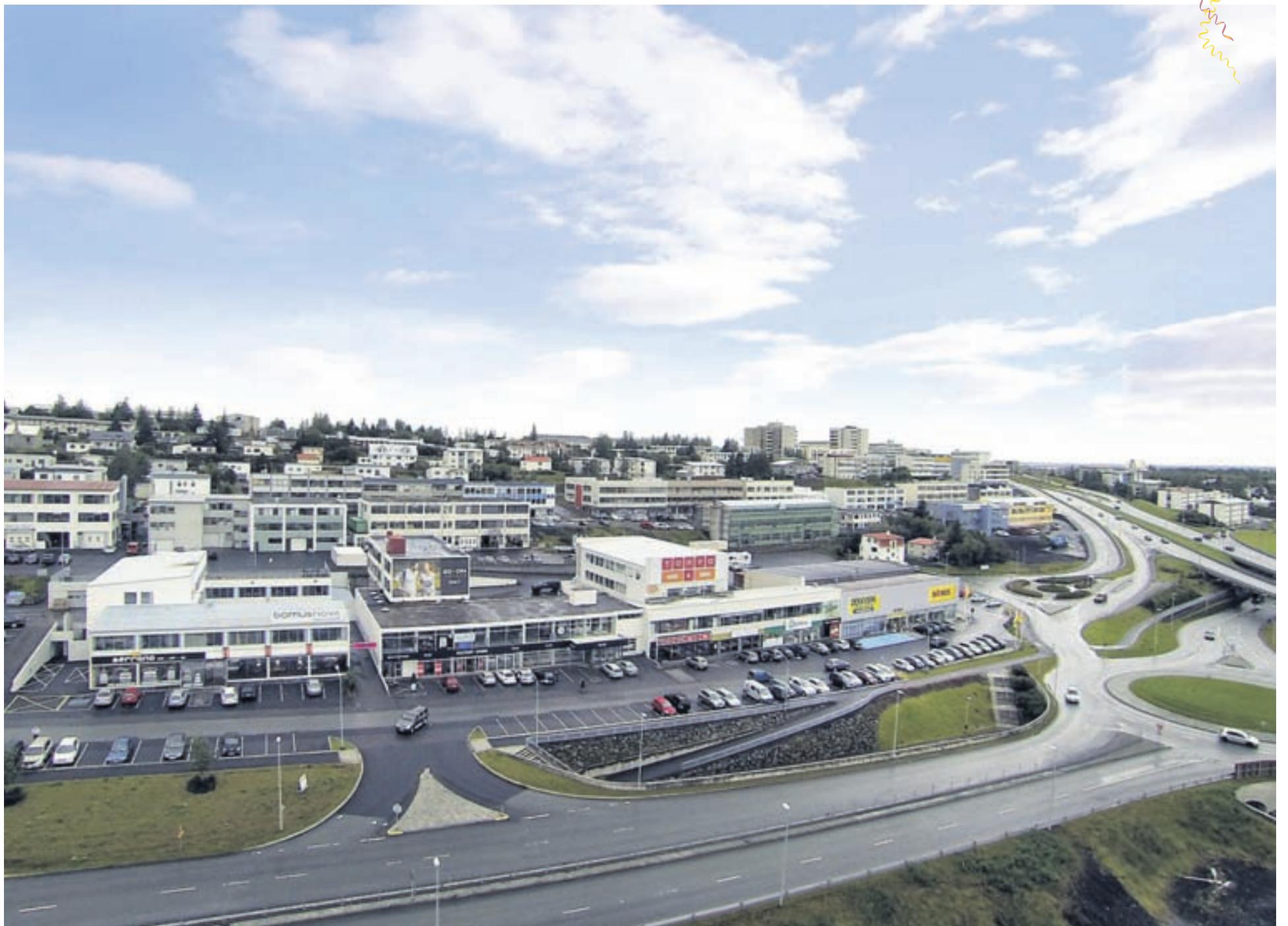
Uppbygging við Nýbýlaveg hefur verið blómleg undanfarið ár. Á morgun halda mörg fyrirtækjanna upp á eins árs afmæli sitt og opið er til kl. 22.