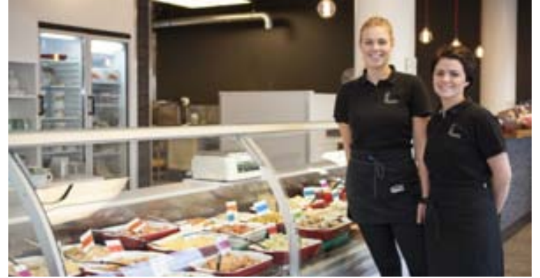
Það verður mikið fjör hjá Fylgifiskum á morgun á Nýbýlaveginum.

Hún segir að lögð sé mikil áhersla á gæði vörunnar. „Fiskurinn er nýr og ferskur. Allt grænmeti og krydd sem við notum eru sömuleiðis gæðavörur sem við vöndum valið á. Allir réttirnir eru gerðir frá grunni hjá okkur. Við setjum allan fisk á