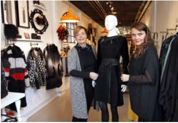
Allt í versluninni er hannað og saumað á staðnum.