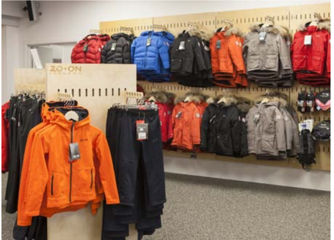
Glæsileg verslun Zo-on að Nýbýlavegi 6 var opnuð fyrir ári. Opið verður til klukkan 22 á morgun og léttar veitingar í boði.