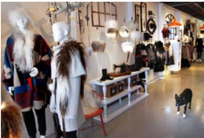
Í versluninni fæst fallegur kvenfatnaður, tösukur, hálsmen og fylgihluti úr leðri, selskinni og gæru. Sömualeiðis ljósakrónur og púðar úr íslenskri gæru.