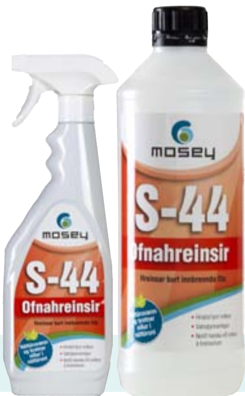
Óflugur ofnahreinsir sem auðveldar vinnuna.