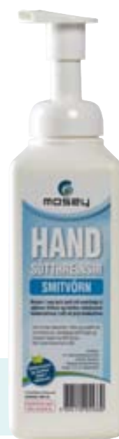
Heldur höndunum sýklafríum í allt að þrjár klukkustundir.