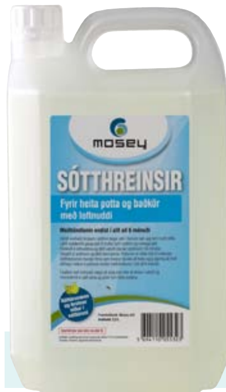
Ein meðhöndlun endist í allt að sex mánuði.