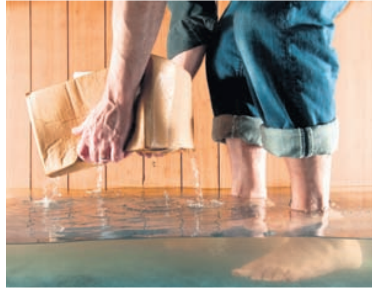
Vatnstjón á heimilum og í fyrirtækjum nam á þriðja milljarð árið 2013.

Frekari upplýsingar má nálgast á www.husogheilsa.is