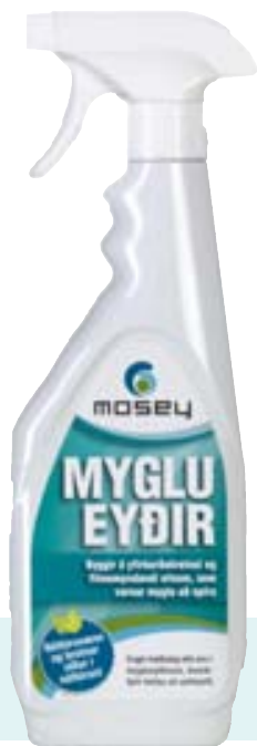
Varnar mygluvesti og seinkar komu hennar í raka.