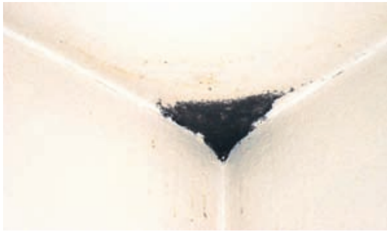
Mygla getur valdið alvarlegum veikindum, jafnvel svo að fólk þurfi að hverfa af vinnumarkaði.

Ef rakavandamál eru til staðar er helsta markmiðið að finna upptök, kanna ástand á byggingarefnum og lagfæra. Mygla er sjaldnast sýnileg, hún er oftast til vandræða innan í veggjum, undir gólfefnum eða í þakrymum. Mygla við rúður og í þéttiefnum getur vissulega haft áhrif en íbúar geta sjálfir í flestum tilfellum haft stjórn á því. Fræðsla til almennings og fagaðila er nauðsynleg þar sem enn þá er ekki alltaf tekið nógu alvarlega á málum, oft með skelfilegum afleiðingum. Við erum einmitt með námskeið hjá lðunni fræðslusetri núna 2. október.“