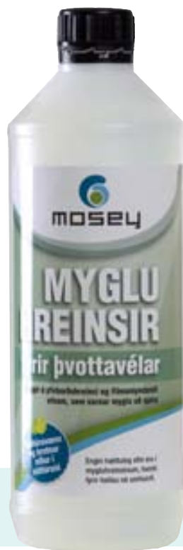
Hindrar myglu í að setjast í þvottavélar.