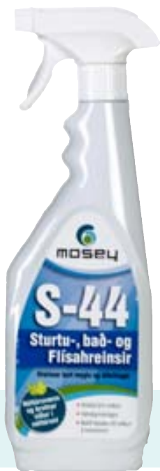
Hreinsar burt myglu og útfellingar frá heita vatninu.

Vörurnar frá Mosey fást í verslunum Húsasmiðjunnar, Málningarverslun Íslands við Vatnagarða og í Málningarbúð Ísafjarðar.