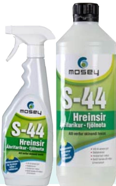
Hentar vel til allra almennra þrifa.