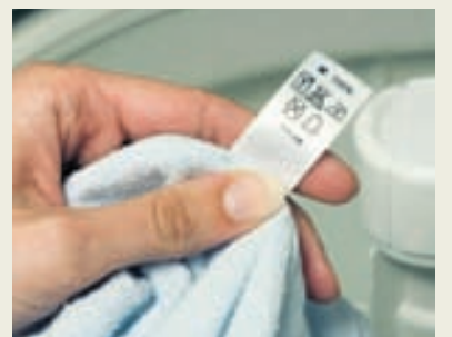
Merkingar á fatnaði sýna hvaða hita fötin þola.

Útgefandi: 365 miðlar ehf., Skaftahlíð 24, s. 512 5000