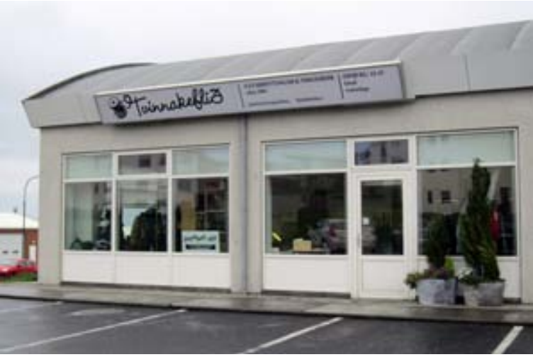
Tvinnakeflið ehf. er til húsa að Melabraut 29 í Hafnarfirði en var áður í vesturbæ Hafnarfjarðar.