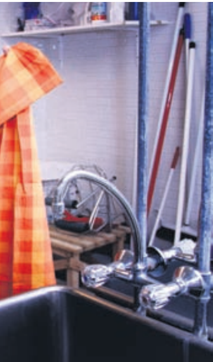
Þvegnum borðdúk í þvottahúsi skólans.