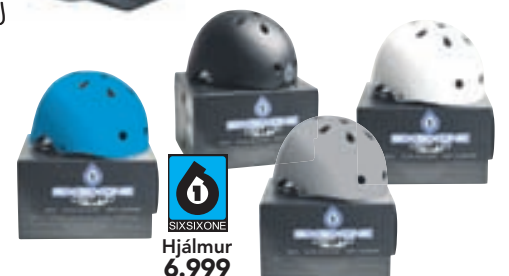
SIXSIXONE Hjálmur 6.999