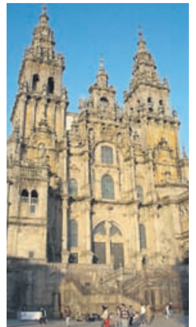
Dómkirkjan í Santiago, Spáni.