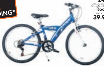
24" CROSS Rocky vnr. 912953 39.999