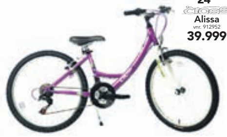
24" CROSS Alissa vnr. 912952 39.999