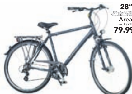
28" CROSS Areal vnr. 889780 79.999