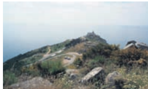
Haukur tók aukakrók til Heimsenda (Finisterre).