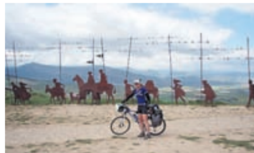
Meðal annarra pílgríma í Baskalandi, Spáni.