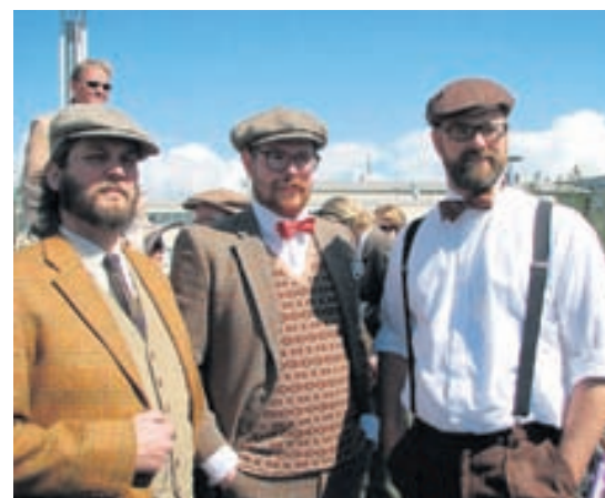
Það er augnayndi að fylgjast með klæðaburði hjólræiðafólks í Tweed Ride. Síðast hjóluðu níutíu manns um miðbæinn og nú stefnir fjöldinn í 120 hjólræiðamenn.

Þátttakendur Tweed Ride Reykjavík mæla sér mót við Hallgrímskirkju