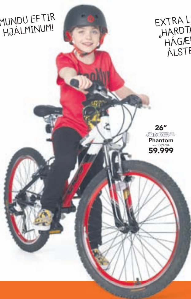
26" CROSS Phantom vnr. 889784 59.999