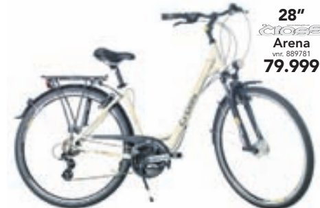
28" CROSS Arena vnr. 889781 79.999