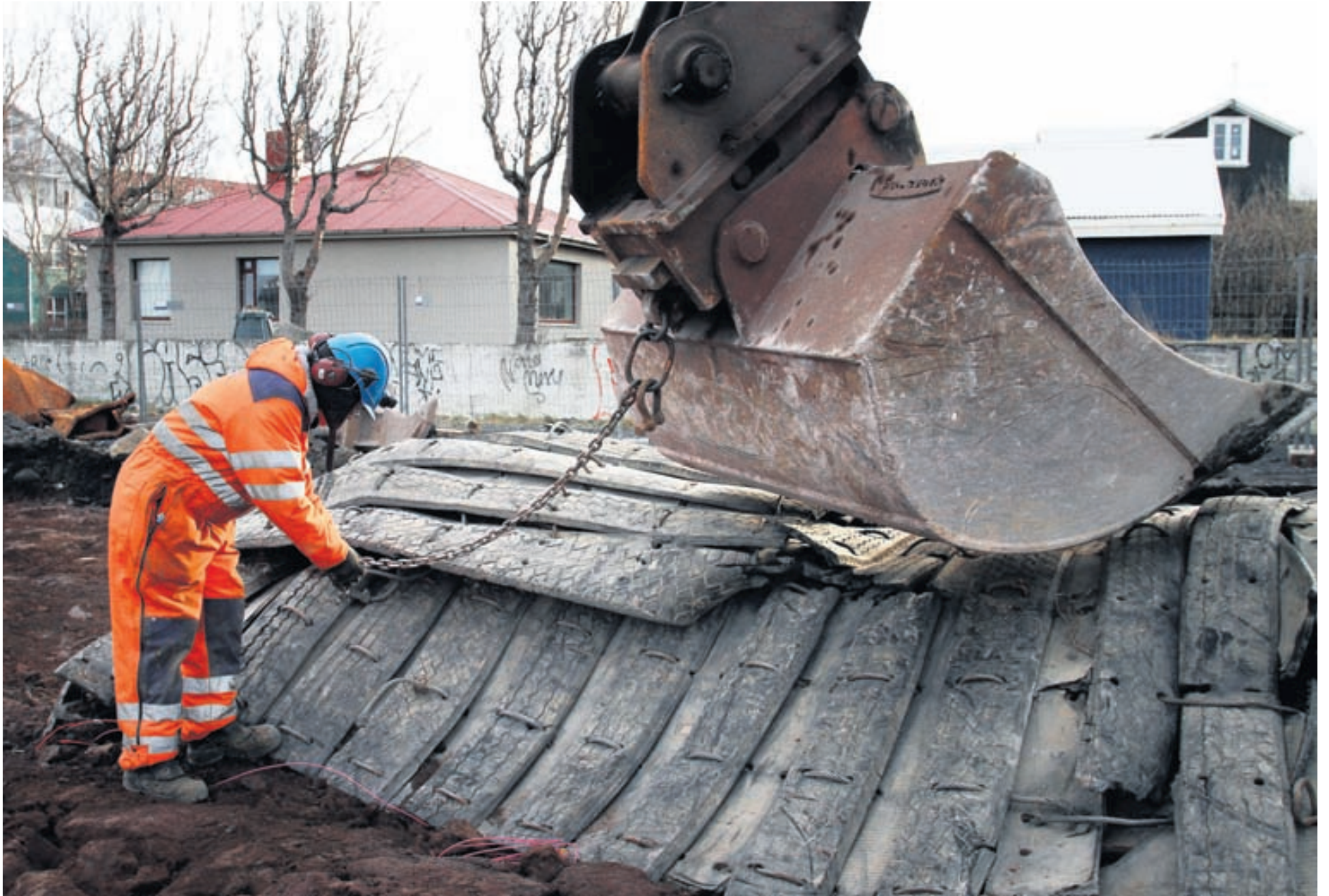
Vonast er til að með breytingunum verði öryggi gegn skemmdum betur tryggt.

Kynningarblað Vinnueftirlitið, Verkfræðistofan EFLA og vinnuverndarvikan 2014.