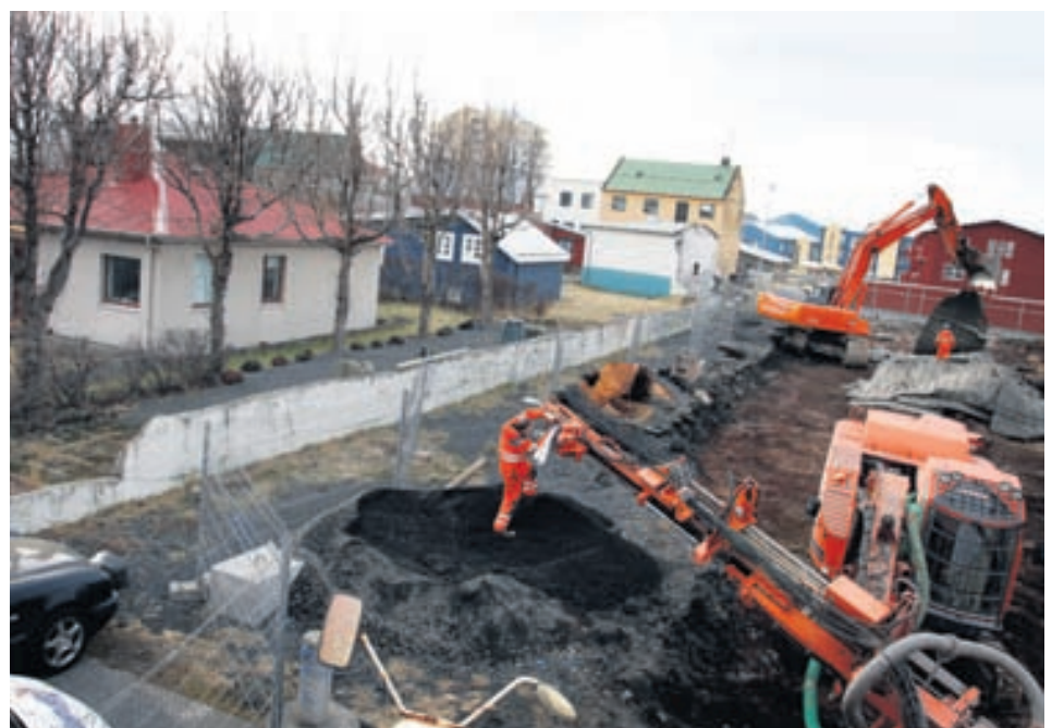
Vonast er til að með breytingunum verði öryggi gegn skemmdum betur tryggt.

Í ljósi kvartana og upplifunar íbúa á svæðinu taldi Vinnueftirlitið rétt að skoðaðar yrðu leiðir til að minnka „sprengjuaflið“ í samráði við framkvæmdaraðila verksins. Við því hefur Þingvangu ehf., sem er framkvæmdaraðili verksins, orðið jafnvel þó af því hljótist aukinn kostnaður. Það er von Vinnueftirlitsins að með þeim breytingum er gerðar hafa verið á skipulagi og hleðslu við sprengingar á Lýsisreitnum verði öryggi gegn skemmdum betur tryggt og óþægindi minni en áður var.