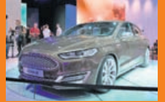
Ford Mondeo Vignale.

Mælaborðið í Honda Accord er smíðað í einu lagi til þess að koma í veg fyrir að í því hrikki. Innrétting bílsins hefur tekið stórstígum framförum frá síðustu kynslóð. Öll stjórnæki eru einföld og skiljanleg.