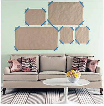
Gott getur verið að skipuleggja sig áður en negl er í vegg.