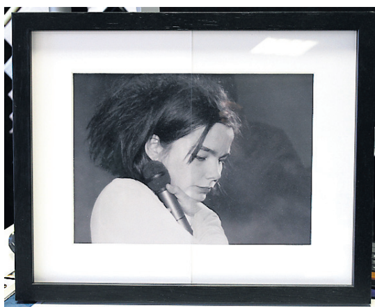
Innrammarinn býður líka upp á glampafrítt gler og úrval ramma úr áli og tré.

Auk hefðbundinnar innrömmunarþjónustu selur Innrammarinn tilbúna ramma, bæði úr áli og tré. Viðskiptavinurinn getur komið með mynd á staðinn, valið ramma og bedið á meðan karton er skorið í rammann. „Þá bjóðum við upp á sérsmíði á speglum. Hægt er að velja rammaefni sem