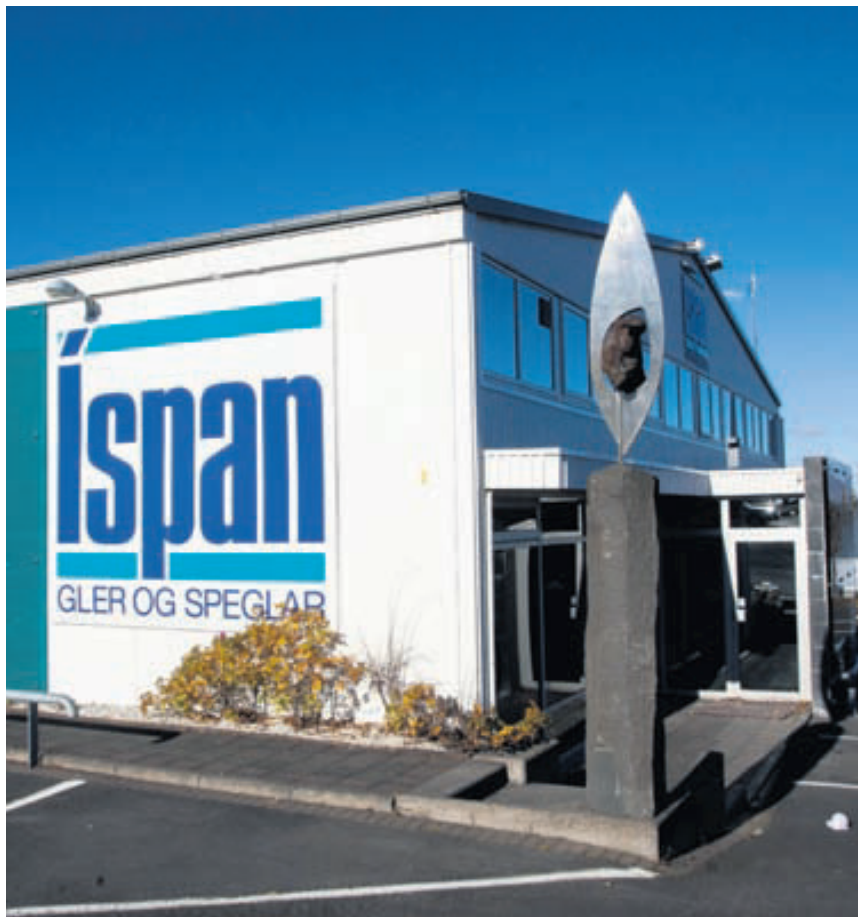
Íspan er á Smiðjuvegi 7 í Kópavogi. Á söluskrifstofunni kvikna margar hugmyndir enda úrvalið ótrúlegt.