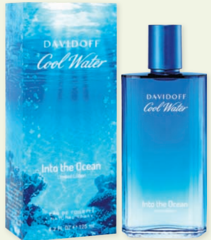
Davidoff Cool Water-herrailmur.

„Það sem einnig er svo skemmtilegt við Indiska er að þú getur komið hingað inn og keypt þér flott föt en líka eitthvað fallegt fyrir heimilið. Heimilislínan inniheldur allt frá kaffi og tei til rúmteppa og gardína, matarstella og fallegra lugta. Hér er hugsað fyrir öllu.“