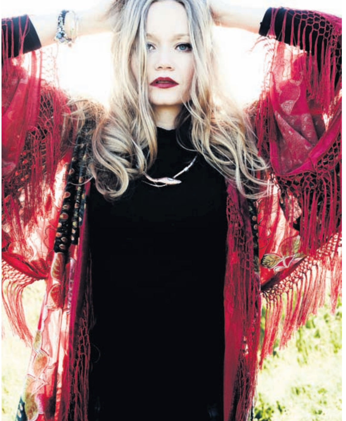
Saga Sig er hæfileikarík og drifandi ung kona sem er óhrædd við að vinna mikið til að ná markmiðum sínum.

með er sennilega Nike Women, ég vann beint með listrænum stjórnanda þeirra í Bandaríkjunum og það var eitt skemmtilegasta verkefni sem ég hef gert. Fyrir nokkrum vikum myndaði ég svo fyrir LEICA, sem er eitt virtasta myndavéla fyrirtæki í heimi, en ég myndaði fyrir blaðið þeirra, LEICA S. Ég fékk einnig birtar myndir í Vogue Japan og í Dazed and Confused sem var mjög mikilvægt fyrir mig. Svo hef ég kennt ljósmyndun í St. Martins-háskólanum í London og í Ljósmyndaskólanum hér heima en það finnst mér mjög gefandi.“