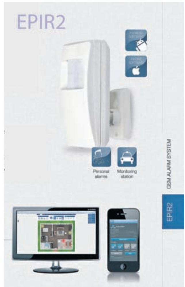
EPIR2-kerfinu er hægt að stjórna með sms-i eða appi frá snjallsíma.

Hægt er að versla við IP kerfi að Reykjavíkurvegi 60 í Hafnarfirði og í vefversluninni www.ipkerfi.is . Þar eru alltaf góð tilboð í gangi og nú 30 prósentu afsláttur af öryggiskerfum fyrir sumarhúsaði.