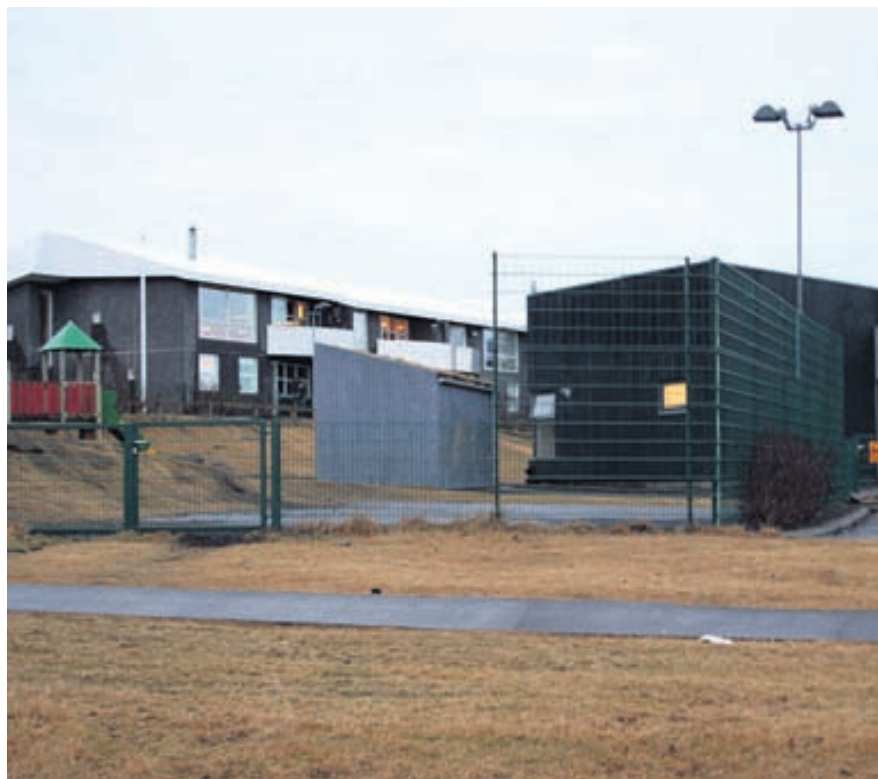
Öryggisgirðing frá Hagvísi í kringum leikskólann Ása.