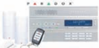
Magellan 6250 þráðlaust öryggiskerfi

Frekari upplýsingar má nálgast á heimasíðu fyrirtækisins, www.leidni.is