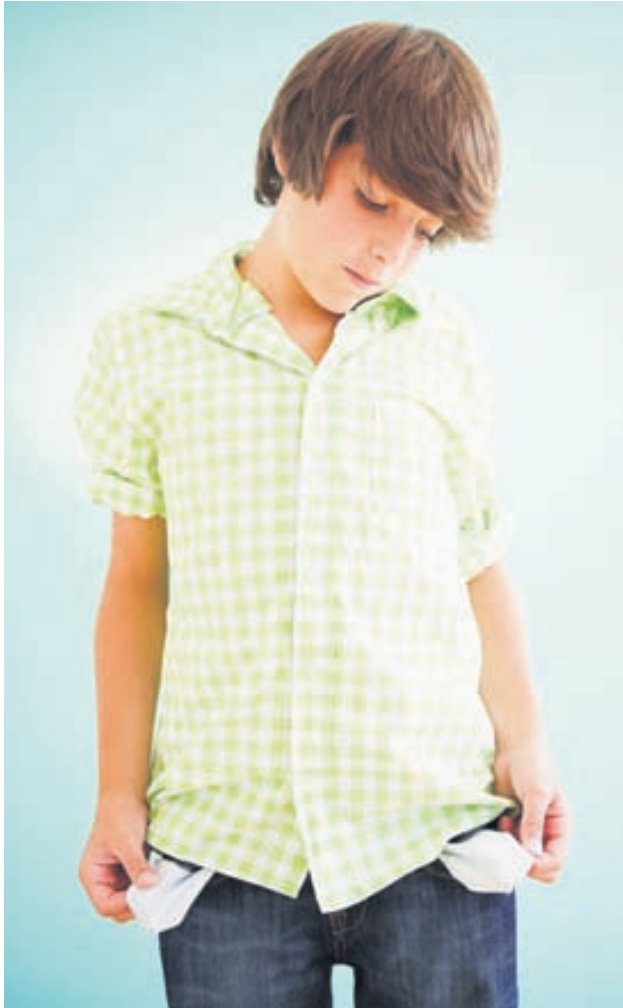
Í nýrri námsskrá grunn- og framhaldsskóla er kveðið á um kennslu í fjármálalæsi en ekki er enn búið að ákveða hvernig þessi kennsla skuli fara fram.