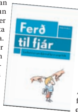
Sjónvarpsþættirnir „Ferð til fjár“ voru sýndir á RÚV og í framhaldi kom út kennslubók í fjármálalæsi með sama nafni.