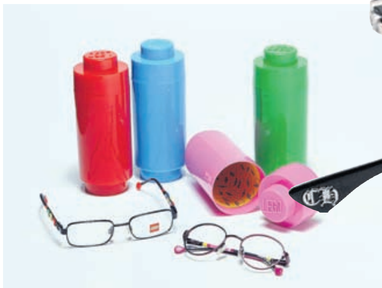
Hugvit Lego nær nú til barnagleraugna sem Optical Studio er með umboð fyrir og kynnim um þessar mundir.

Strax í upphafi var þó komið upp þeirri þjónustu að fólk gat valið og fengið smíðuð gleraugu í verslun