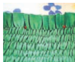
Saumið með teygjutvinna rendur efst í bolinn.

3. Saumið með teygjutvinna í bolinn. Byrjið efst þar sem bolurinn var klipptur í sundur. Munið að skilja eftir nógu langan enda af teygjutvinnunum til að binda saman þegar komið er hringinn. Gott er að leita sér leiðbeininga um hvernig sauma á með teygjutvinna, áður en byrjað er.