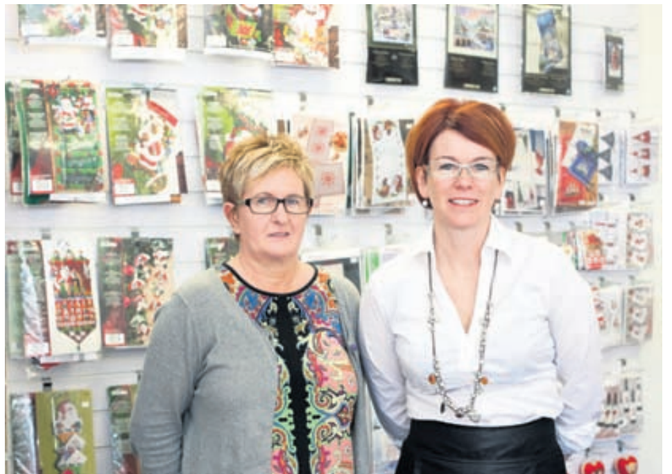
Starfsfólk Ömmu músar býr yfir mikilli reynslu.

Nánari upplýsingar um verslunina má finna á Facebook-síðu hennar.